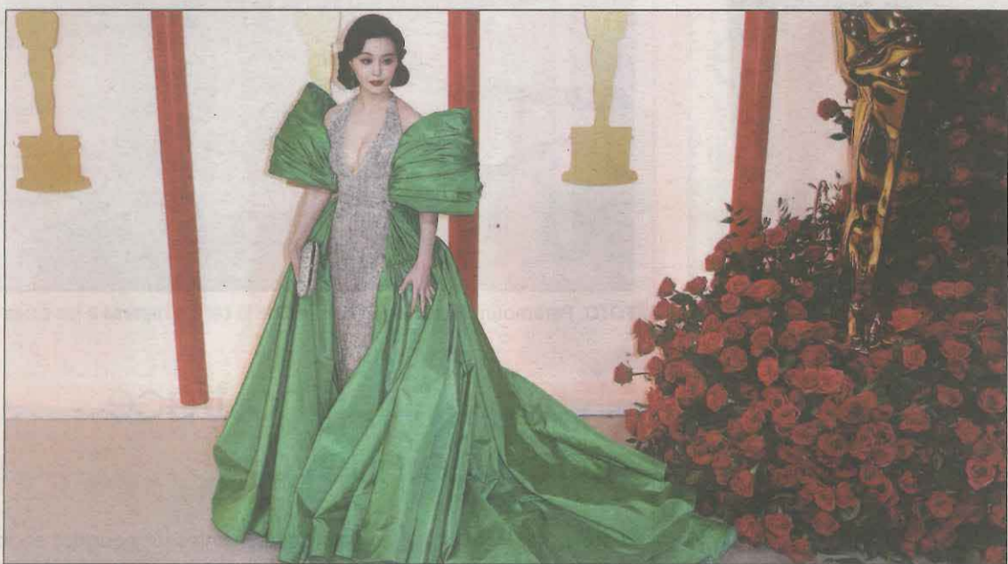
L'arribada de l'actriu Fan Bingbing a la cerimònia al Dolby Theatre de Hollywood

Al repertori que va brindar al públic no van faltar El Testament d'Amelia , Isabel (Dotze cavallers) o La Dama de Reus (El Capitel-lo) .