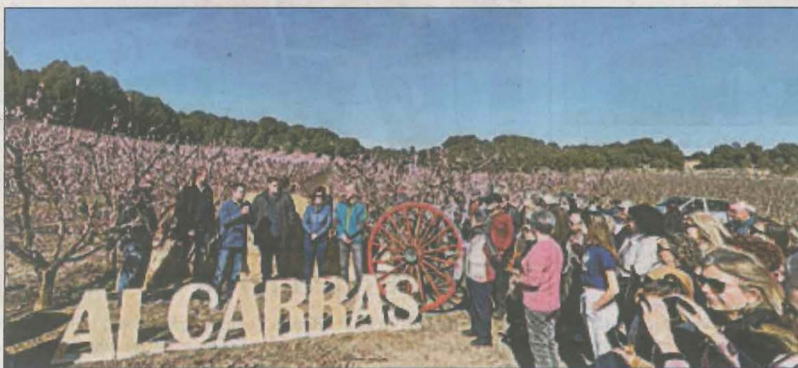
El consistori ha ampliat els dies de rutes i hi haurà excursions el 18 i 19 de març

El primer cap de setmana de la desena edició de l'Alcarràs Florit ha atret aquest 11 i 12 de març més de 300 persones procedents de diferents llocs de Catalunya. Arran l'èxit de la iniciativa, l'Ajuntament ha decidit ampliar els dies de les rutes i també hi haurà excursions el 18 i 19 de març, segons va comunicar l'alcalde.