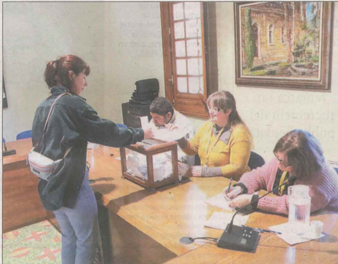
Una de les votants a la consulta de la Pobla de Segur celebrada ahir