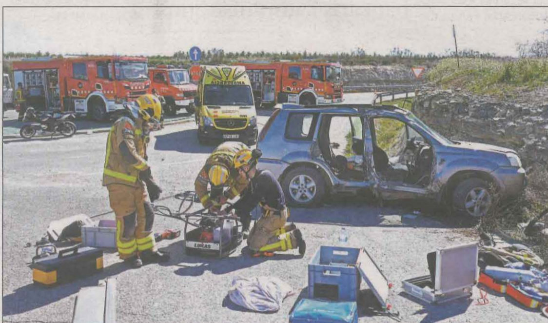
Los Bombers tuvieron que excarcar a uno de los ocupantes del vehículo

► El siniestro causa congestión en la C-233, con paso alternativo