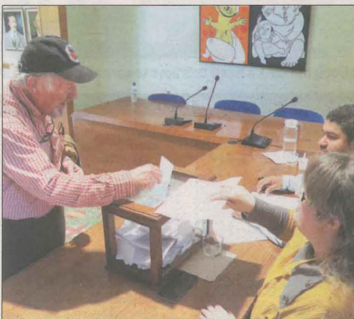
La consulta se realizó ayer en la Pobla de Segur