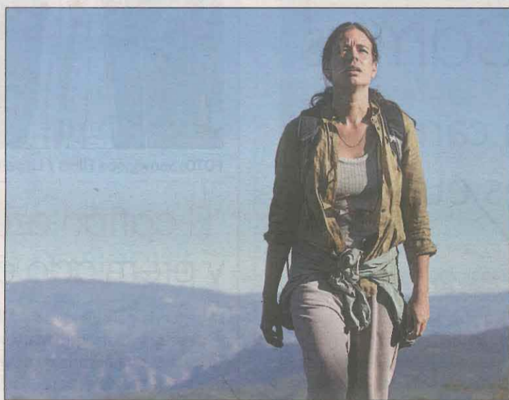
L'actriu Laia Costa, en una escena de 'Els encantats'