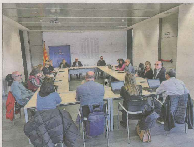
Reunió del Servei Català de la Salut ahir al Pallars Jussà