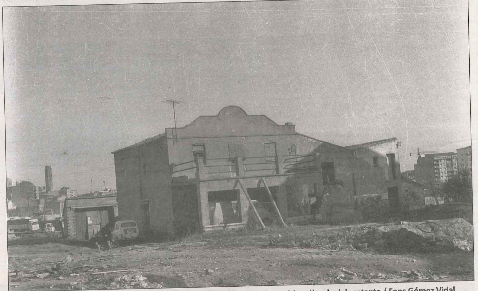
Una torre rural a la zona del Passeig de Ronda amb la Seu Vella al fons, a mitjan dècada dels setanta