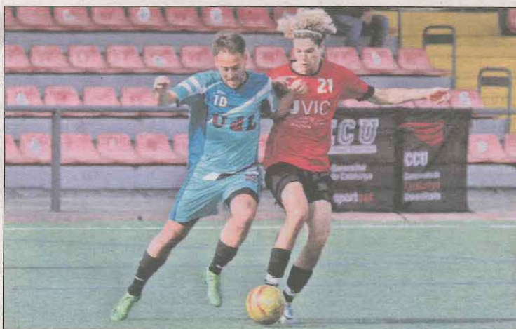
El campo municipal acogió el torneo de fútbol

Los deportistas de la Universitat de Lleida consiguieron la primera posición en las competiciones de fútbol 11 masculino y en la de balonmano femenino. Hoy se disputan las últimas finales del torneo. | PÁG. 35