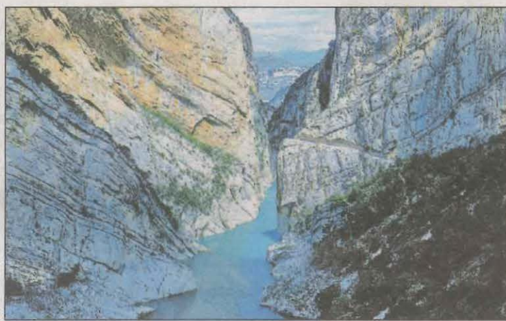
Imatge d'arxiu del Congost de Mont-rebei

Els serveis d'emergències van ser alertats a les 11.03 hores que un parapentista havia tingut un aparatós accident mentre sobrevolava el Congost de Mont-rebei. Fins al lloc es va desplaçar un helicòpter del GRAE del cos de Bombers amb un metge del SEM. Posteriorment, fonts dels Mossos i dels Bombers van confirmar que no es tractava d'un parapentista sinó d'un home que estava fent salt base. Una vegada localitzada la persona accidentada, l'helicòp-