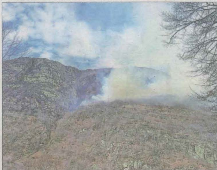
Fum procedent de l'incendi forestal de Canejan

ter va deixar els efectius a terra, que en fer-li el reconeixement van confirmar que estava morta. L'helicòpter es va retirar fins al Prat d'Àger i els efectius van esperar l'arribada de les autoritats judicials. En aquest sentit, es va activar la patrulla d'Investigació de la Noguera dels Mossos, que va fer suport i coordinació de les tasques judicials en l'aixecament del cos. També s'hi van desplaçar efectius de la Unitat d'Intervenció a Muntanya dels Mossos d'Esquadra, en helicòpter, per fer l'extracció de la víctima.