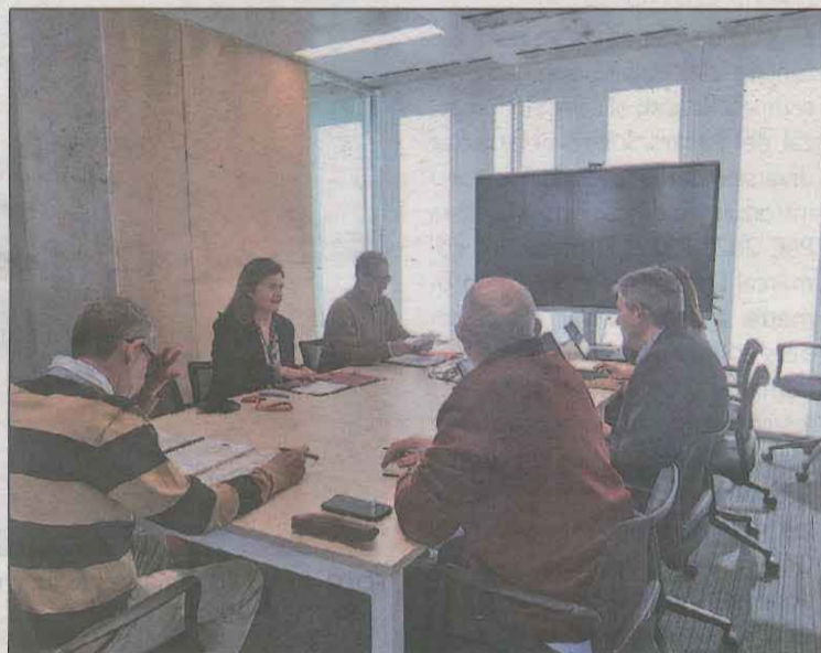
Les dues institucions es van reunir ahir