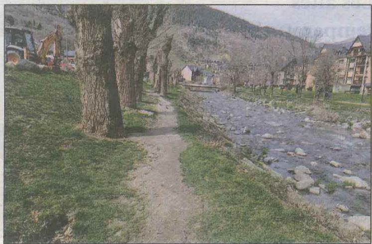
FOTO: Vielha / Es farà un recorregut urbà per passejar i fer esport

Una vegada eliminats els elements que dificulten el pas dels vianants, es pavimentarà amb