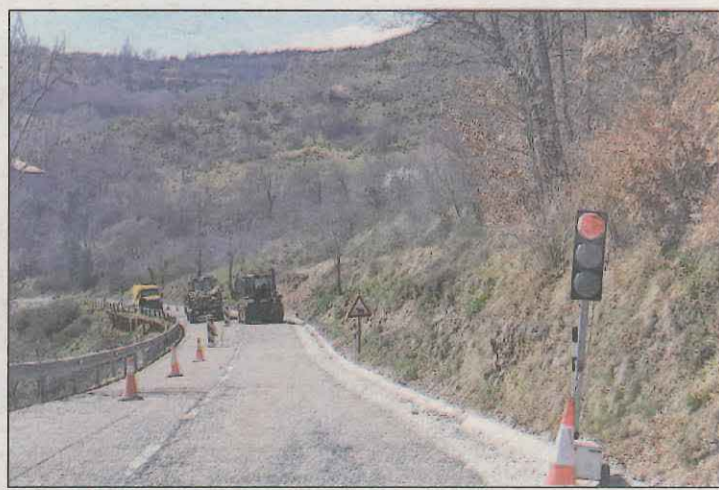
Màquines treballant ahir a la carretera pirinenca

Betren es muntaran un reguitzell de balises cada 10 metres per a il·luminar el camí fins al pont de Betren. El projecte té un cost de 296.277,95 euros permetrà crear un recorregut urbà saludable perquè pugui ser gaudit per la canalla, famílies, gent gran i esportistes amb un total d'1,5 km.