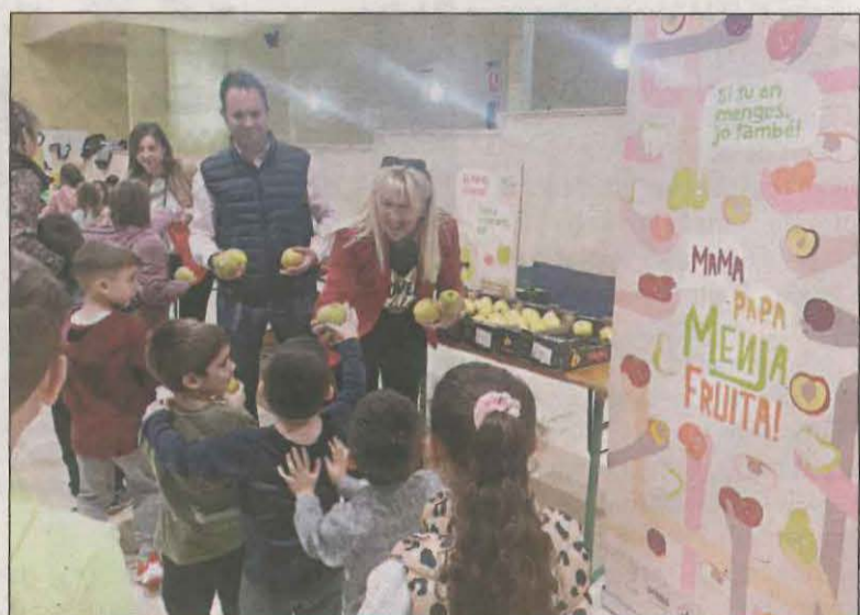
Els infants que van participar van rebre una poma

campanya té com a base un missatge d'empoderament de les nenes i els nens, donant-los més responsabilitat i mirant que siguin elles i ells els garants del consum de fruita a casa seva. Amb aquesta campanya, impulsada des del Consell Comarcal del Segrià s'aposta per sensibilitzar els nens i nenes en la importància de que les famílies consumeixin fruita.