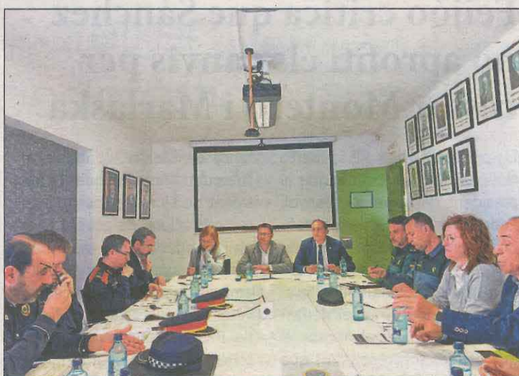
Autoritats a la Junta de Seguretat d'Alcarràs

creixement dels delictes contra el patrimoni, que pugen un 10,25% i passen de 234 a 258. No obstant això, les dades mostren que en la darrera dècada, els delictes contra el patrimoni a Alcarràs han disminuït un 33,3%. En la resta d'àmbits, els delictes es mantenen en uns índexs similars als dels darrers anys, i es va destacar la "bona feina" de la Policia Local.