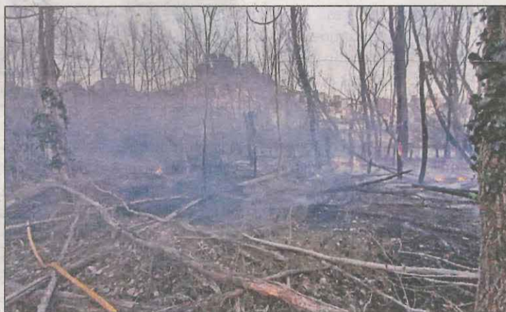
La llera del riu Segre cremada, a Camarasa

Els Agents Rurals van activar ahir el nivell 2 del Pla Alfa a 31 comarques de Catalunya per un alt perill d'incendi. El cos va fer vigilància exclusiva d'incendis. El Segrià, les Garrigues, la Noguera, l'Urgell i la Segarra van ser les comarques lleidatanes on els Agents Rurals van considerar que s'havia d'activar el nivell 2 del pla Alfa, que en l'escala de perill està mesurat com a molt alt.