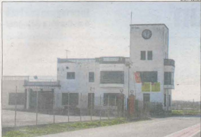
L'edifici de Cal Trepat que acollirà l'alberg.