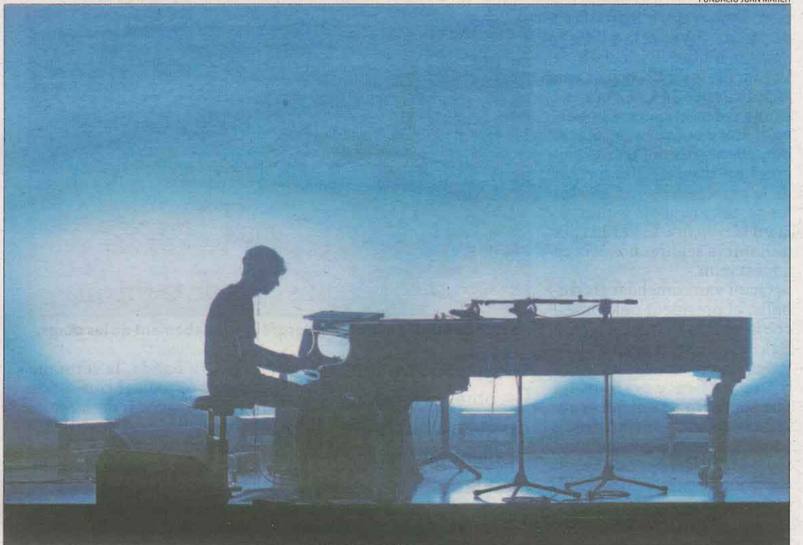
FUNDACIÓ JUAN MARCH

No necessàriament. És que hi ha molts compositors marginals que s'han quedat oblidats. El cànon de vegades no és just, ni justificable. A mi m'agrada