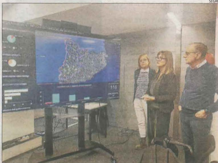
Seguiment de la prova a la delegació del Govern a Lleida.

hi ha temps fins avui a les 09.00 hores, l'enquesta disponible en el següent enllaç: https://arcg.is/1mS58z0 . Es tracta de la primera prova de les quatre que es faran a tot Catalunya per donar a conèixer entre la població el sistema d'alertes de Protecció Civil, que només s'utilitzarà en emergències greus en les quals sigui necessari donar instruccions concretes a la població. El pròxim simulacre serà el 12 d'abril a Tarragona. Molts ciutadans es van veure sorpresos ahir per l'estrident so de l'alerta als seus mòbils. El telèfon 112 va atendre fins a les 12.00 hores un total de 203 trucades sobre la prova o perquè desconeixien que es faria.