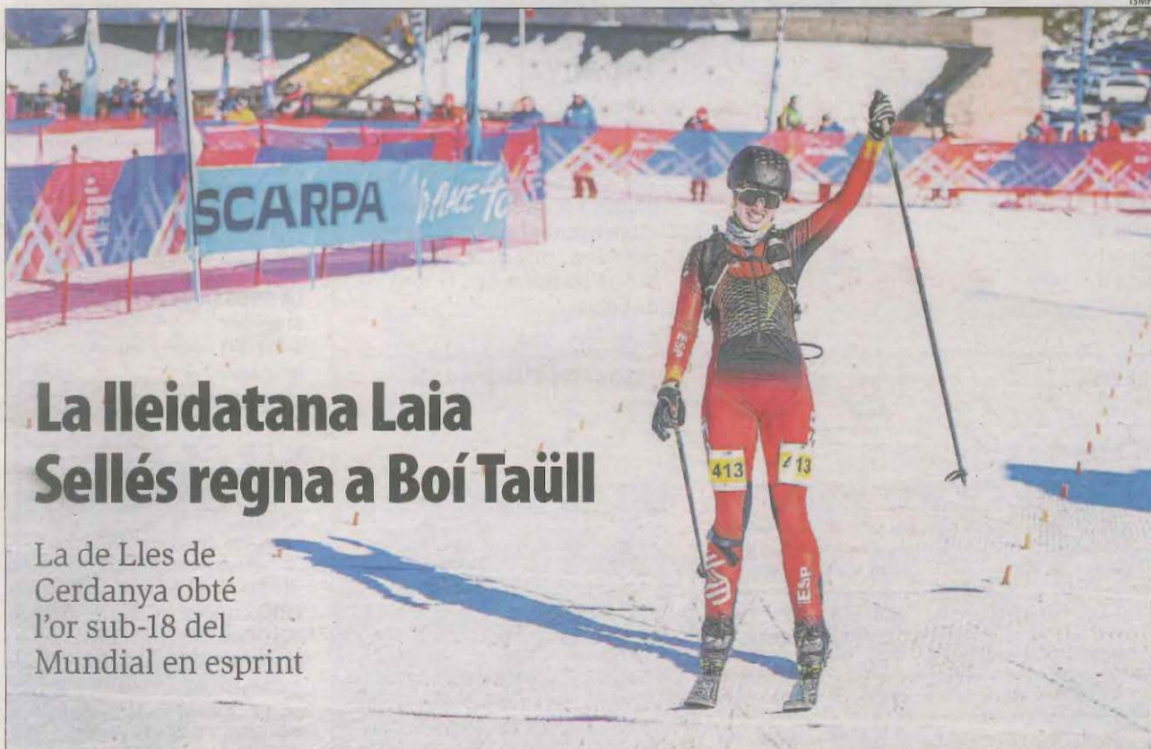
ÉS NOTÍCIA | 3-4