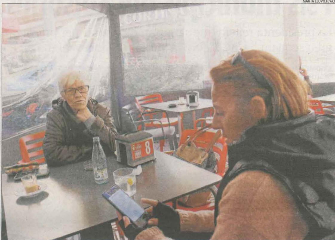
Una dona consulta el missatge de Protecció Civil a la terrassa d'un bar a la Pobla de Segur.

203 trucades fins a les 12.00 hores per demanar informació sobre l'avís o perquè no sabien què era