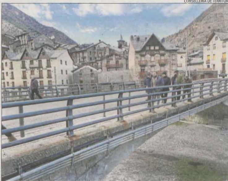
El conseller Fernández, amb les autoritats al pont de Llavorsí.

El nou tren a la Pobla sortirà de la capital del Segrià a les 13.39, mentre que un altre partirà a les 13.00 des de la Pobla amb destinació Lleida. Així es va aprovar ahir en la comissió de seguiment de la línia, en la qual també es va ratificar una millora dels horaris. En aquest sentit, s'avançaran els dos primers trens que surten de Lleida. A partir de l'abril ho faran a les 04.59 i a les 07.32 hores. Aquest últim ajustament permetrà reduir el temps d'espera en el transbord amb el tren Avant que arriba des de Barcelona. Així mateix, el primer tren del dia des de la Pobla sortirà abans, a les 06.55. Des de FGC esperen que aquestes modificacions permetin guanyar fins a 32.760 viatgers a l'any. De fet, el tren de la Pobla va tancar el 2022 amb les millors xifres de la seua història. En concret, la línia va rebre 278.000 viatgers. El Tren