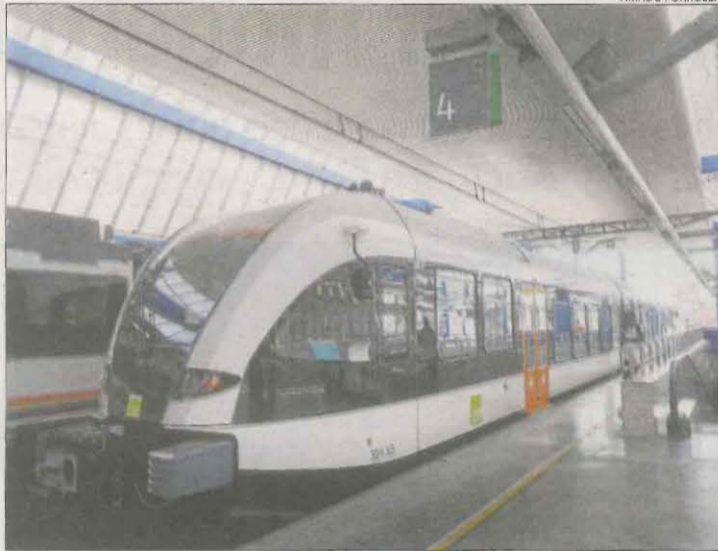
Imatge d'arxiu del tren de la Pobla a l'estació de Lleida.

Així mateix, Segarra es va referir a la nova freqüència que la línia de tren de la Pobla estrenarà a l'abril. Va recalcar