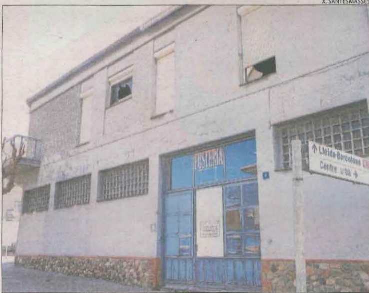
El magatzem de Sant Guim on van trobar la plantació.

SANT GUIM DE FREIXENET | La Policia Nacional va detenir ahir un home a Sant Guim de Freixenet com a presumpte responsable d'una plantació de marihuana, segons ha pogut saber aquest diari. L'operació es va dur a terme a primera hora del matí en un antic magatzem que va ser adquirit per un home que no és veí d'aquesta localitat de la Segarra. Els agents van esbotzar les portes d'accés i les finestres i van arrestar l'home pels delictes contra la salut pública i defraudació de fluid elèctric. Van comprovar que a l'interior del local hi havia una plantació indoor de marihuana preparada