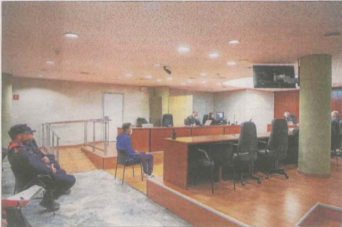
L'acusat, que va ser detingut dimarts, va estar custodiat per quatre agents dels Mossos.

La víctima, agricultor de professió, va explicar com van ocórrer els fets. Va ser a les 5.45 hores quan dormia amb la seua parella i va escoltar que el motor del seu camió s'engegava. “Era dilluns, un dia que no fem repartiment, per la qual cosa no podia ser el meu germà”, va afirmar. Va sortir al balcó i va observar un individu dins del vehicle. Va baixar al carrer. “Li vaig cridar perquè sortís. A l'obrir la porta, es va girar i em va disparar