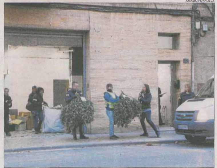
Els Mossos van decomissar 3.775 plantes en la batuda de dimarts.

D'altra banda, està previst que entre avui i demà passin a disposició els vint detinguts dimarts passat pels Mossos d'Esquadra en una macrobatuda a Ponent (vegeu SEGRE d'ahir).