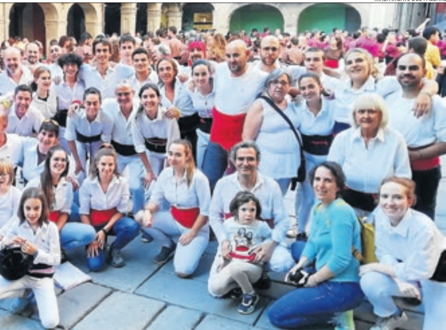
en una actuació castellera el passat mes d'octubre a Guissona.