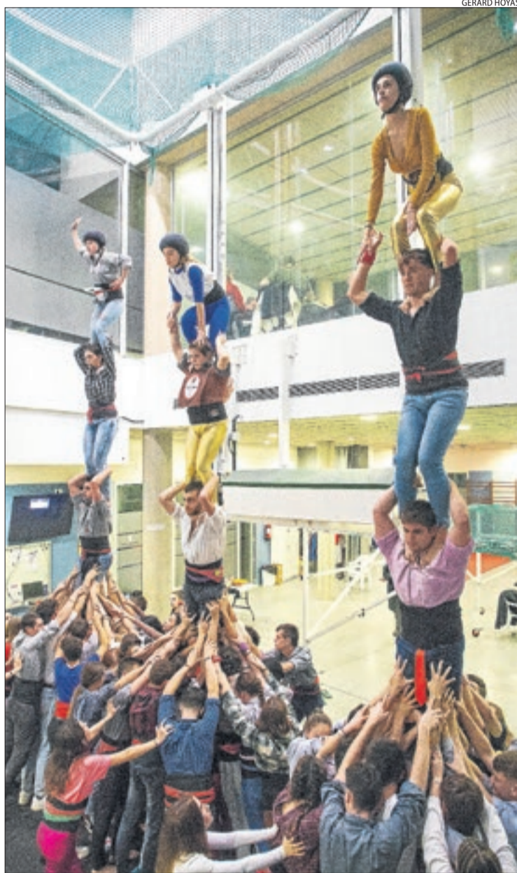
Assaig dels Marracos el febrer passat, en ple Carnaval.