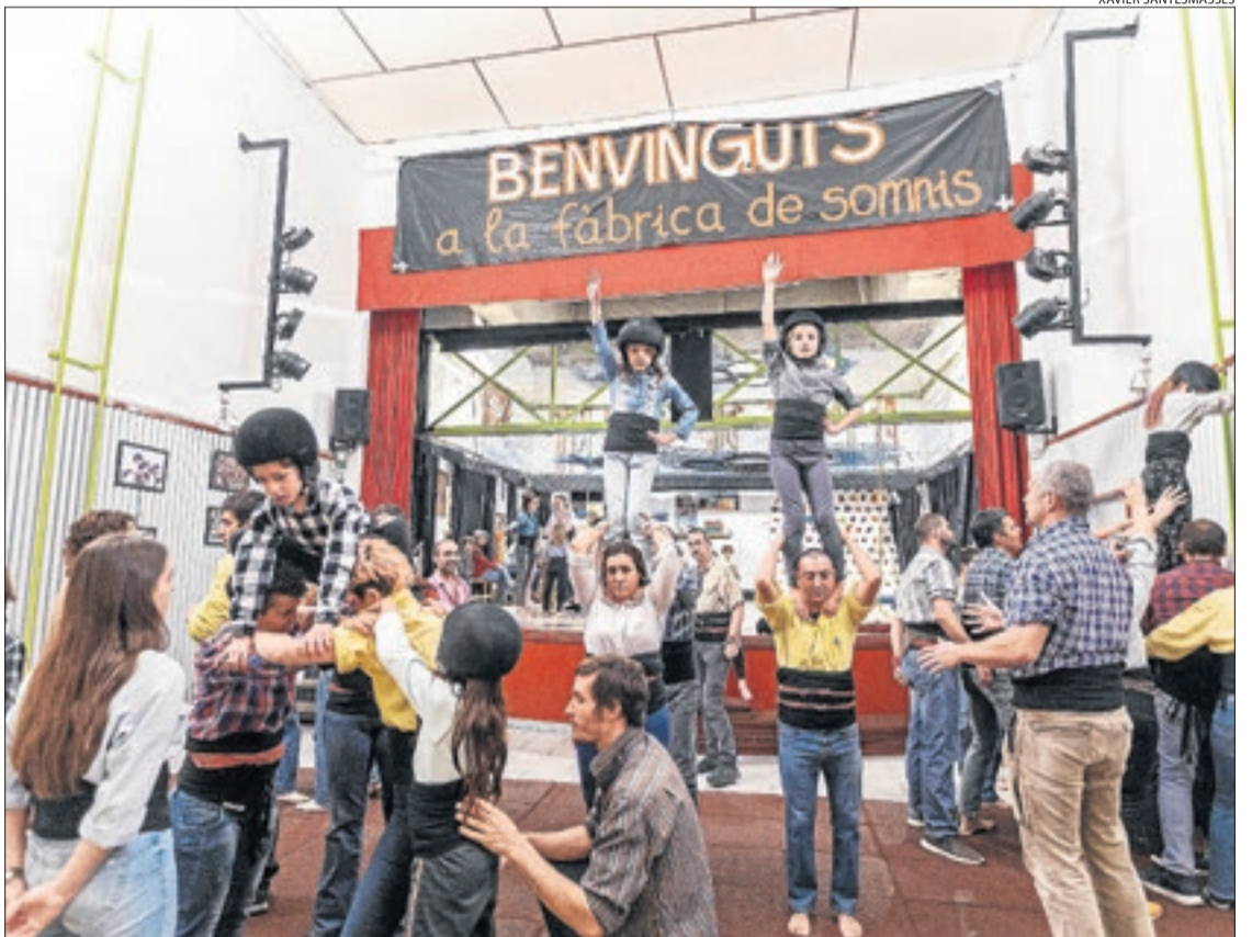
Un dels assajos recents dels Margeners, a punt ja d'estrenar la nova temporada castellera.

La resposta dels Margeners a aquesta vertebració del territori és idèntica. Així, és el grup habitual a les festes de la cultura popular de bona part de les poblacions de Lleida. Els trobem participant en La Nit del Tararot de Tàrrrega o en