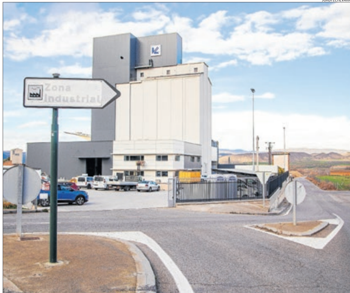
La zona industrial d'Almenar que s'ordenarà i on s'ubicarà la nova planta d'Alier.