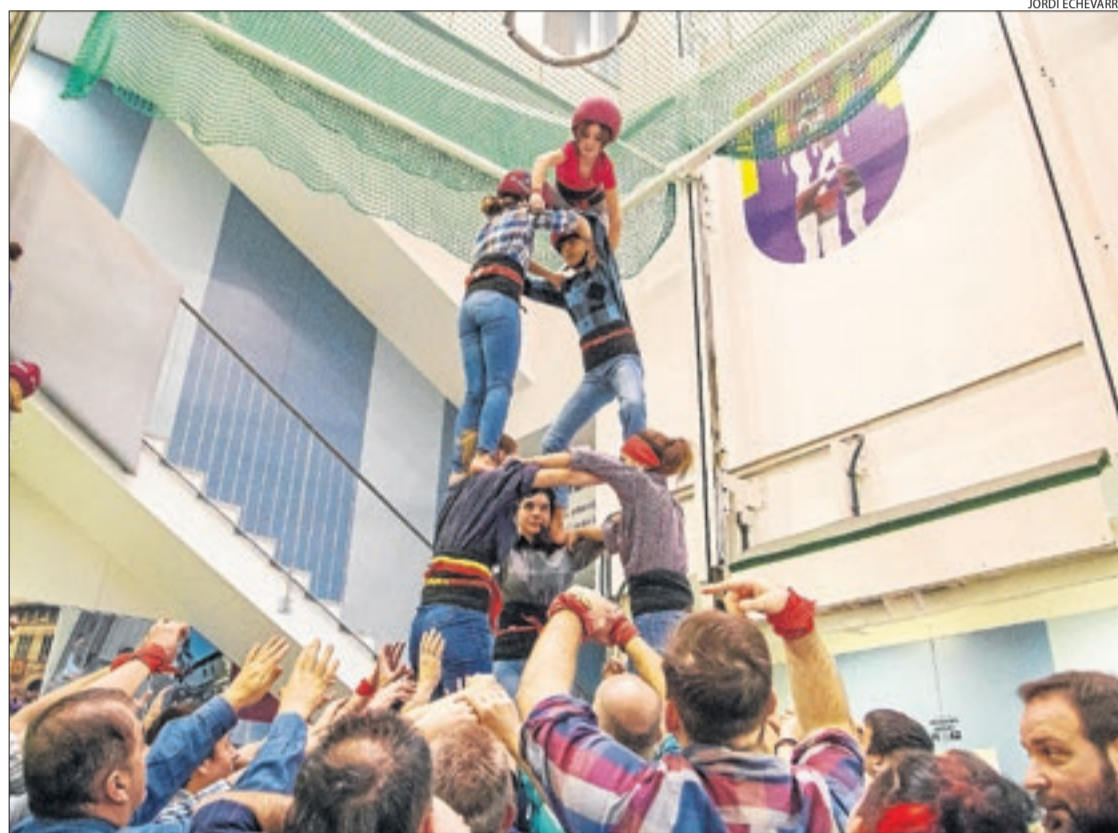
Els Castellers de Lleida, en ple assaig al seu local al centre històric el mes de febrer passat.

Els Castellers de Lleida fins i tot van haver de "teletreballar" durant la pandèmia per intentar mantenir la cohesió i no perdre gent. Ara als assajos regulars se citen almenys un centenar de persones de totes les edats, una xifra que a les actuacions assenyalades de l'any pot créixer fins a les 150 o 200. La formació lleidatana estrena la nova temporada amb un objectiu clar: consolidar-se com una colla de 8, després del 4 de 8 acon-