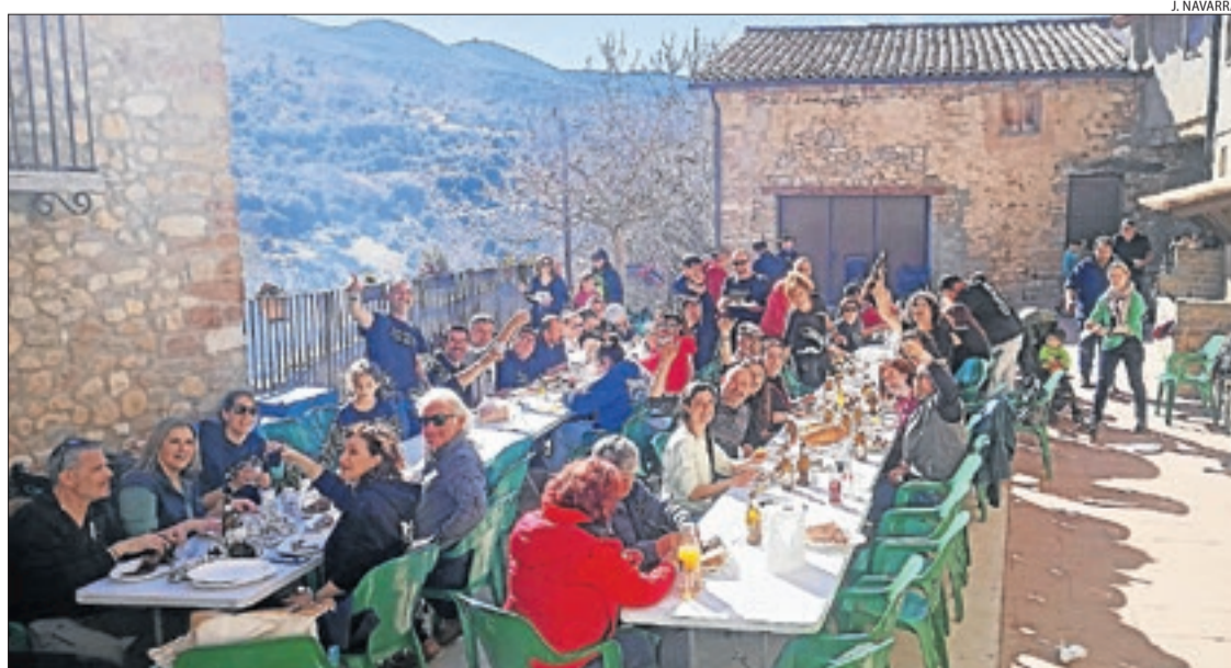
Prop d'un centenar de pagesos ahir a la plaça de Sant Esteve de la Sarga.

■ La firma agroalimentària de Vall Companys està present a Almenar després d'adquirir fa dos anys les instal·lacions de l'antiga fàbrica Copalme per reforçar la unitat de producció d'aliments per a animals, tenint en compte l'important nombre de granges integrades que la companyia té en aquesta àrea d'influència. Copalme va suspendre pagaments a començaments del 2008 i va deixar un passiu de més de 30 milions d'euros i els comptes d'un miler de persones van quedar "congelats".