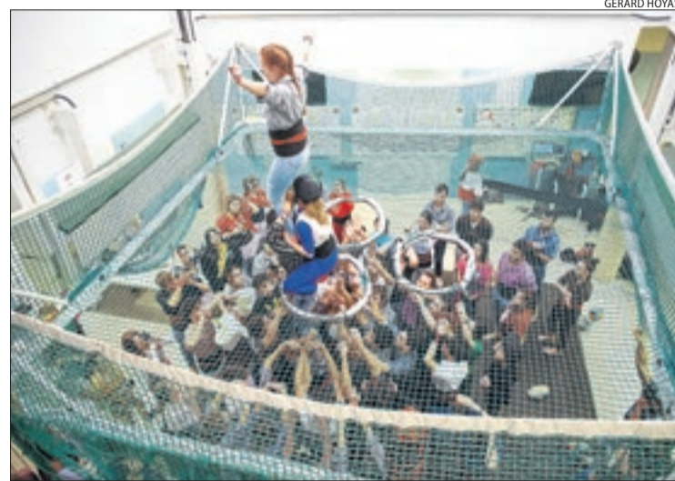
Els Marracos assagen al local dels Castellers de Lleida.