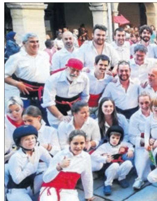
Foto de grup d'Els Malfargats del Pallars,

■ Originària de Moldàvia, porta 3 anys a Guissona. Una amiga la va convidar a un assaig i es va quedar. "Això és com una família sempre unida, et dona suport en tot."