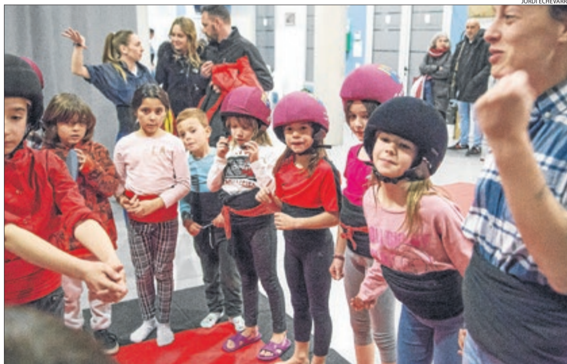
Els més petits dels Castellers de Lleida, amb casc de seguretat, gaudeixen també als assajos.