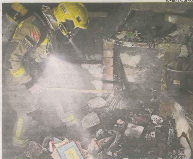
A Alfarràs, de matinada, es va cremar un rebost.

ALFARRÀS | Els Bombers van sufoquen nou incendis entre dissabte a la nit i ahir a Ponent. A la ciutat de Lleida, hi va haver un foc elèctric en un pis de Ronda, es va cremar una moto a Enginyers Cellers i un contenidor a la Bordeta. A Alfarràs, es va cremar el rebost d'una casa. Un paller es va incendiar a Alguaire i l'exterior d'una granja a Sarroca. Hi va haver focs de vegetació a Castellnou de Seana, Torrefeta i Juneda.