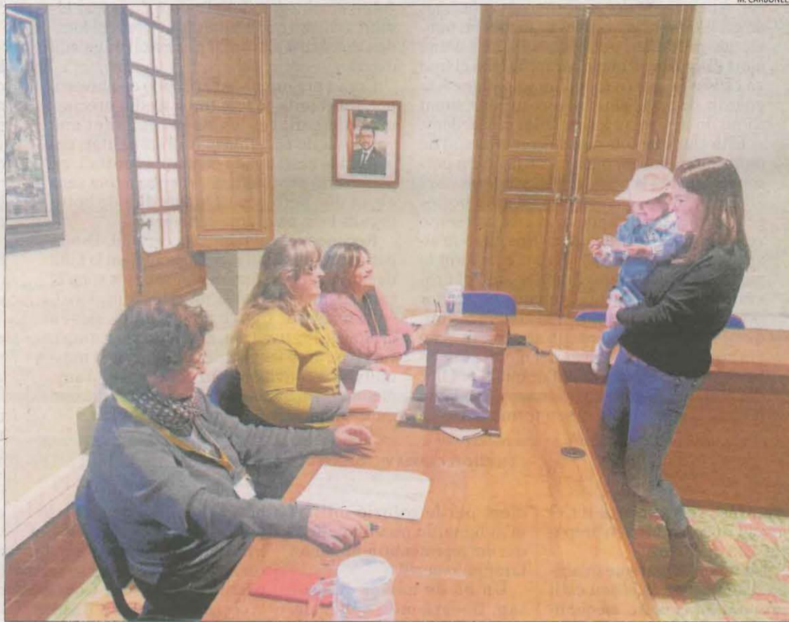
Una veïna votant a la consulta popular, ahir a l'ajuntament de la Pobla de Segur.

El reglament de participació ciutadana el regulava, però la pandèmia va obligar a interrompre tot el procés. Un altre factor que va fer esperar l'ajuntament era el consorci urbanístic que van crear amb Adif el 1992, quan Borrell encara era ministre. "Per no tenir intro-