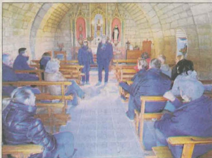
Presentació de la consulta abans de l'inici de la votació.

Servirà com a punt de trobada veïnal i per celebrar festes locals i aconseguir més arrelament veïnal. Guarda-si-venes està a tres quilòmetres de Guissona.