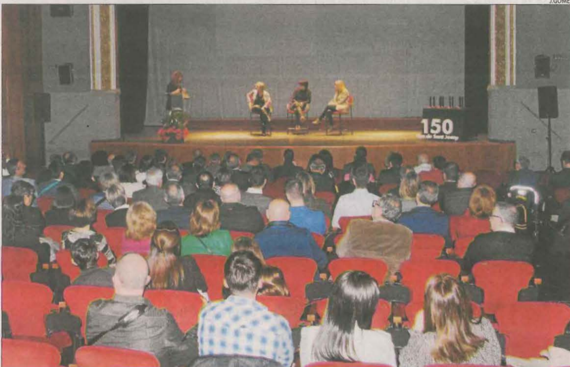
La presentació del llibre '150 anys de Sant Josep. Les veus d'una fira'.