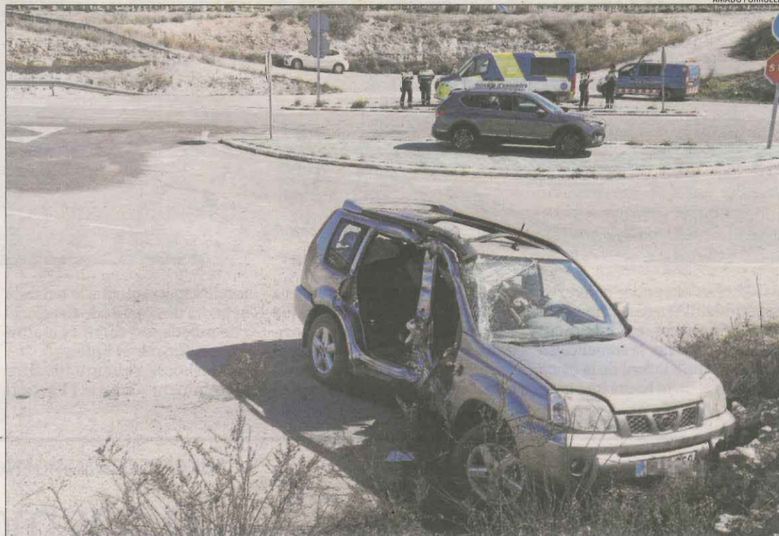
L'accident va tenir lloc en aquesta intersecció de la C-233 a Castellldans.

Amb aquesta víctima ja són quatre les persones que han perdut la vida en un accident de trànsit a les carreteres lleidatanes en tot just tres dies. Divendres a la matinada van perdre la vida els tres ocupants d'un totterreny, un veí de Castellserà de 28 anys i dos veïns de Legazpi (Guipúscoa) de 42 i 45