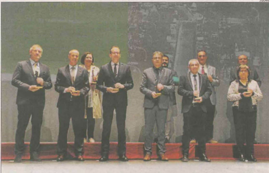
Els homenatjats durant l'acte institucional celebrat a L'Amistat.