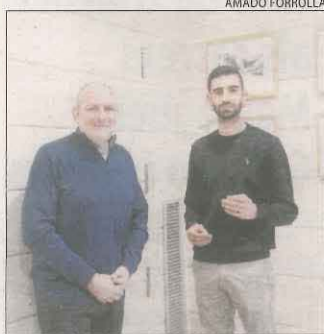
L'entrega de claus.

La Paeria comunica als cinc que hi són a precari que no podran continuar