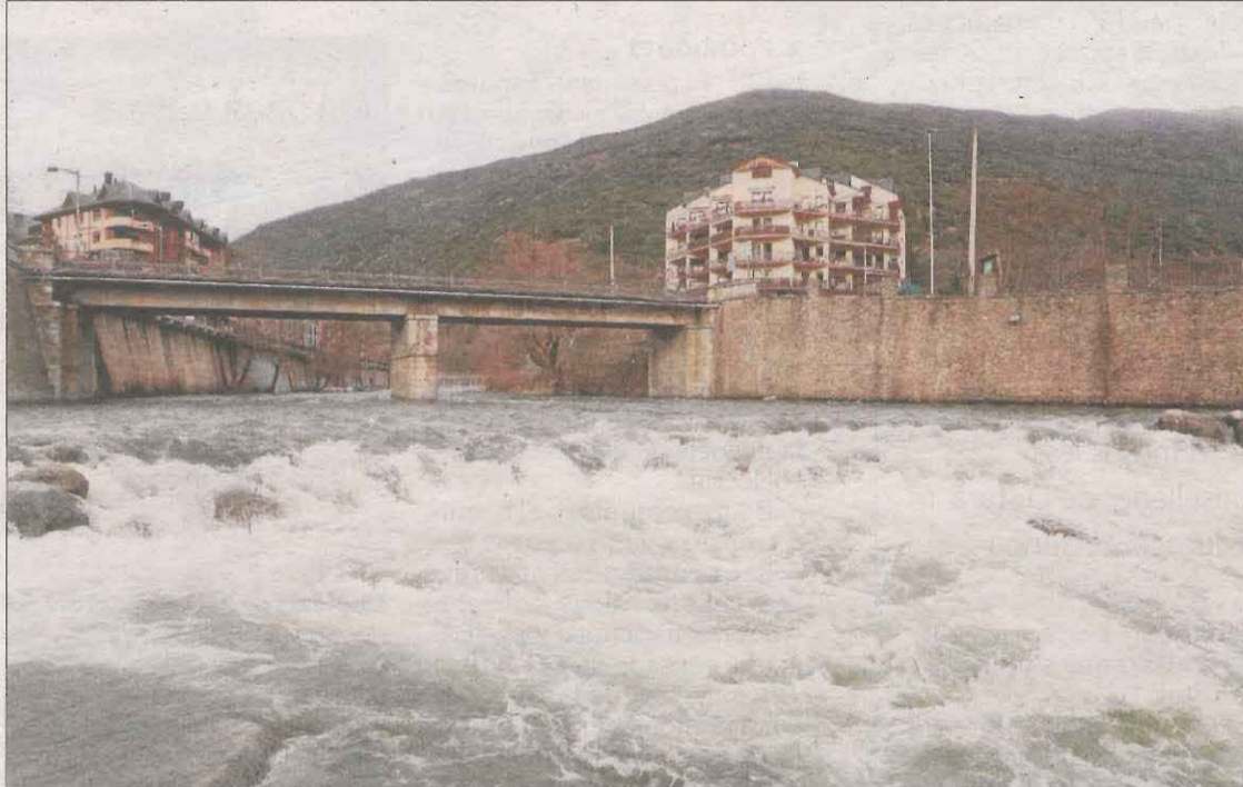
La Noguera Pallaresa, on comença aquest cap de setmana la temporada de ràfting, a l'altura de Sort.

LLEIDA | La calor dels darrers dies ha fos una quarta part de les reserves de neu al Pirineu. Segons dades de la Confederació Hidrogràfica de l'Ebre, les capçaleres de la Valira, el Segre, la Noguera Pallaresa i la Ribagorçana sumaven dilluns 271,2 hectòmetres cúbics d'aigua en forma de neu en capçalera, davant dels 356,4 hectòmetres de la setmana anterior, la qual cosa suposa una caiguda del 24%. Bona part de la neu fosa va als rius i s'acumula als pantans, que ja registren un lleu repunt de reserves. Tanmateix, si el desglaç és ràpid a causa de la calor, una part d'evapora i es perd. Pel que fa als rius, el Segre a la Seu ahir tenia un cabal de 17,3 i 16,6 metres cúbics per segon, de manera que Oliana i Rialb van recuperar 1,6 hectòmetres cúbics en un dia (86,4 hm). A la Pallaresa, on aquest cap de setmana comencen les primeres baixades del ràfting, al migdia el cabal oscil·lava entre els 17,5 metres cúbics d'Escaló i els 37,3 registrats a Collegats. La calor va oferir ahir una treva amb l'entrada d'un front fred després de quatre dies de màximes vorejant els 29 graus. A Catalunya feia 22 anys que un mes de març no era tan càlid. Gimènells, Sant Martí i Raimat van registrar rècords de temperatures d'un mes de març en vint anys.