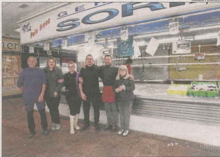
La majoria dels pocs paradistes del mercat de Fleming, ahir.

Van afegir que no poden tornar a licitar la concessió de les parades si el mercat no s'adapta a la normativa vigent i que es mantenia a precari aquests paradistes perquè la rehabilitació de l'edifici a través d'una concessió encara era possible fins que es va rebutjar en el ple. Arran d'això, van afirmar que