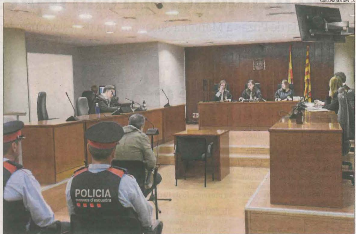
El judici es va celebrar el 25 de gener passat a l'Audiència de Lleida.

En el judici, la víctima va afirmar que «vivía en una pel·lícula de terror i sentia pànic. Només em deia "et mataré"». Dos agents dels Mossos d'Esquadra van explicar que l'home els va confessar que havia intentat matar la seua exparella i que ho tornaria a fer. La patrulla va acudir al domicili de la dona, que havia trucat perquè el seu ex estava intentant accedir al pis