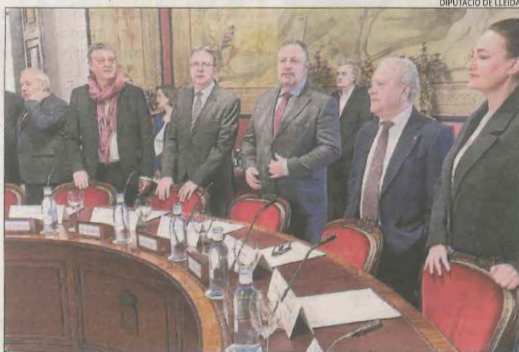
Reunió de diputacions i ajuntaments ahir al Senat.

L'11 per cent restant de l'accionariat és en mans d'un total de setanta administracions au-