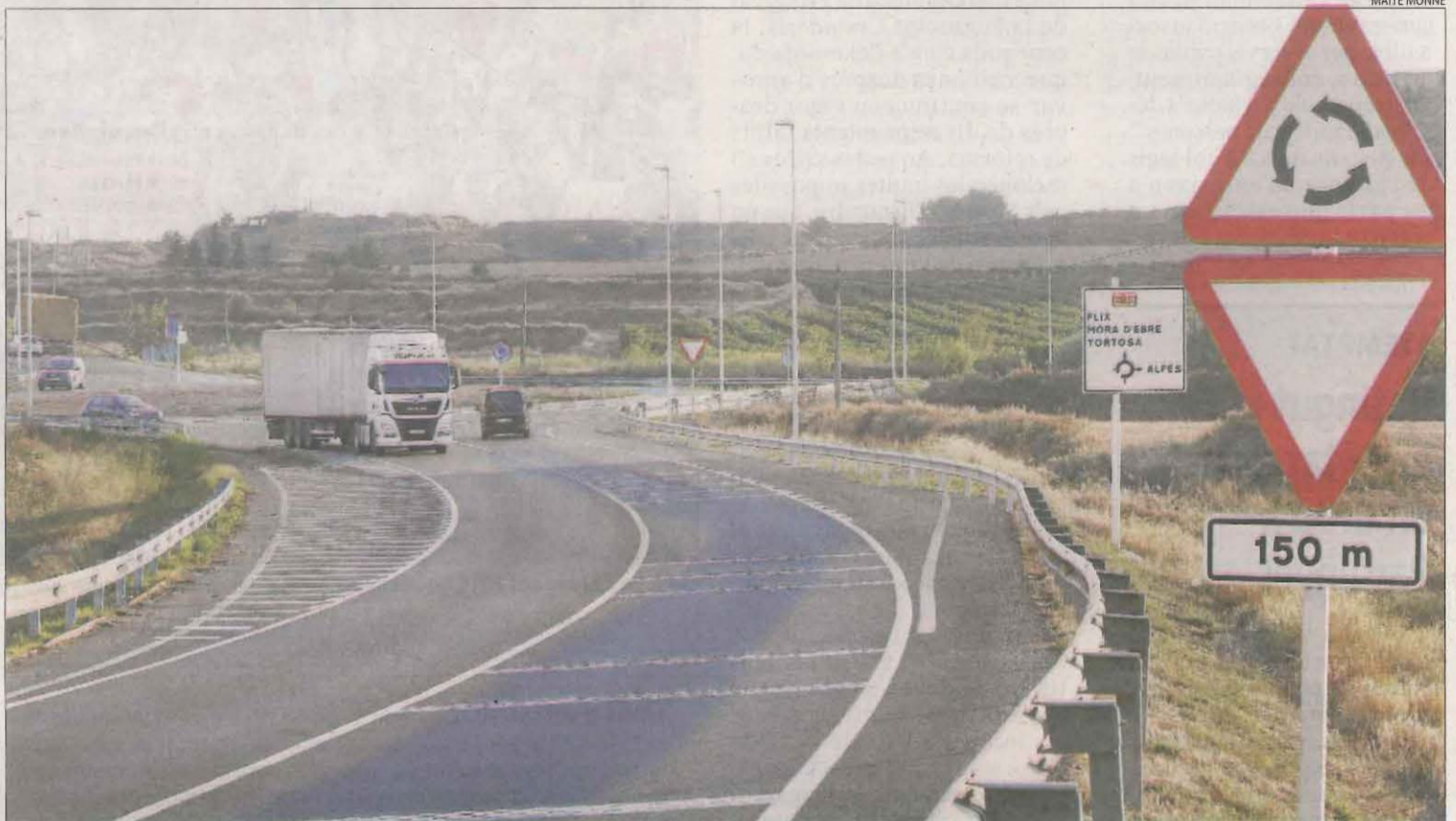
La carretera C-12 al seu pas per Alfés, un dels trams on s'impulsarà el carril central per avançar.

A Lleida, la Generalitat implantarà el tercer carril en 88,9 quilòmetres de l'Eix de l'Ebre (C-12) entre Lleida i Amposta, ja a Tarragona. També està previst en 11,8 quilòmetres de la C-14 entre Ponts i Oliana, en 22,1 quilòmetres de la C-26 entre Balaguer i Artesa de Segre, en 18,6 quilòmetres de l'L-310 entre Tàrraga i Guissona, i en 12,2 quilòmetres de l'L-311 entre aquesta última localitat i Cervera. Territori va assenyalar que el projecte del tercer carril de la C-12 és el més avançat a Lleida i preveu presentar-lo aviat. La Generalitat preveu implantar carreteres 2+1 en vies de la xarxa bàsica i amb un trànsit a partir de 5.000 vehicles diaris. També estudia aquesta opció per a la futura variant de la C-13 a Tèrmens i el port de Comiols. Per la seua part, el ministeri de Transport va avançar fa un any que també implementaria aquest tercer carril per avançar en el tram de 39 km de l'N-230 entre Benavarri i Sopeira.