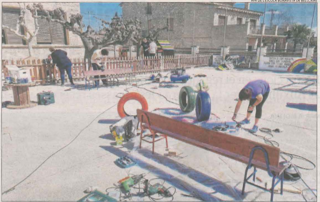
Famílies d'alumnes treballant el cap de setmana a l'escola Bonavista de Bellcaire.