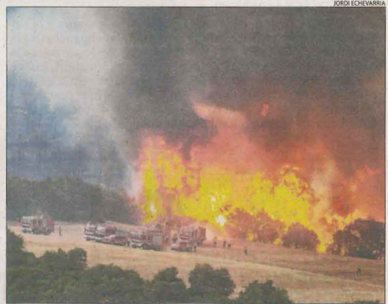
L'estiu passat van cremar 2.702 hectàrees al foc de Baldomar.

L'incendi de Baldomar, originat per un llamp, va destruir 2.702 hectàrees l'any passat