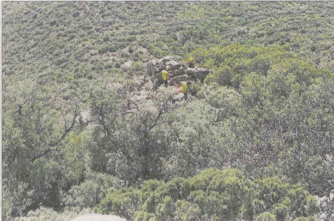
Imatge d'arxiu de l'accident mortal de parapent que hi va haver el setembre passat a Ager.

En aquest sentit, es va activar una patrulla d'Investigació dels Mossos d'Esquadra, que va coordinar les tasques judicials per a l'aixecament del cadàver. També hi van participar efectius de la Unitat d'Intervenció en Muntanya dels Mossos d'Esquadra, en helicòpter, per realitzar l'extracció de la víctima. Paral·lelament, es va obrir una investigació per identificar el paracaigudista, que anava sol i no duia documentació, i determinar les causes de l'accident. Al cap d'unes hores van confir-