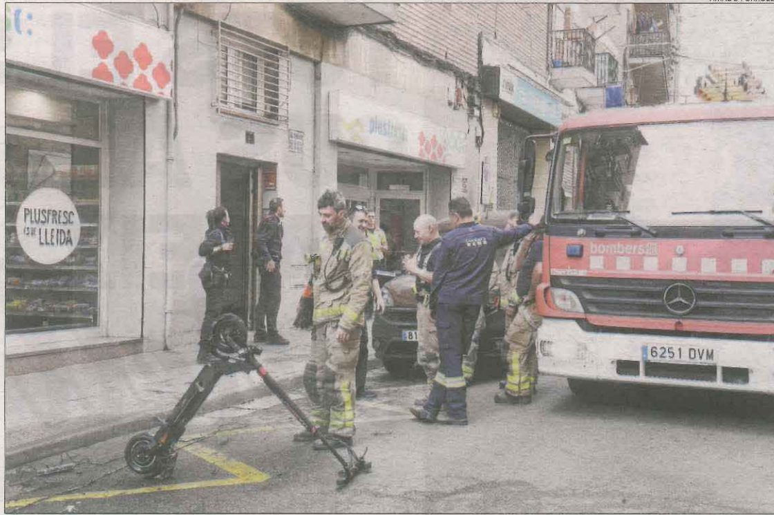
Estat en què va quedar el patinet després d'explotar la bateria.