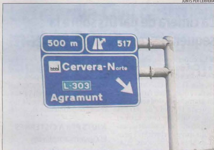
El senyal en castellà que indica l'accés a Cervera.