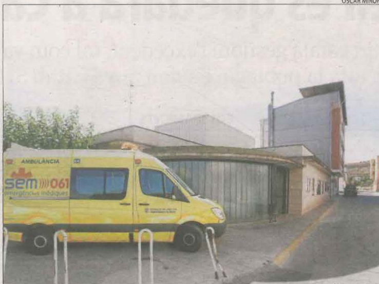
Imatge d'arxiu del CAP de Seròs.

LLEIDA | La falta de metges rurals ha posat en alerta sis municipis del Segrià. Seròs, Masalcoreig, Almatret, Maials, la Granja d'Escarp i Aitona exigeixen al departament de Salut una prestació òptima del servei d'Atenció Primària. El CAP de Seròs, al qual pertanyen aquests pobles, ha comunicat als ajuntaments que per "l'increment progressiu d'incidències diàries" que afecten la plantilla dels professionals de l'Àrea Bàsica de Salut Seròs, que dona cobertura a 7.136 habitants, a les jubilacions i la falta de relleu, en aquests moments només el 60% de la plantilla de metges exerceix en el seu lloc de treball. Assenyalen que aquesta circumstància implica "redefinir els horaris de presencialitat als consultoris locals". Malgrat tot, asseguren que estaran oberts amb el mateix horari amb el servei d'infermeria i que s'atendran totes les consultes mèdiques via telefònica. Mentrestant, estarà assegurada la presència d'un metge al CAP de Seròs, en horari de matí. L'atenció contínua (tarda i caps de setmana) s'assegura amb la presència d'infermers. Les queixes del Segrià se sumen a les dels municipis de la Ribera del Sió per la falta d'atenció mèdica (vegeu el desglossament).