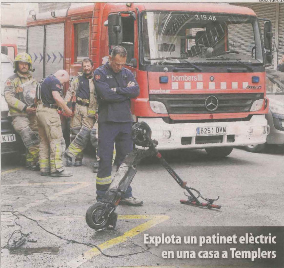
Explota un patinet elèctric en una casa a Templers