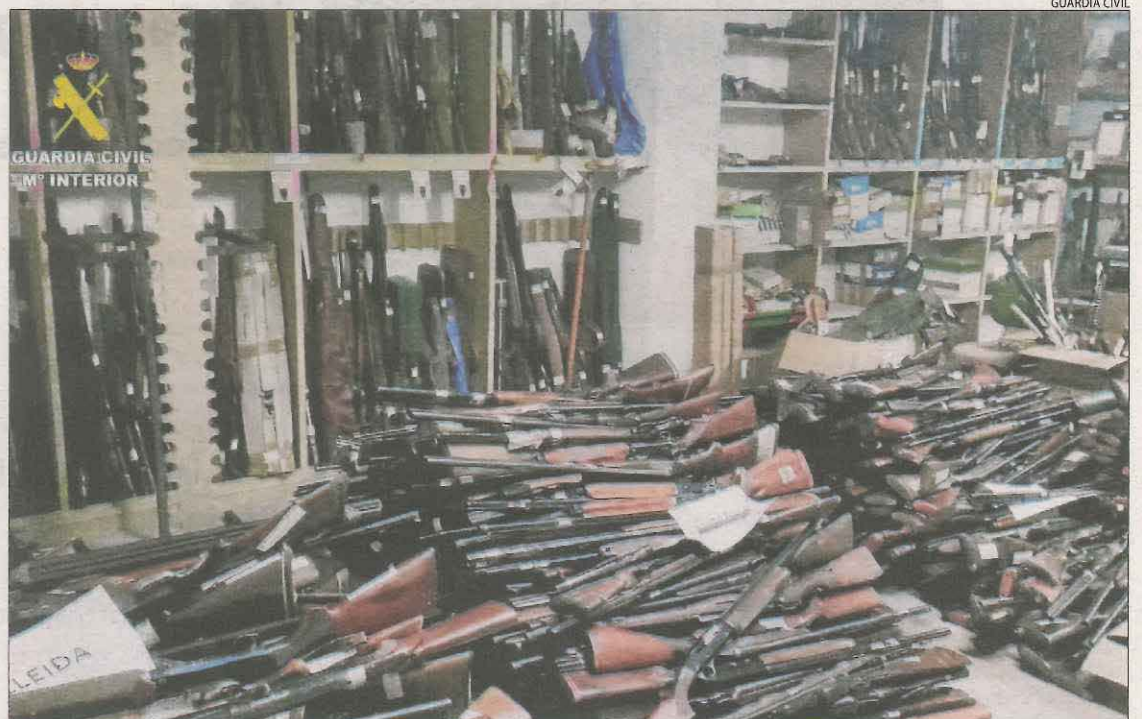
Vista de les armes destruïdes aquesta setmana per la Guàrdia Civil de Lleida.

A les comarques lleidatanes hi ha un total de 19.185 autoritzacions de diferent tipus per poder tenir armes de foc (per a caça major, caça menor, tipus esportiu o seguretat privada, entre