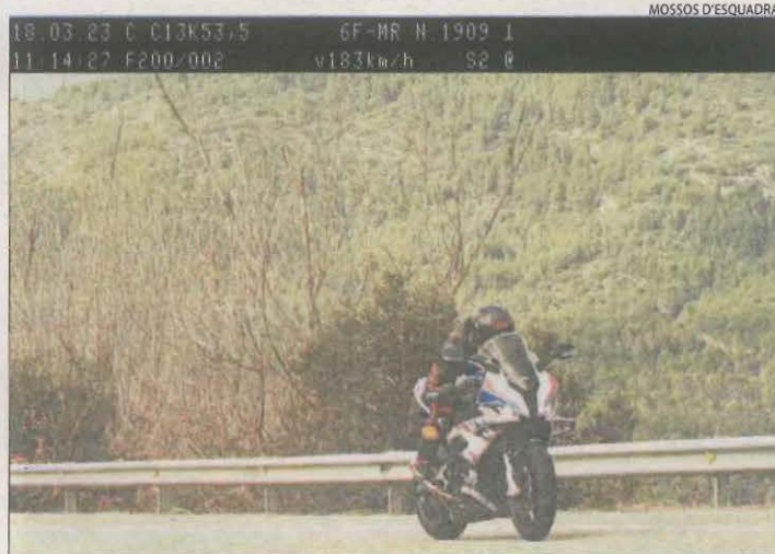
Imatge que va captar el radar del motorista.