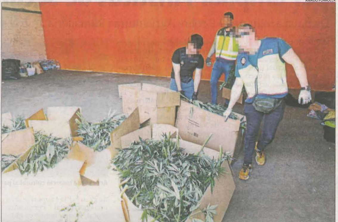
Imatge de part de la marihuana decomissada ahir per la Policia Nacional.

Els investigadors portaven diversos mesos darrere de la xarxa. Finalment, ahir al matí van practicar un escorcoll en dos naus del polígon Panamà de Torres de Segre -a la sortida d'Alcarràs- que estaven habilitades com a plantacions indoor i en van detenir quatre jardiniers -persones que viuen a les plantacions i són els encarregats de la cura i vigilància-. També es van practicar tres arrestos a Vinaròs. La majoria dels investigats són de nacionalitat albanesa. En una de les naus hi havia habilitades dos sales amb dos plantacions, una de les quals a punt de collir, i estaven adequant el segon magatzem. A més de les 2.000 plantes de marihuana, també van decomissar aparells com ventiladors i eines destinades al cultiu. La instal·-