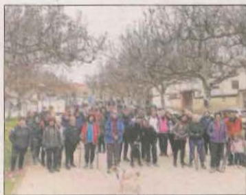
L'itinerari arrancarà diumenge des del passeig.

El preu del tiquet és de 10 euros i inclou guia cultural, sessió de pals de marxa, avituallament