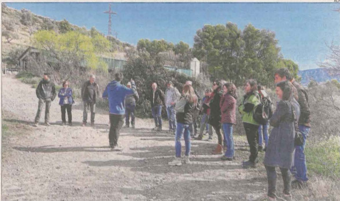
Salàs de Pallars va acollir la primera activitat del 'Converses al tros'.

SALÀS DE PALLARS | Sensibilitzar els pagesos per conèixer nous cultius i formes de treballar la terra és l'objectiu del projecte Converses al tros . Impulsada per Pallars Actiu, la iniciativa es desenvoluparà a la comarca del Pallars Jussà, on actualment hi ha tres parcel·les de cultius experimentals per conèixer el comportament i implantar nous cultius per trobar solucions a la baixada del rendiment agrícola que produirà el canvi climàtic. D'aquesta manera, els assistents participaran en un total de quatre visites a aquestes finques experimentals de farratges, cereals i llegums ubicats a Sant Esteve de la Sarga, Talarn i Salàs de Pallars. Precisament, aquest últim municipi va acollir recentment la primera de les Converses al tros per poder conèixer els cultius d'ordi, faves, lleties i espelta ecològica. Per una altra banda, com a activitat prèvia, es va dur a terme una sessió sobre com fertilitzar i generar compostatge de la granja. Amb aquest conjunt de visites es vol intervenir sobre el sector