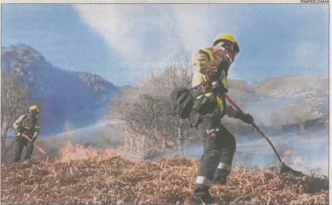
El foc es va revifar dimarts a la tarda pel flanc dret.

El foc es va iniciar per causes desconegudes dijous a la nit en