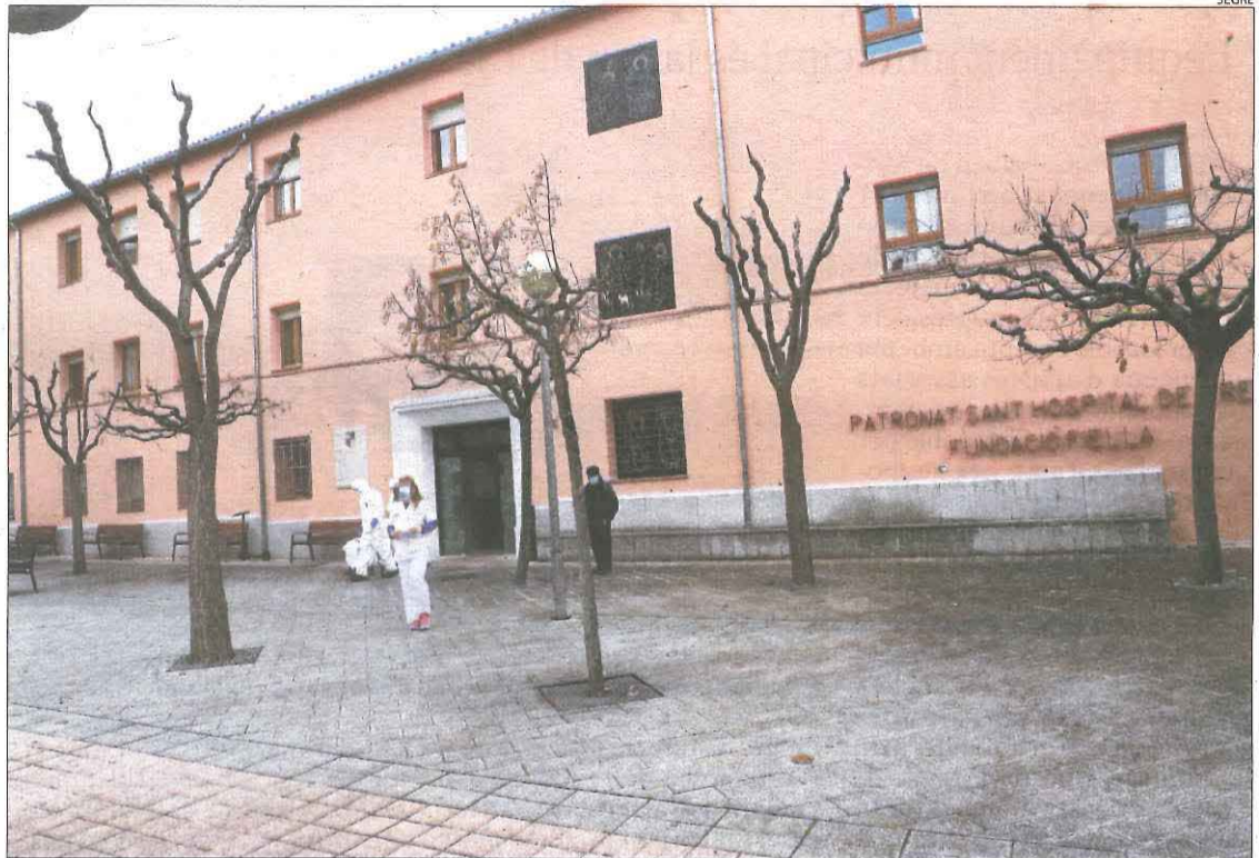
Imatge de la residència el desembre del 2020 després del brot.

Posteriorment, va ser el torn dels treballadors. Una gran ma-