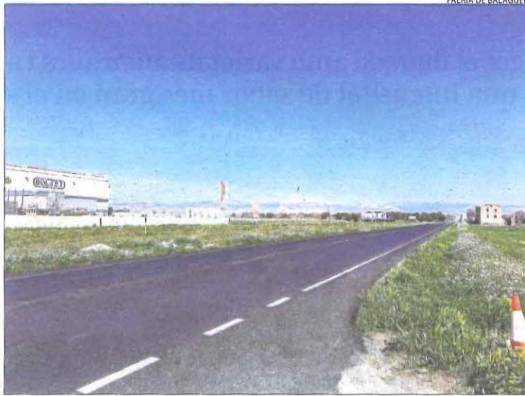
El punt on està previst el nou accés al polígon.