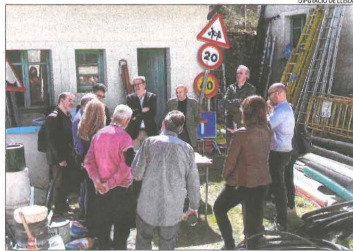
Les autoritats a l'antiga caserna de la Torre de Capdella.