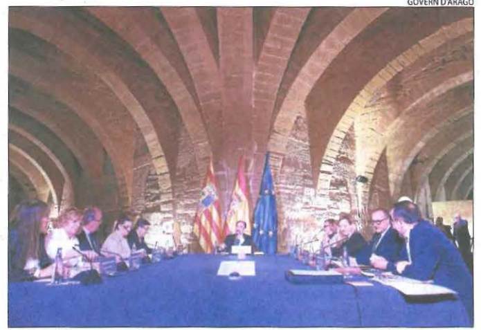
Consell de govern aragonès, a la sala capitular de Sixena.