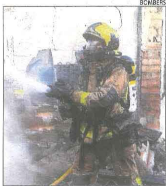
L'incendi a Balaguer.