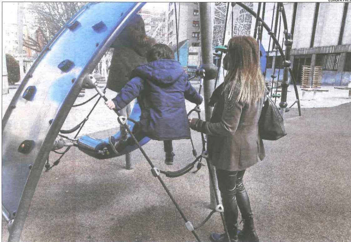
La nova llei dona protecció a les famílies més vulnerables, com les monomarentals.

La llei crea un registre de parelles de fet que podran accedir a permisos com els 15 dies que es dona per matrimoni i reconeix el dret a l'atenció primerenca. També amplia la renda criança de 100 euros al mes per fill menor de 3 anys que només cobraven les mares treballadores a aquelles que estan a l'atur o que hagin cotitzat almenys un mes, una mesura que ja està en marxa des del mes de gener. Entre els permisos retribuïts