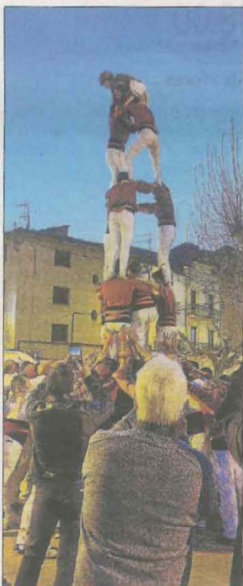
Els lleidatans fent un 3d6a.