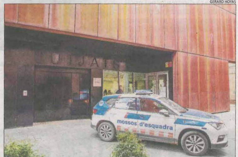
Moment en què el detingut era traslladat als jutjats.

L'informàtic va ser detingut dimecres al matí a Vilanova de la Barça, després que els Mossos d'Esquadra van obrir d'ofici una investigació al tenir coneixement que es podrien haver descobert unes fotografies íntimes de joves a l'ordinador d'una persona i que aquestes podrien haver estat utilitzades per a algun tipus de delictes, com l'extorsió, com va avançar SE-