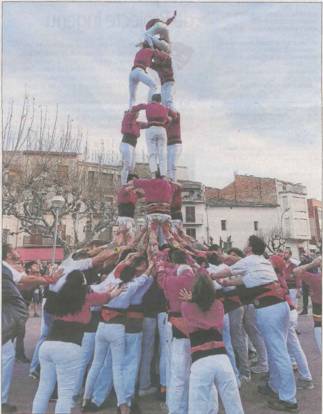
Castell 3 de 6.

Assagem els dimecres de 20 hores a 22 h del vespre i els divendres de 21 h a 23 h de la nit al carrer Lluís Besa, 7. Tothom és benvingut al local dels Castellers de Lleida per fer pinya amb nosaltres i ajudar-nos a fer créixer la colla.