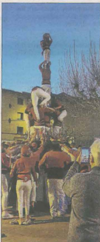
Provant un 3d6a.