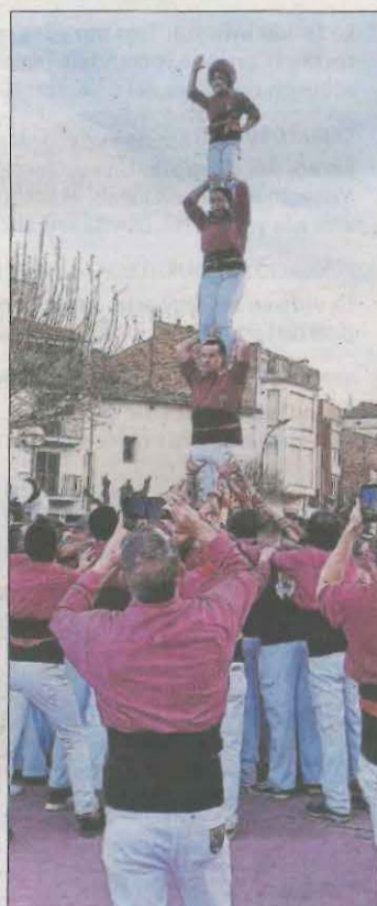
Pilar de 4.