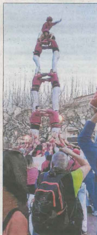
Culminant un 2d6.