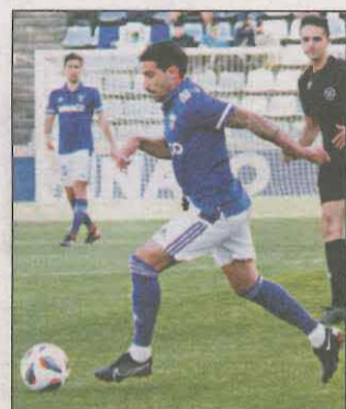
Pese a la derrota evita la zona de descenso