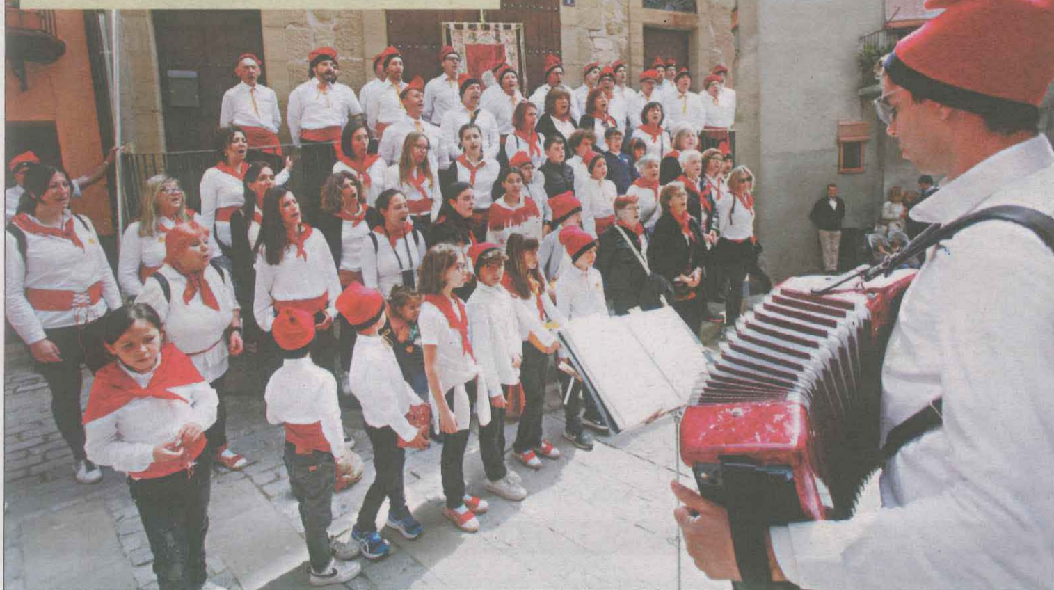
Les 'caramelles' salieron un año más a la calle en varias poblaciones (en la imagen, las de Artesa de Segre) LOCAL | PÁG.9