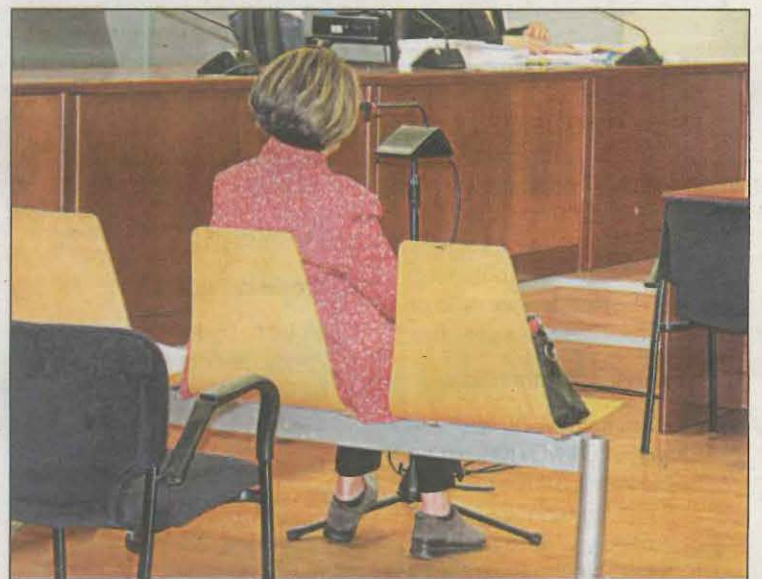
L'acusada de quedar-se amb 220.000 euros de la seva tieta

L'acusada va reiterar que l'encarregat de repartir l'herència era el marmessor, però aquest va morir quan encara no s'havia fet el repartiment dels diners que sobraven, que suposaven més de la meitat de l'herència de la dona, suposant 220.000 euros dels més de 400.000 euros. Ara, 12 dels 26 legataris, que van rebre uns