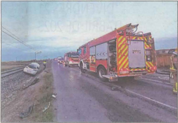
El vehicle afectat vora de la via del tren a Golmés