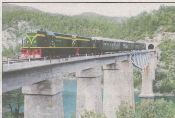
El Tren Històric dels Llacs circularà 22 cops

El viatge transcorre per la dreta del riu Segre, des de Lleida fins a Balaguer. Després, continua el seu recorregut seguint el riu Noguera Pallaresa fins a arribar a la Pobla de Segur, amb 17 estacions al llarg del recorregut. El Tren dels Llacs passa per un total de 40 túnels i 75 ponts durant 89 quilò-