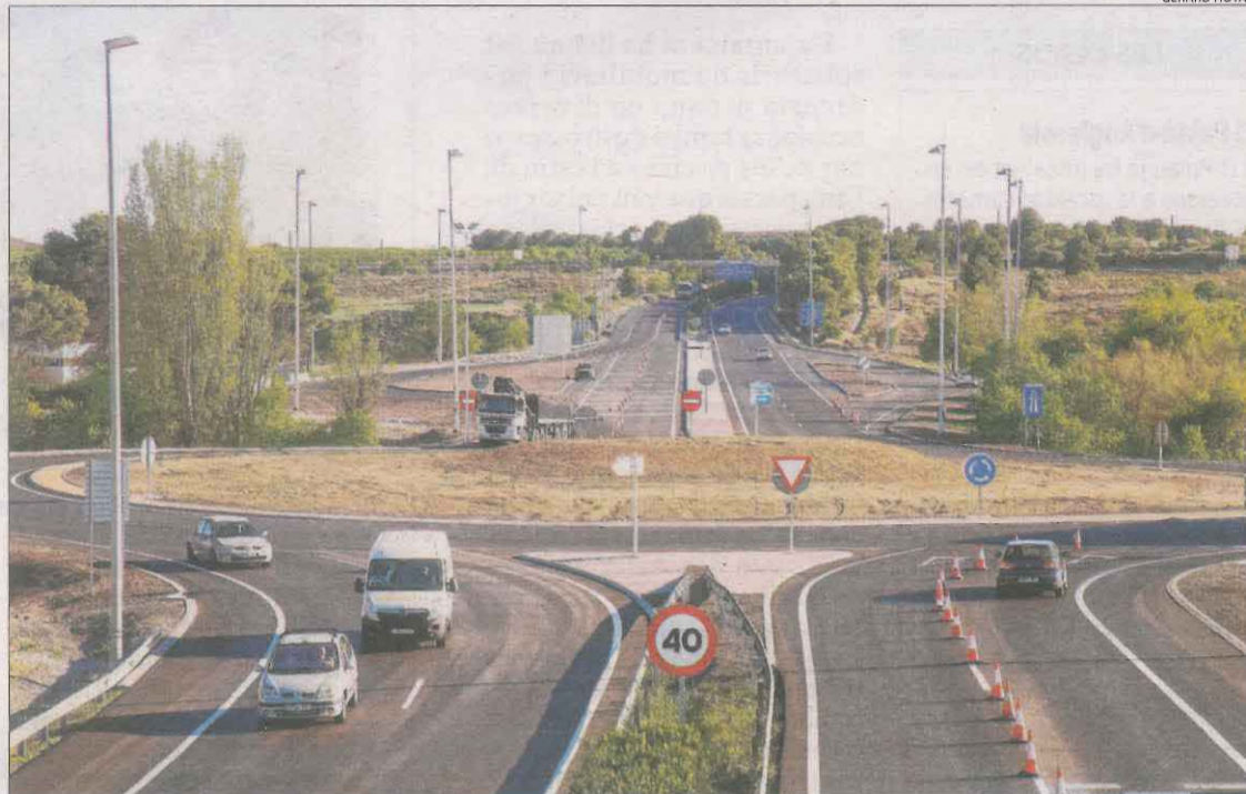
La rotonda de l'autopista AP-2 on s'estan ultimant els treballs a la calçada.

La Generalitat inaugura el nou pas elevat de polígon Campllong de Balaguer