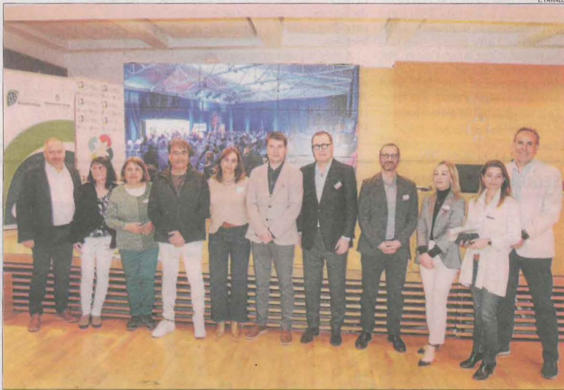
Presentació del decàleg de les Jornades ahir a la Diputació.

Els impulsors del decàleg demanen que les propostes s'apliquin immediatament per les institucions del Pirineu. Reclamen augmentar els professionals d'atenció primària per disminuir temps d'espera i augmentar la freqüència de visites. També proposen implementar als instituts un programa denominat What's Up? per combatre els estigmes relacionats amb la salut mental. Altres propostes del decàleg són millorar els serveis de transport modificant els criteris d'accés i donant més cobertura i elaborar protocols de primers auxilis per actuar en situacions d'emergència. També