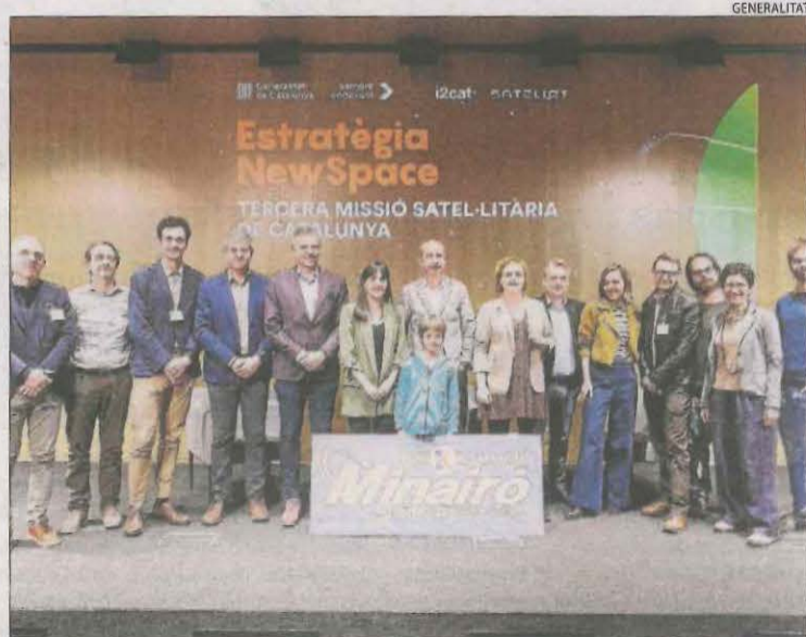
Presentació ahir de la missió Minairó de la Generalitat.

BARCELONA | La Generalitat posarà en òrbita el tercer nanosatèl·lit, batejat com Minairó, durant aquest mes d'abril. El llançament serà des de Califòrnia a bord d'un coet Falcon9 de la companyia nord-americana SpaceX. La missió pretén desplegar un "laboratori en òrbita" i servirà per millorar la connectivitat 5G. El nom de Minairó, elegit en col·laboració amb el programa informatiu infantil InfoK , fa referència al popular ésser fantàstic protagonista d'una llegenda tradicional del Pallars i el Pirineu. El quart satèl·lit es licitarà aquest 2023 i