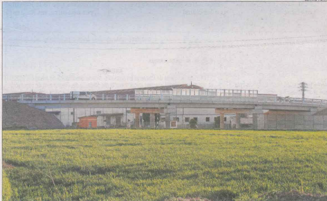
El nou pas elevat del polígon Campllong a la zona de l'antiga Safyc.