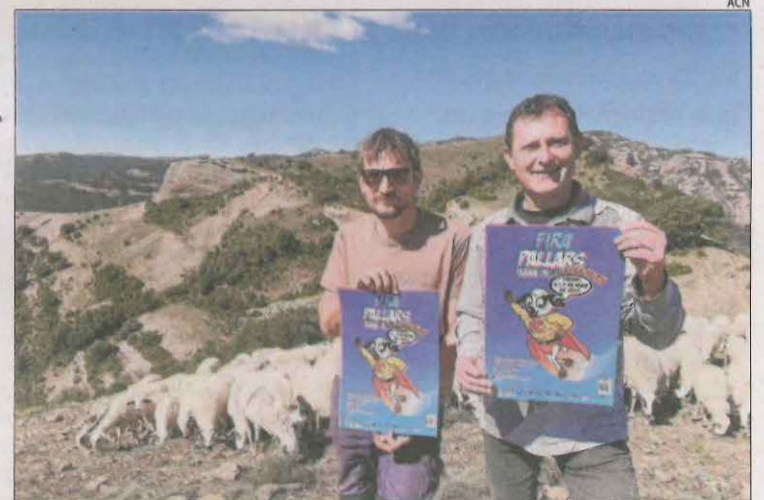
El cartell de Fira Pallars, que se celebra els dies 6 i 7 de maig.