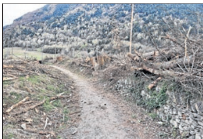
Imatge dels arbres talats a Esterri d'Àneu.