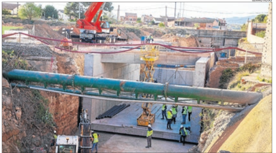
Els treballs per desplaçar el nou viaducte fins al lloc que ocupava l'antic.

Ferrocarrils de la Generalitat ha habilitat durant el cap de setmana, i mentre durin els treballs, un servei de bus alternatiu al tren de la línia de la Pobla