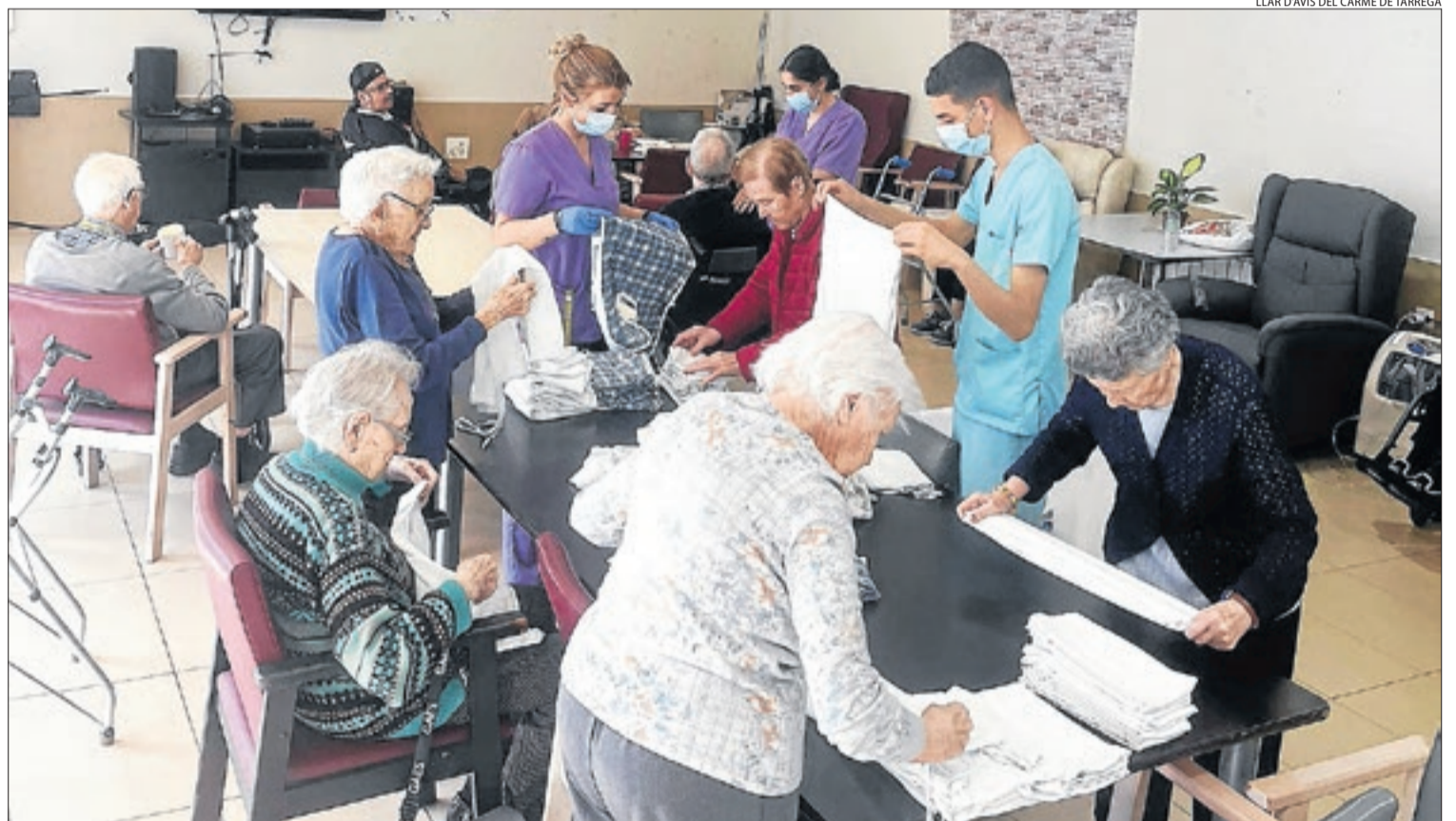
LLAR D'AVIS DEL CARME DE TÀRREGA

La Generalitat apunta que "hi ha evidències dels seus bons resultats, com la disminució de l'ingrés hospitalari, la