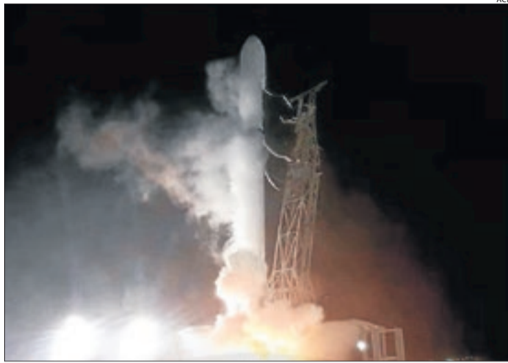
Enlairament del coet amb el Minairó, en una base de Califòrnia.

"Ja tenim el Falcon9 en l'aire (i el motor aterrat de nou a la Terra). La càpsula que transporta els nanosatèl·lits segueix el seu camí cap a dalt. Primera