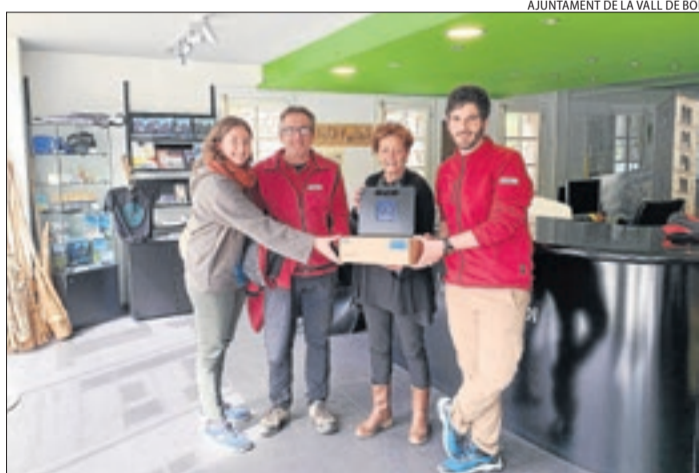
L'entrega dels bucles magnètics a la Vall de Boí.