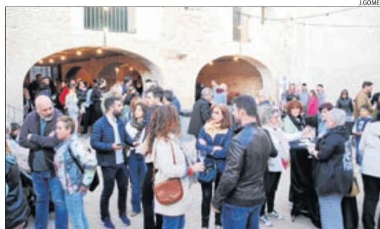
Participants de la Mostra, al pati de Cal Jaques.