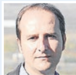
Alcalde de la Granja d'Escarp

«Temem que el foc es pugui propagar a una zona en la qual pugui tenir més potencial destructiu»