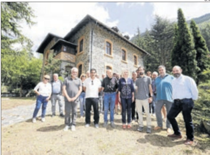
Imatge d'arxiu d'un acte el 2018 amb la Casa Matter al fons.

L'alcalde va apuntar ahir que la Generalitat no s'ha pronunciat sobre aquesta proposta, que formulen de forma conjunta l'ajuntament de la Torre de Capdella i l'entitat municipal descentralitzada (EMD) d'Espui. Tanmateix, es va mostrar esperançat a l'observar una bona disposició per part de l'administració catalana. El municipi ja va optar sense