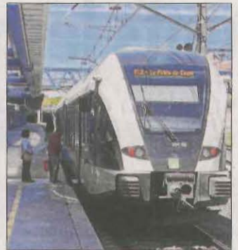
Passatgers del nou trajecte.

A més, el cap de setmana s'estrenaran tres circulacions entre Lleida i Balaguer. Els dissabtes i els diumenges hi haurà un nou tren entre el Segrià i la Noguera a les