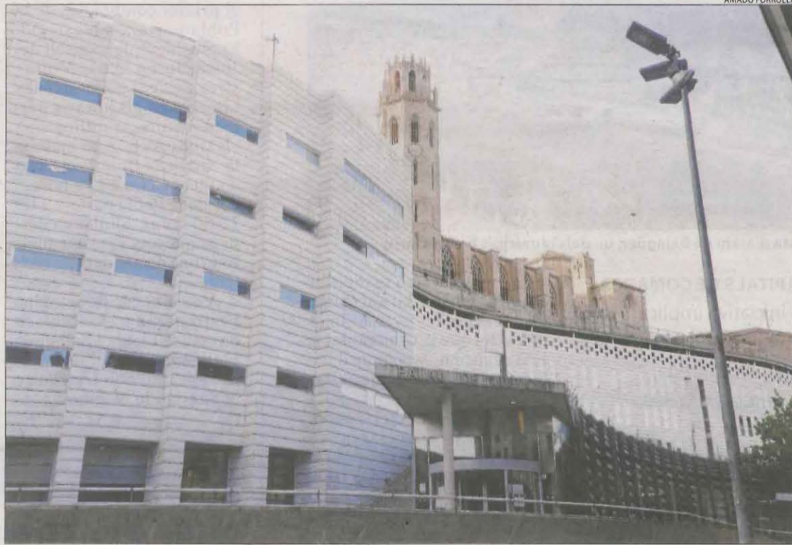
La junta electoral de Lleida i la provincial s'ubiquen a l'edifici dels jutjats.

Per la seua part, Pacte Local (marca electoral del PDeCAT, de què té els drets de cara als