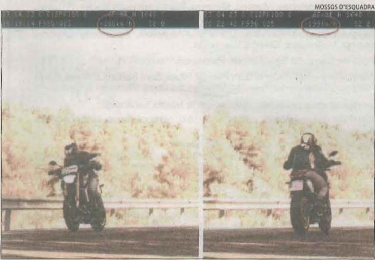
Va ser interceptat dos vegades en tot just tres minuts de diferència.