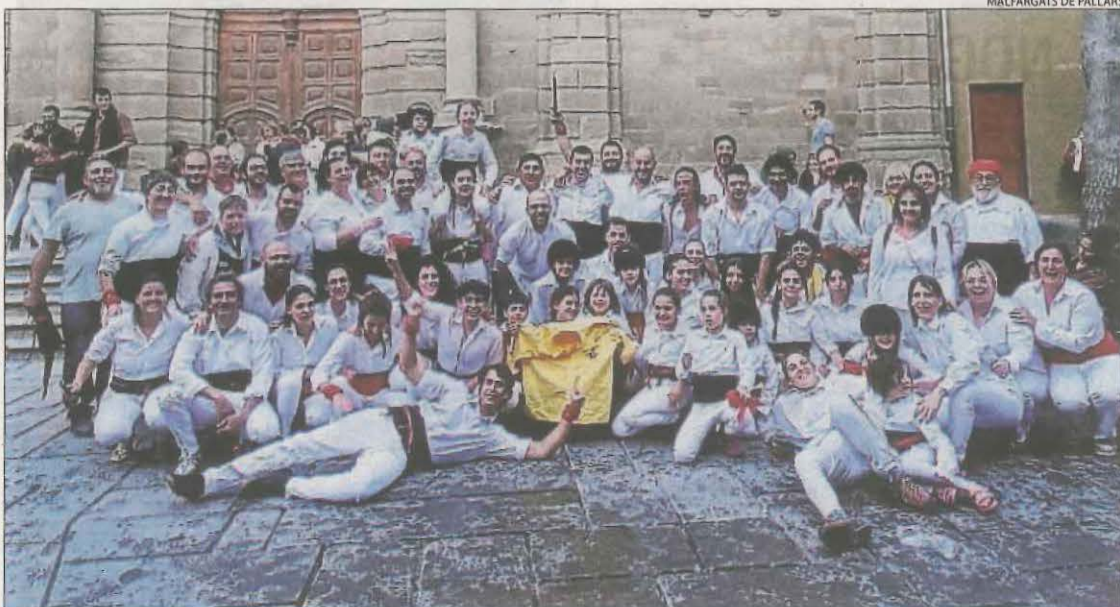
Els Malfargats de Pallars, després d'aconseguir la seua camisa groga dissabte passat a Guissona.