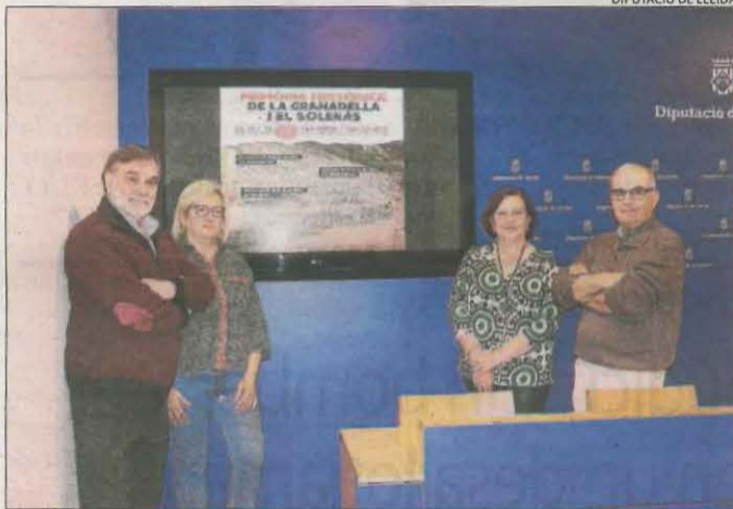
Presentació ahir dels actes a la Granadella i el Soleràs.