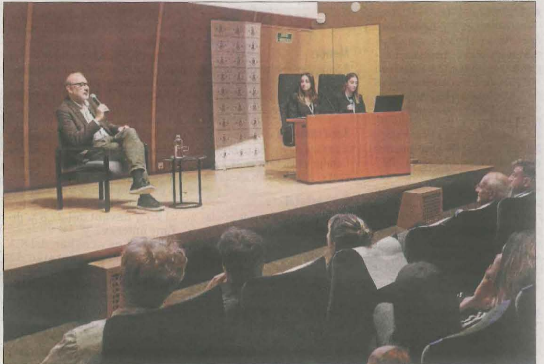
El periodista Antoni Bassas, ahir en la primera jornada de la Setmana de la Comunicació de la UdL.

Antoni Bassas obre la Setmana de la Comunicació de la UdL, que celebra vint anys || El cineasta Jaume Balagueró, avui