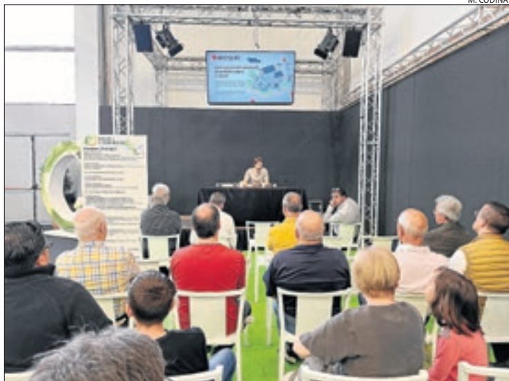
Una xarrada sobre transició energètica, ahir al Saló de l'Energia.