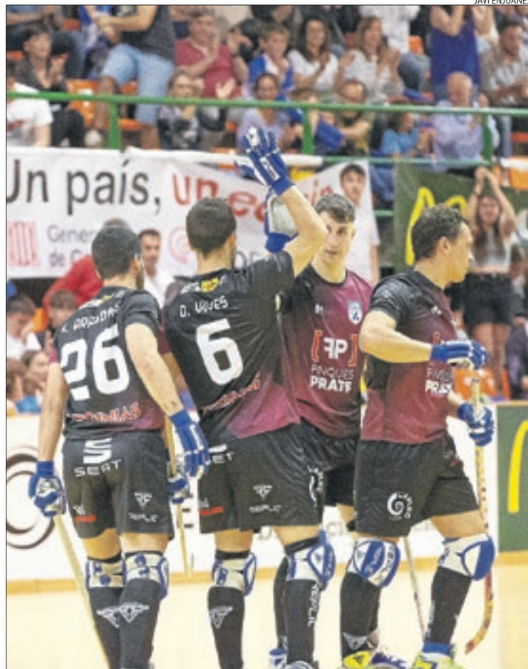
El equip llistat torna avui després de la Final Four europea.