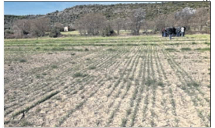
Al Pallars s'han sembrat varietats més resistents.

a granel que es pot instal·lar sobre la superfície de la bassa, formant una capa flotant. Resistent als productes químics compostos, és menys costós que solucions tradicionals com les cobertes de formigó armat i les plàstiques.