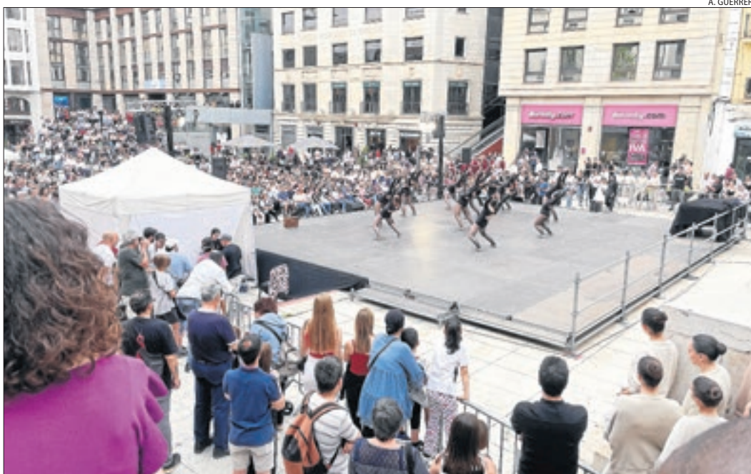
Acadèmies de ball de Lleida van exhibir els seus passos davant d'una plaça Sant Joan a vessar.

Per la seua part, Tàrrrega va commemorar divendres el Dia Internacional de la Dansa oferint una demostració d'aquesta disciplina artística a la plaça de les Nacions sense Estat. En el marc de la 12 Marató de Dansa, sis clubs, entitats i escoles de la ciutat van oferir més d'una trentena d'exhibicions. La convocatòria va congrega nombrosos assistents i un ampli ventall de gèneres i estils, des de la dansa clàssica fins al hip-hop. Així mateix, Balaguer es va sumar divendres a la celebració amb actuacions a l'avinguda dels Països Catalans, lloc en el qual es va llegir el manifest.