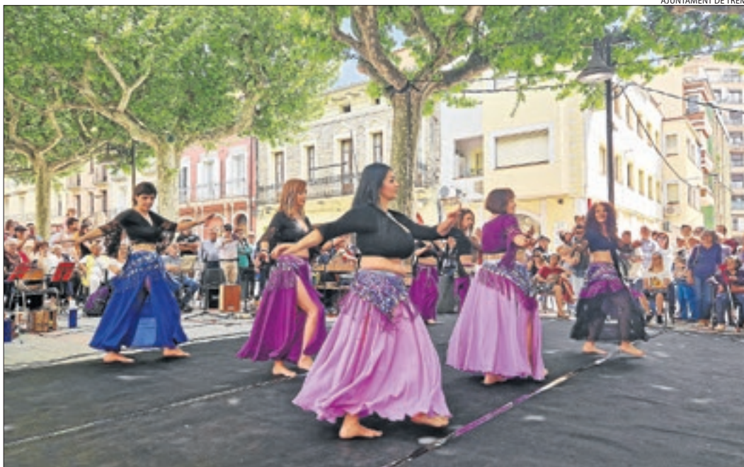
Trepmp va acollir ahir una mostra de danses amb diferents grups de la ciutat.