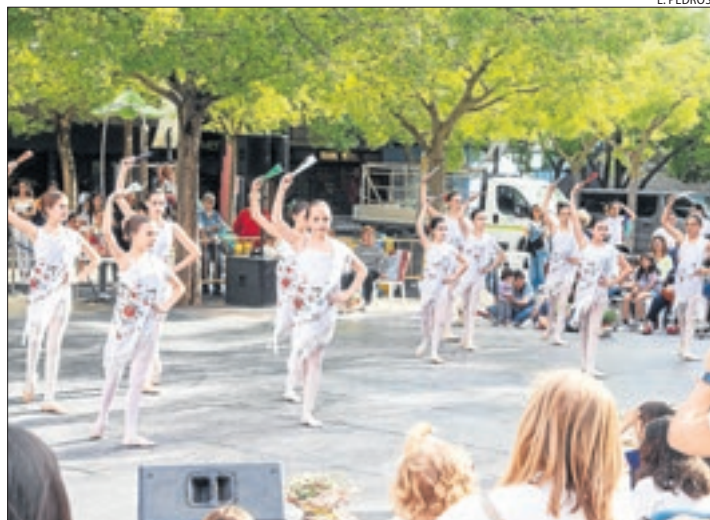
Tàrrrega, amb el Dia Internacional de la Dansa divendres.