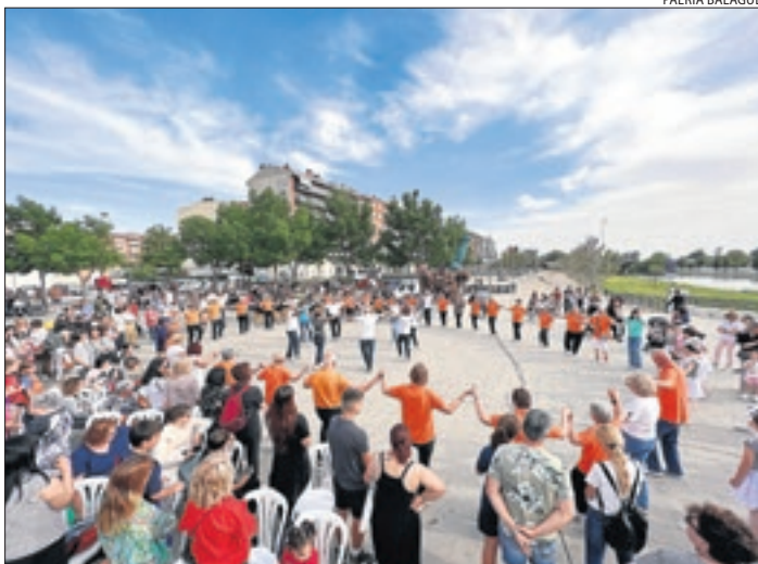
Balaguer va celebrar l'efemèride divendres amb diferents balls.