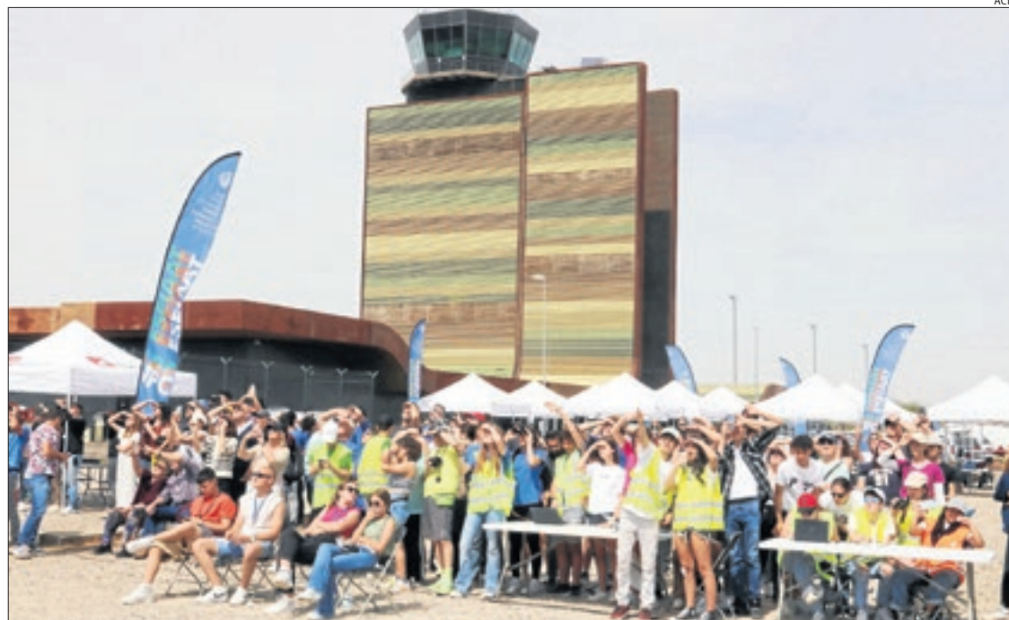
Alumnes de tot Catalunya, observant l'enlairament dels seus satèl·lits ahir a Alguaire.

"Estem molt contents de l'interès que desperta", va ex-