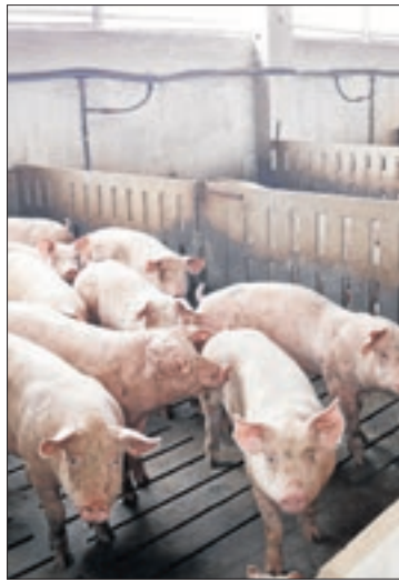
Noves mesures a les granges.

D'una banda, la norma comporta nous requisits i millores en matèria de gestió de purins a les granges, cosa que inclou que cada granja té l'obligació de comptar amb el seu propi Pla de Gestió Ambiental. D'altra banda, s'hi inclou com a objectiu la reducció de les emissions de gasos contaminants i d'efecte hivernacle,