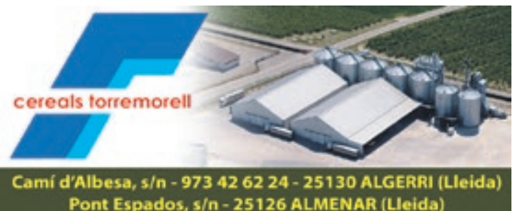
Camí d'Albesa, s/n - 973 42 62 24 - 25130 ALGERRI (Lleida) Pont Espados, s/n - 25126 ALMENAR (Lleida)

Soja i sorgo també es perfilen com opcions viables, ja que requereixen un 53 i 44% respectivament d'aigua menys que el panís. De fet, amb un cultiu com la soja es poden aconseguir rendiments acceptables amb la meitat d'aigua que el blat de moro de primera collita, apunta Extensius.cat.