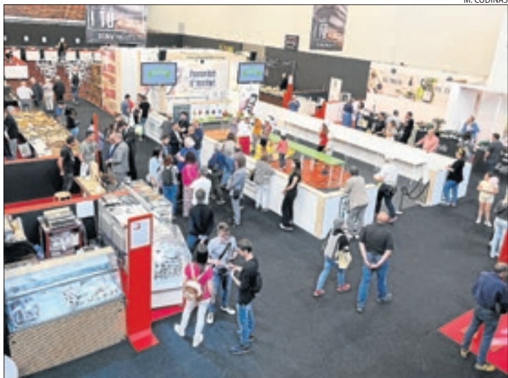
Un dels espais de la Fira Q al pavelló Inpacsa de Balaguer.

Amb el nou Saló de l'Energia, que promociona empreses de la demarcació d'aquest sector || Més de cent expositors i tallers, activitats i xarrades fins dilluns