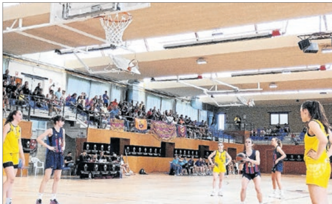
El pavelló de Bellpuig acull aquests dies la Final a Quatre del Català de cadet preferent.