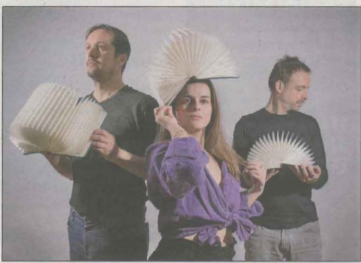
Meritxell Gené tiene una gira por delante

La cantautora leridana Meritxell Gené, que acaba de publicar su sexto álbum, 'No diré res de mí', se encuentra embarcada en una gira que este viernes le lleva al Centre Cultural Albareda de Barcelona, dentro del BarnaSants. Tras el verano, el 15 de octubre tiene previsto de hacer lo propio en el Espai Orfeo de Lleida.