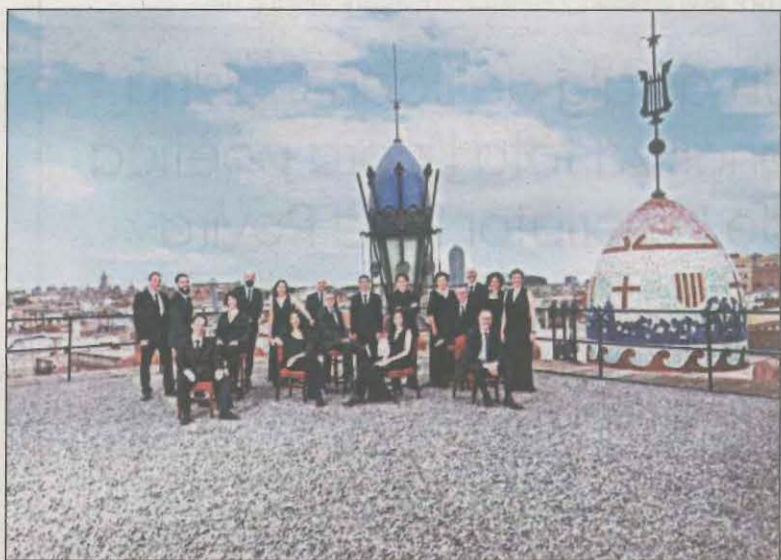
El Cor del Palau de la Música actuarà diumenge

visuals. El diumenge (19.00) actuarà el Cor de Cambra del Palau de la Música amb El cançonner popular contemporani . Fa 100 anys Rafael Patxot encarrega a l’Orfeó Català, entre altres, el projecte de l’Obra del Cançonner Popular de Catalunya, i amb la idea de connectar el passat i el present, la formació presenta algunes d’aquestes obres amb nous arranjaments.