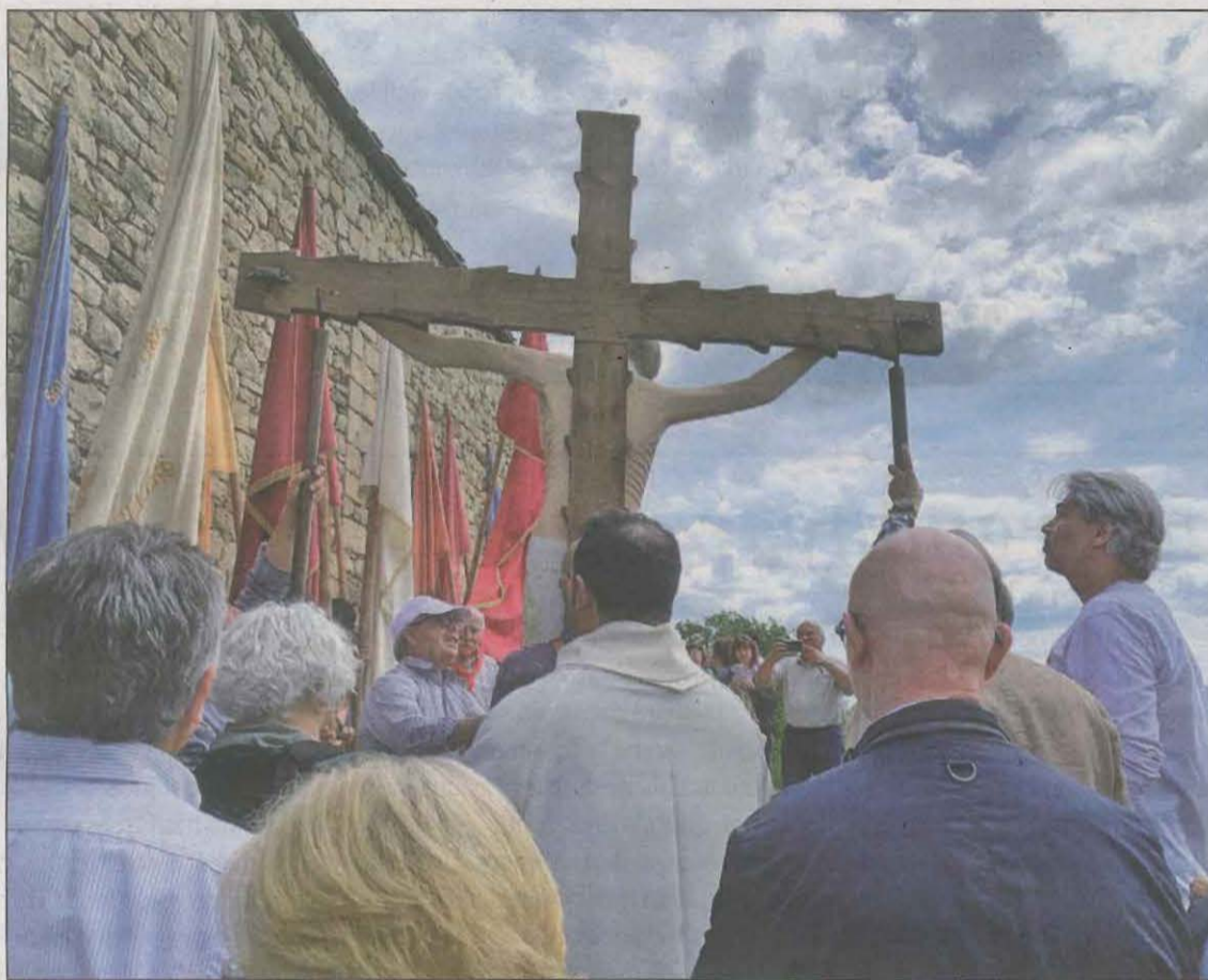
Els veïns van treure en processó un Sant Crist que pesa uns 80 quilos

El Canal Segarra-Garrigues és actualment l'encarregat de regar més de 7.000 hectàrees de terreny, però la situació de sequera està afectant greument la producció agrícola. Les 2.147 hectàrees destinades a cereal d'hivern i blat de moro només podran fer una collita, ja que la sequera impedeix el cultiu d'estiu, mentre que per als altres cultius, l'aigua disponible és insuficient per salvar els arbres i garantir una collita. Això representa una important pèrdua per als pagesos i pot posar en perill la producció agrícola de la zona, alerten. La situació al