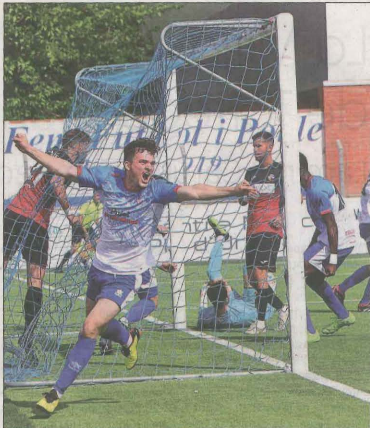
El Mollerrussa sigue al frente de la clasificación

Mientras, los de l'Urgell se impusieron por 1-2 en el campo del Horta. Verdés anotó el 0-1, los locales igualaron y Suraci transformó el 1-2 final en el minuto 73.