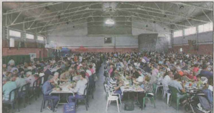
Centenars de persones van anar al dinar popular