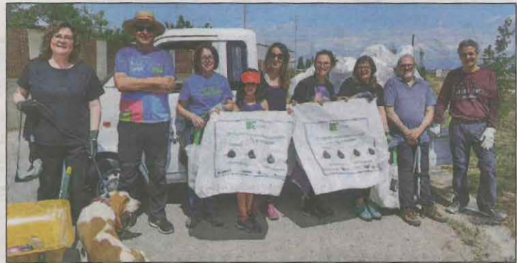
Els voluntaris que hi van participar