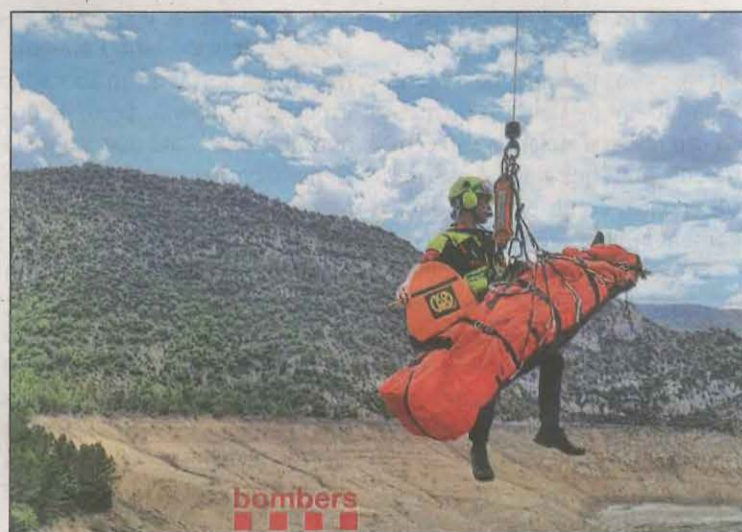
Moment en què l'home era auxiliat pels efectius

les 12.07 hores. Amb les primeres informacions, ràpidament fins al lloc es va desplaçar un helicòpter del cos amb efectius del GRAE i una metge. Després d'una primera assistència i posar-lo al matalàs de buit que portava l'aeronau, l'home va ser traslladat a l'Hospital de Tremp per tal de ser tractat de les ferides que va patir mentre feia escalada.