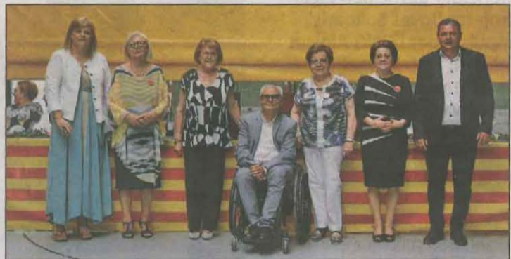
Moment de l'acte que es va dur a terme ahir

de forma incontrolada a la natura. Durant el matí es van recollir 124 quilos de deixalles, entre els quals hi havia llaunes, peces de roba, fustes i ampolles de vidre.