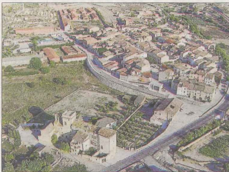
Vista de la Floresta, amb candidatures fantasma del PP i del PSC.