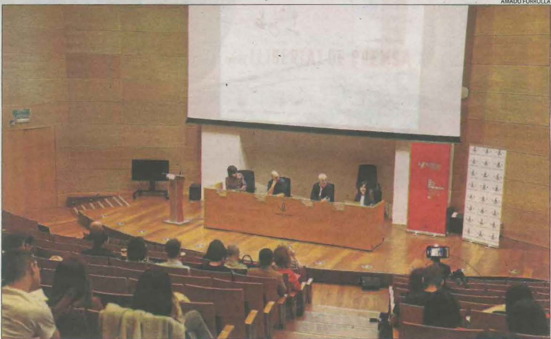
Una de les taules redones del Simposi de Llibertat de Premsa, ahir al campus de Cappont de la UdL.