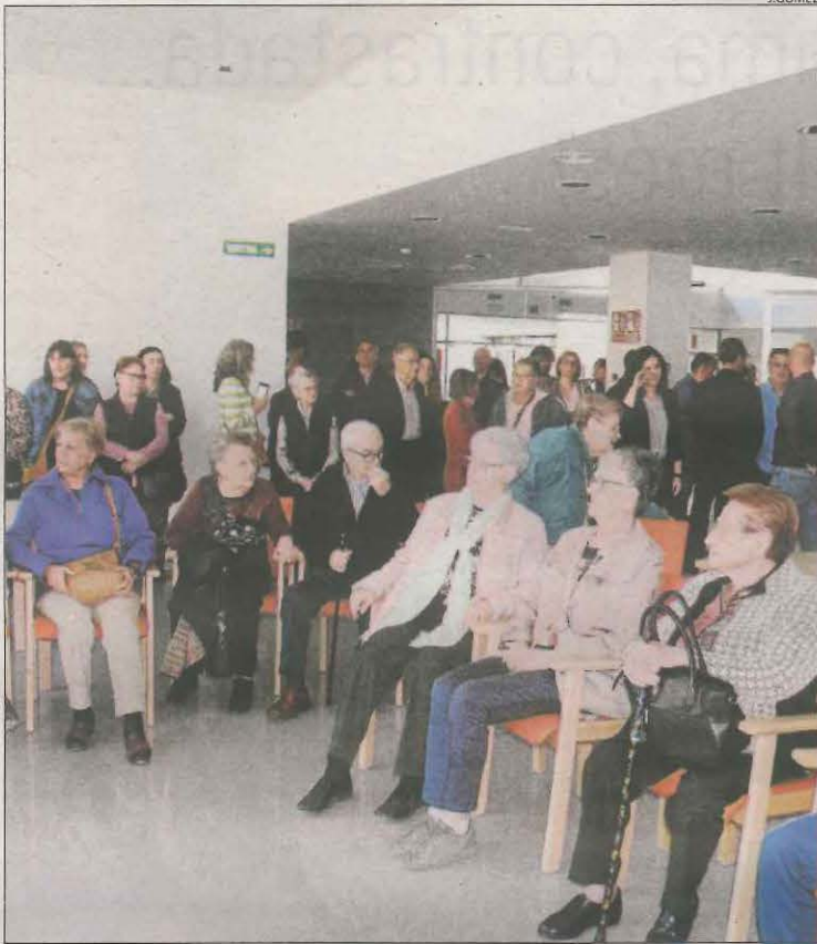
Un dels últims centres de dia s'ha inaugurat a Torregrossa.

D'altra banda, també es preveu la modernització i transformació ecològica de catorze serveis que atenen menors tutelats i la transició energètica de quaranta instal·lacions juvenils. El conseller, Carles Campuzano, va reivindicar la "transformació" que impulsen des del departament. "La Generalitat no havia invertit en la construcció de residències des de fa més d'una dècada. Els fons europeus ens permeten revertir aquesta