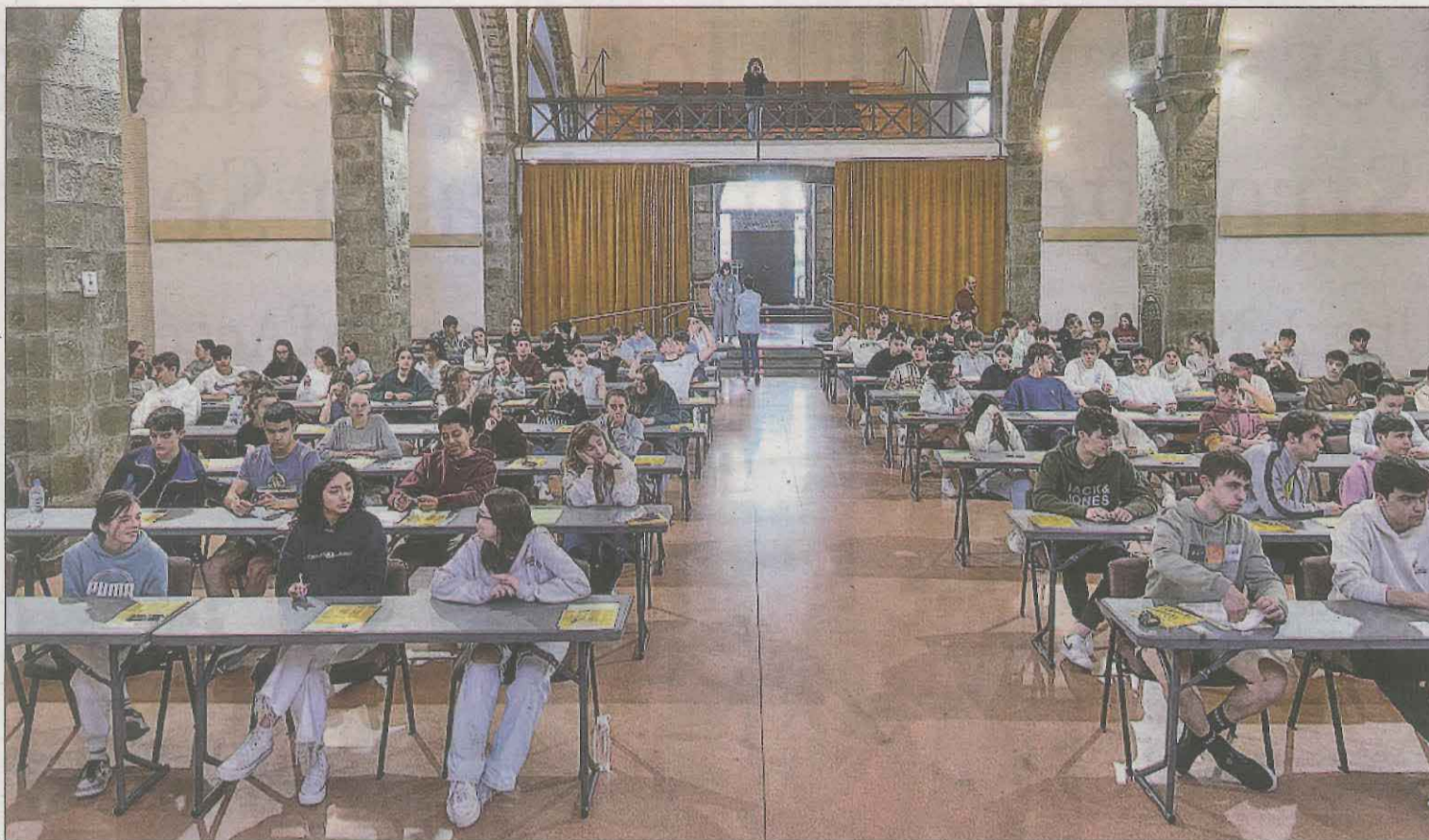
La sala de Sant Domènec de la Seu d'Urgell va acollir ahir l'inici de les proves de la selectivitat pels estudiants pirinencs

Mitjançant la signatura del codi de conducta, participants com ara professors o vigilants es comprometen a guiar la seva actuació "amb els valors de vocació de servei, professionalitat i confiança pública". Un dels punts recull, concretament, el compromís de "vetllar per la prevenció de qualsevol forma d'assetjament psicològic, laboral, sexual, per raó de sexe, o per raó d'orientació sexual, expressió o identitat de gènere". També tenir una actuació "diligent" quan se'n detecti un cas. El document inclou altres principis, com fer un ús "adequat i responsable" de la informació a què hagi tingut accés en l'exercici de les seves funcions i responsabilitats, "evitant treure'n profit personal o per a tercers persones". El codi s'organitza en tres blocs: principis generals, respecte al desenvolupament de tasques i respecte als recursos i la informació.