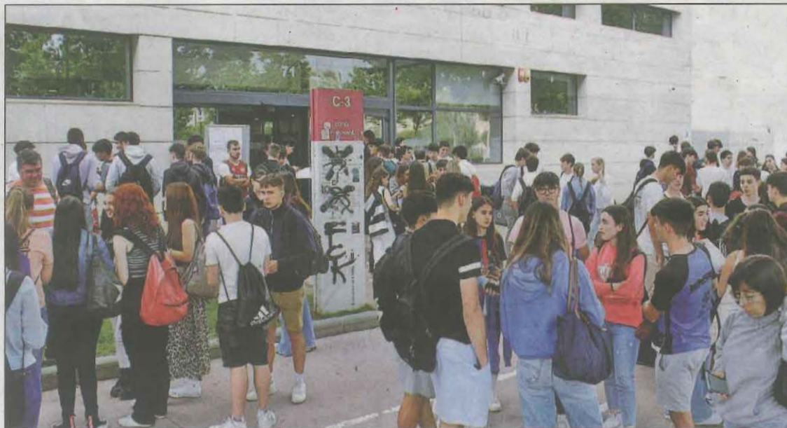
El Campus de Cappont va acollir 1.278 estudiants que s'examinaven de la Selectivitat

A la sortida de la primera prova, la de llengua castellana i literatura, alguns estudiants van dir que els hi ha anat més bé de l'esperat i que l'havien trobat "assequible". Els estudiants també van trobar fàcils els exàmens de llengua anglesa.