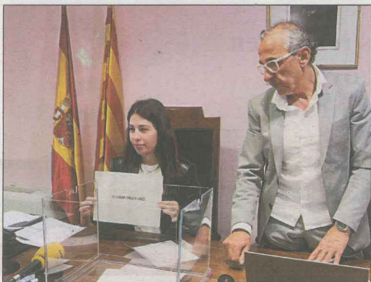
Un sorteig va desfer l'empat que hi va haver el 28-M