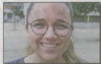
AROA CABREA Institut Ronda

A partir d'aquesta data i fins el dia 26 podran demanar la revisió de les proves i coneixeran el resultat de les reclamacions o doble correccions el 6 de juliol. Així mateix, les proves de Selectivitat de setembre tindran lloc els dies 5, 6 i 7 d'aquell mes.