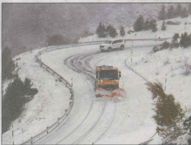
Una màquina llavaneu neteja la C-28, al port de la Bonaigua

tres quadrats de terreny allavós i, tot i que cada any és diferent, es registren entre 250 i 300 allaus per temporada. En aquesta, se n'han registrat 171 i cap de mida 4, que és la suficient per recórrer 50 metres en terreny pla. El sector amb més freqüència d'allaus ha estat l'Aran-Franja Nord de la Pallaresa, seguit de la Ribagorçana-Vall Fosca i el Ter-Freser.