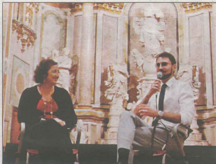
El PSC va guanyar les eleccions municipals a Cervera