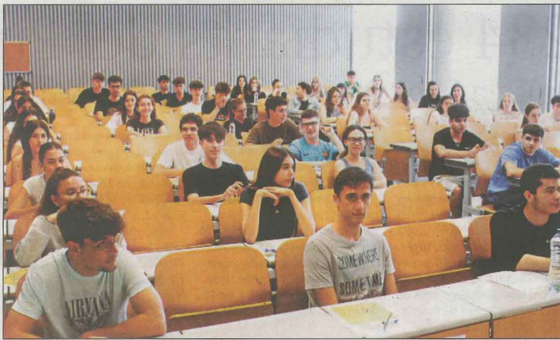
Estudiants a punt d'iniciar la Selectivitat en una aula de la Facultat de Dret, Economia i Turisme

Les proves s'allargaran dos dies més on avui s'avaluaran de la matèria comuna d'història i altres específiques com matemàtiques, llatí, dibuix tècnic i química. I, el divendres conclouran amb català i optatives com biologia, economia i disseny.