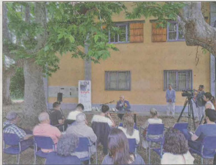
Presentació de la ruta al Museu de l'Aigua

Una ruta adreçada al públic familiar i que ha de servir per diversificar i desestacionalitzar l'oferta turística del Pirineu i les Terres