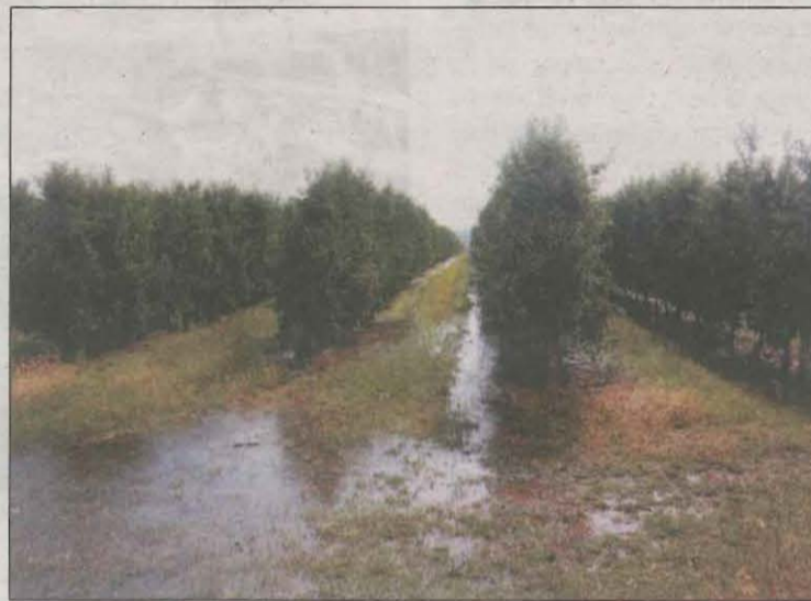
Reg a manta en una finca de pomes de Puiggròs

En una reunió el 8 de juny amb la CHE, les organitzacions i col·lectius agraris de Ponent van reclamar a la presidenta de la Confederació "més garanties" sobre els regs que hi ha previstos pels arbres fruiters i extensius així com de l'aigua disponible per a les explotacions ramaderes. Cal