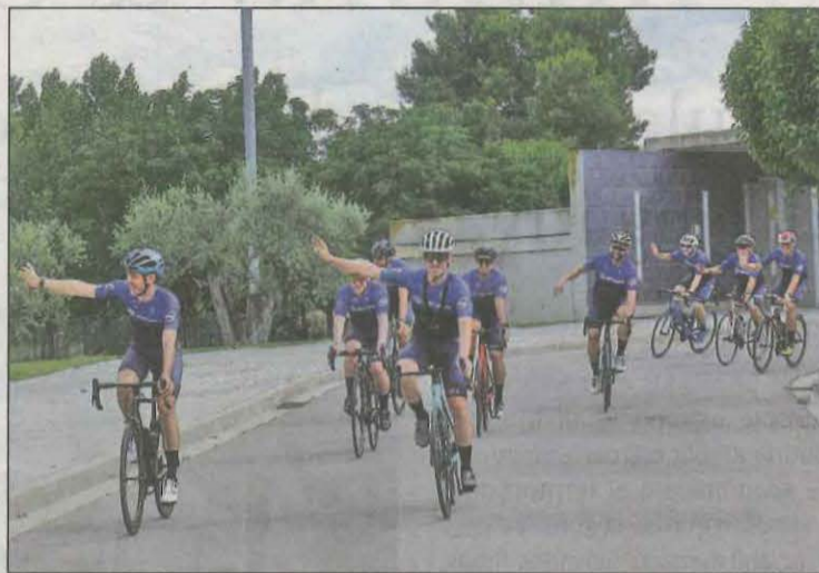
La iniciativa es va presentar ahir a Torrefarrera

La iniciativa vol fer partícips als nois i noies d'Aspamis, per la qual cosa tots els dies que duri la carrera s'habilitarà una sala en els diferents centres que té Aspamis (dos a Torrefarrera, un a Alcoletge i un a Vencillón) per a què els residents pugui connectar via telemàtica amb els ciclistes, animar-los en la seva gesta i