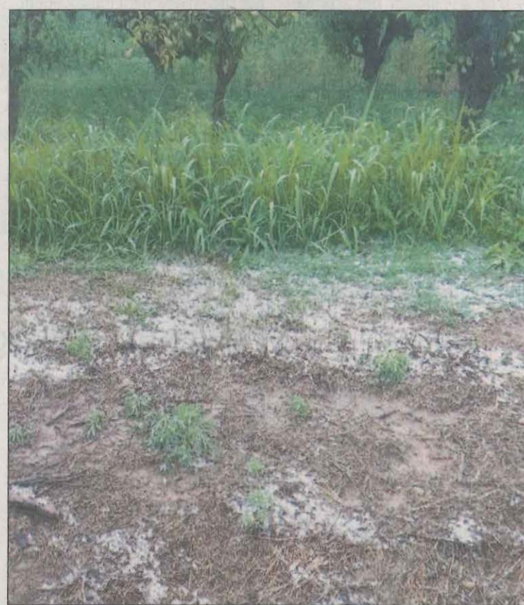
Pedra en un camp de fruiters a Torrelameu, la Noguera