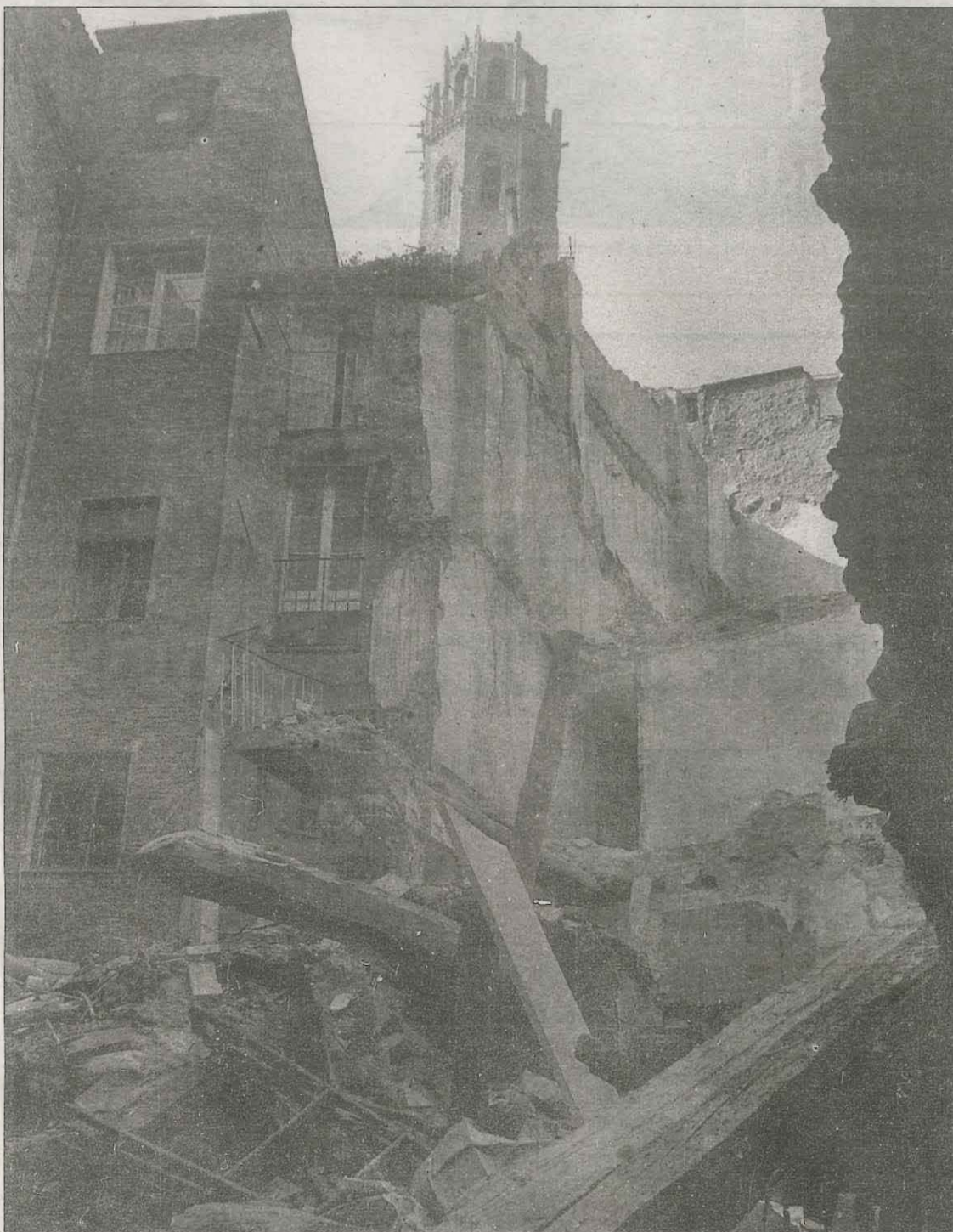
Demolició d'edificis al Canyeret, al final de la dècada dels anys setanta