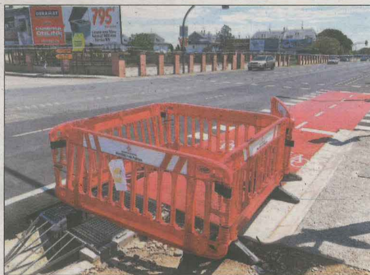
El tram inacabat del carril tancat amb unes tanques

El Consell de Col·legis de Graduats Socials de Catalunya denuncia que els graduats i graduades socials tenen greus dificultats per dur a terme la seva feina diària envers l'Administració laboral. Els sistemes telemàtics RED i CASIA de l'Administració laboral, que permeten fer els tràmits entre l'empresa i la Seguretat Social, presenten unes ineficiències fonamentades en la manca d'agilitat dels procediments. També es queixen que els terminis per presentar les altes i baixes i la incapacitat laboral a la Tresoreria General de la Seguretat Social (TGSS) són mínims i insostenibles. A més, el formulari per actualitzar les dades de les persones autònomes a la TGSS té importants mancances de funcionament i les liquidacions rectificatives per imports irròris provoquen una feina afegida molt rellevant.