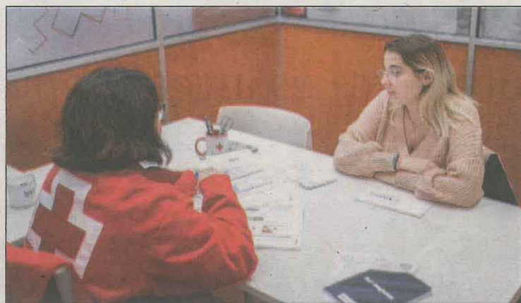
Una de les persones ateses a la seu lleidatana

Dins d'aquest col·lectiu de persones especialment vulnerables, cal remarcar que el 54% han estat dones, amb una franja d'edat