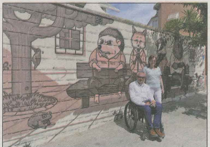
L'alcalde, amb un dels murals pintats al poble

La nostra s'ha convertit en una demanda endèmica i la paciència ja se'n ha acabat", manifesten des de la plataforma. La carretera C-53 està definida per un traçat altament perillós que ha deixat 119 ferits lleus, 17 ferits greus i 8 víctimes mortals entre els punts quilomètrics 129 i 134 des de l'any 2000 fins al 2023.