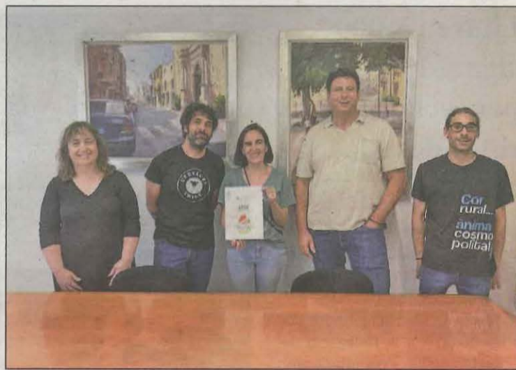
El consistori va fer una donació a l'Afanoc