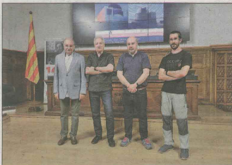
Els ponents de la conferència, ahir