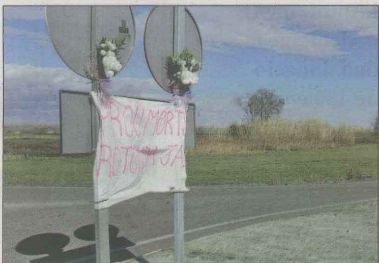
Imatge d'arxiu de la carretera C-53

"Des de SomRotondes C-53 volem fer entrega a les autoritats competents de les gairebé 5.000