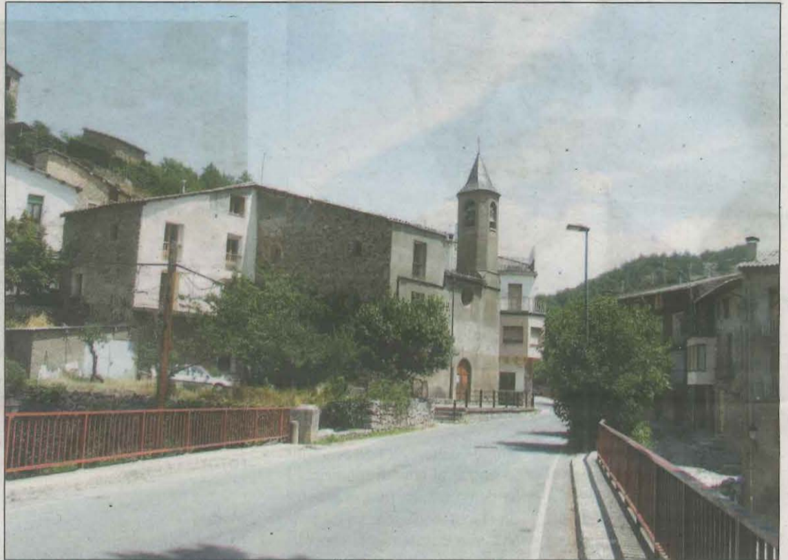
Els veïns del municipi del Pallars Jussà no tenien telèfon fix des del passat 5 de juny

"No podem fer ni rebre trucades, i això fa que no puguem atendre les incidències o emergències que ens puguin sorgir",