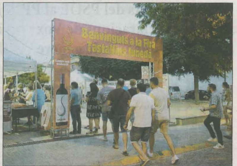
Imatge d'arxiu d'una edició anterior de la fira