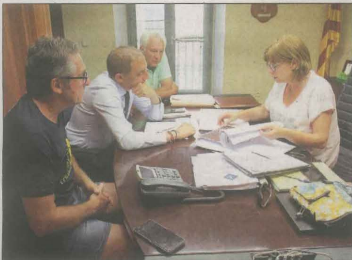
El subdelegat va visitar ahir la capital de l'Alta Ribagorça

a cada àrea un conseller responsable, eliminar una de les dues vicepresidències remunerades, una gerència tècnica escollida per consens de les dues formacions sense perfil polític i dotar de més poder de decisió el Consell d'Alcaldies i celebrar-los de forma itinerant. A més, conjuntament amb els ajuntaments, es plantejava treballar en el projecte d'establir una entrada al Parc Nacional d'Aigüestortes per Capdella, una pla estatègic de la BTT a la comarca, impulsar la creació d'una gossera comarcal, un camp d'eslàlom de piragüisme al riu Noguera Pallaresa, un pla de dinamització de l'Embassament de Sant Antoni, la creació del Parc Natural del Montsec i convertir la Reserva Nacional de caça de Boumort en Parc Natural.