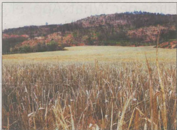
Imatge d'un camp de cereals afectat per la sequera

En el cas de l'Estat, doncs, el govern espanyol podria impulsar