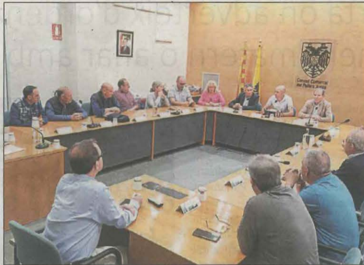
Imatge del darrer consell d'alcaldes de Jussà

L'assemblea de càrrecs electes de Junts per Catalunya ha acordat per unanimitat no entrar a negociar un pacte a tres al Consell Comarcal del Pallars Jussà amb ERC i el PSC. Des de la formació manifesten la seva voluntat de materialitzar el pacte per renovar tota l'estructura de l'ens que van estar treballant les dues formacions independentistes i on, segons han expressat en un comunicat, va coincidir en la totalitat de les propostes. Així, entenen que la primera i segona força del Consell Comarcal, que suma 14 consellers d'un total de 19 i que governa amb majoria absoluta a 10 dels 14 municipis, han de continuar governant la institució supramunicipal amb un projecte