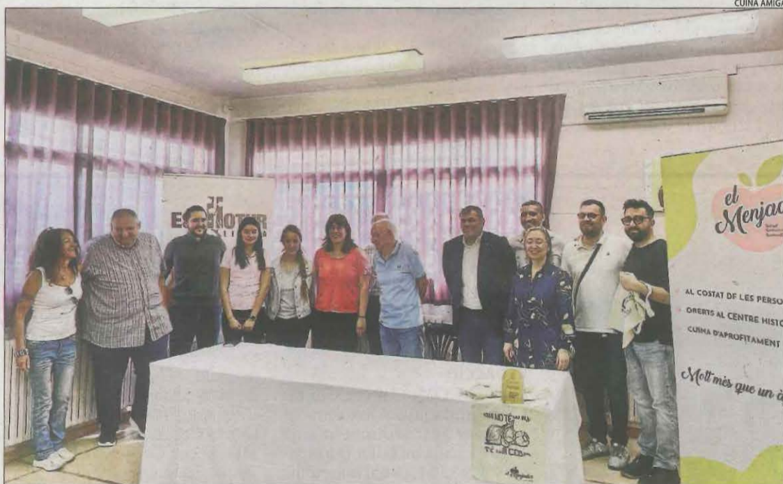
Acte en reconeixement als xefs de Cuina Amiga que han cuinat per al menjador social de Jericó.