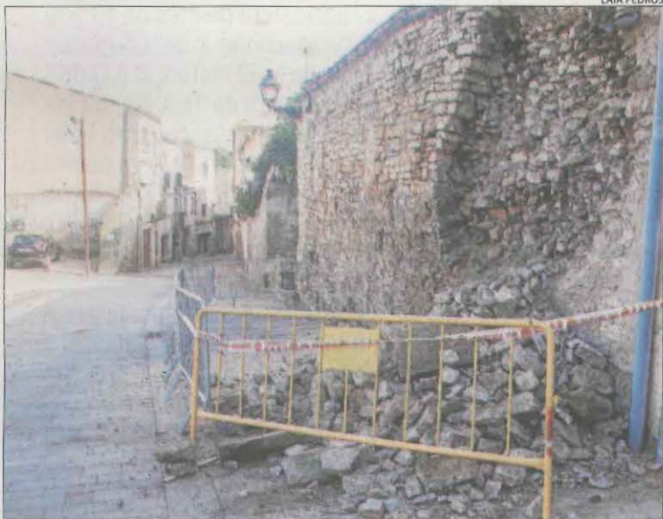
El despeniment del mur que es va produir a Cervera.

A més, un despeniment a la carretera C-13 a Castell de Mur, al Jussà, va causar un accident al xocar un cotxe amb una pedra encara que sense més conseqüències. A última hora de la tarda es va donar pas alternatiu als vehicles en el quilòmetre 71,5, la qual cosa va generar retencions de circulació.