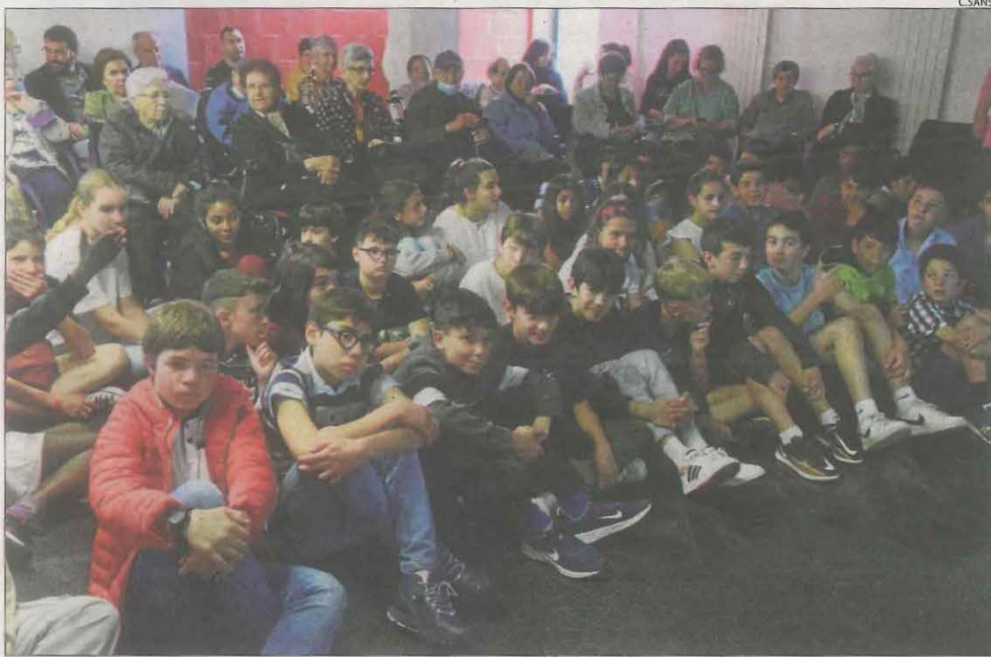
Alumnes i avis es van reunir a l'Arxiu Comarcal de l'Alt Urgell.