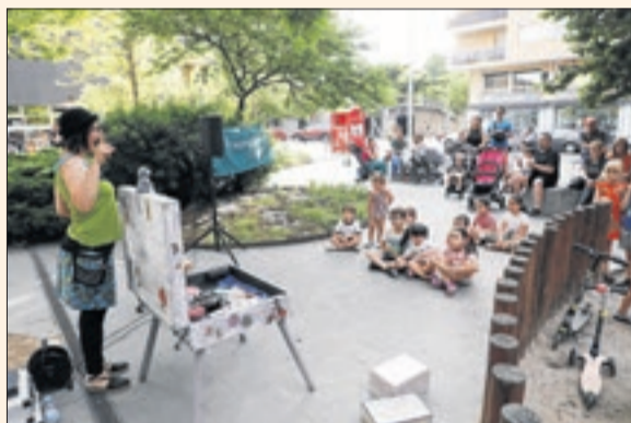
Cappont, de festa tot el cap de setmana.

El barri de Cappont celebra la seua festa major amb una picada d'ullet a l'esport i a les tradicions. Avui, el dia gran de la festa, la jornada començarà a les 18.00 h amb una demostració d'activitats dirigides pel gimnàs Synergym al carrer Doctora Castells. A les 20.30 h, l'historiador i investigador Xavier Reñé serà l'encarregat de llegir el pregó a la plaça Blas Infante, on a les 21.00 h hi haurà un concert de gòspel. Per tancar, a les 23.30, Judit&Lian s'encarregaran del ball a la plaça.