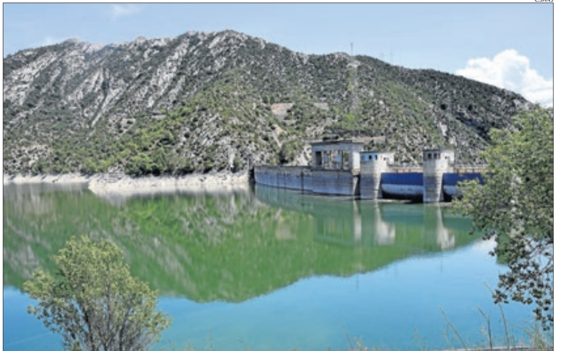
El pantà d'Oliana emmagatzema, en l'actualitat, 63,38 hm cúbics, dels quals cal restar-ne uns 20.

També cal restar de les actuals reserves els 14,5 hm 3 per als torns de reg destinats a salvar arbratge tant al Canal d'Urgell, amb 12,5 hm 3 , i al Segarra-Garrigues, que té uns altres 2 hm 3 per regar fruiters fins al dia 21.