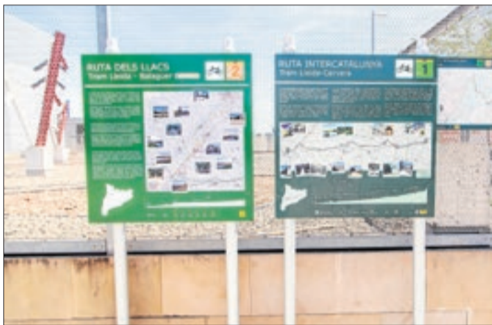
La ruta entre Lleida i Balaguer es va estrenar el 2019.

BALAGUER | L'empresa pública Infraestructures.cat ha adjudicat per més d'un milió d'euros les obres del corredor cicloturístic entre Balaguer i la Poble de Segur, conegut com la Ruta dels Llacs, que s'inclou a la xarxa catalana de rutes ciclistes de llarg recorregut, que tindrà 125 quilòmetres de llarg i transcorrerà per les comarques del Segrià, la Noguera i el Jussà, paral·lela a la línia de tren de Lleida-la Poble. Aquesta fase contempla els treballs per habilitar un tram de 12 quilòmetres entre Balaguer i Sant Llorenç de Montgai. Un altre quilòmetre correspon al tram entre Cellers i Salàs de Pallars on s'han d'eixamplar ponts amb un carril addicional i actuacions de millora de la permeabilitat de la carretera