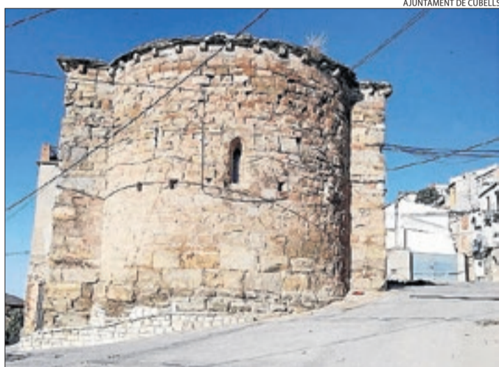
La capella de Sant Pere de Cubells.

CUBELLS | Cubells millorarà els entorns de les esglésies de Santa Maria i Sant Pere com a reclam turístic del municipi. Aquests treballs s'inclouen el projecte Paisatges de Ponent, cofinançats per la Diputació i l'ajuntament amb fons Feder, i contemplen una inversió de més de 55.000 euros.