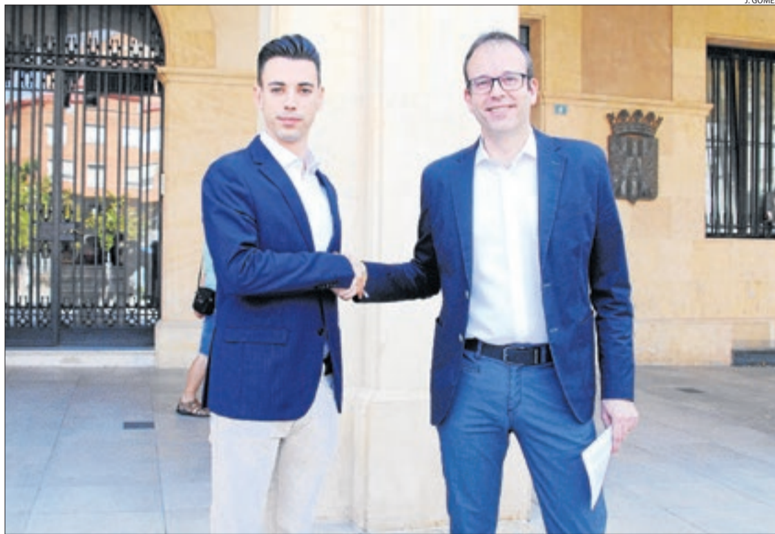
Bastons i Solsona ahir, després d'annunciar l'acord a Mollerussa.