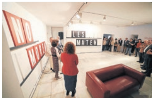
'Les llengües no moren, les maten', a la sala Cristòfol.

SALA DE TAST DE LA CASA DELS VINS. CASTELL DEL REMEI. El pèlag. El Castell del Remei acull l'exposició del pintor Miguel de Ibarba a la Sala de Tast de la Casa dels Vins. Fins al 30 de juny. BIBLIOTECA PÚBLICA. LLEIDA. Geografies Vallverdú. La Biblioteca Pública de Lleida repassa la vida i obra de l'escriptor lleidatà Josep Vallverdú en el centenari del seu naixement. Més de 300 obres de l'autor a més d'altres peces que ajuden a conèixer l'autor. Fins al 20 de juny. La ferida infinita. Tres mirades sobre el conflicte: Guinovart, Nartozky i Cardona Torrandell. Diàleg d'artistes de la mateixa generació sobre els conflictes bèl·lics del s. XX. Fins al 10 de setembre. LE PETIT ATELIER. LLEIDA. C. AMSTERDAM, 4. Meraki. Mabel Blasco presenta l'última col·lecció d'obres pictòriques que exposen la seua visió particular de l'art del pinzell. Fins al 4 de juliol. CAIXAFORUM. LLEIDA. AV. BLONDEL, 3. Faraó. Rei d'Egipte. Una col·lecció d'objectes procedents del British Museum explora els ideals, el simbolisme i la ideologia dels faraons i la vida a la vall del Nil. Oberta fins al 23 de juliol. FUND. SORIGUÉ. LLEIDA. ALCALDE PUJOL, 2. La vida en emergència. Juan Zamora. La primera gran mostra individual de l'artista convida a la reflexió. Fins al 17 de desembre. MUSEU DE L'AIGUA. CAMPAMENT DE LA CANADENCA. LLEIDA. Joan Oró. El científic de la vida. Amb motiu de l'Any Oró, aquesta exposició recull 161 objectes rellevants del llegat de l'investigador lleidatà. Permanent.