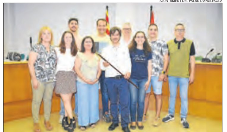
AJUNTAMENT DEL PALAU D'ANGLESOLA