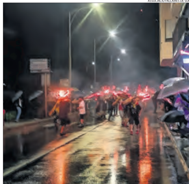
ASSOCIACIÓ FALLAIRES DE SORT

Malgrat la pluja, la Falla Major de Sort va tornar a prendre amb el foc de totes les falles.