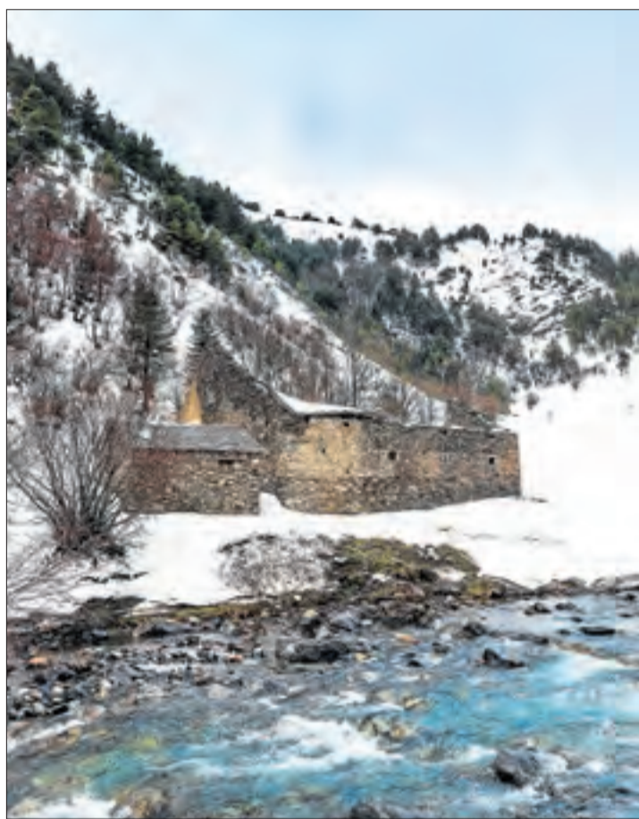
Imatge d'arxiu de la Borda Socampo, a Alt Àneu.

Declaració d'impacte favorable al projecte de Borda Socampo a Alt Àneu