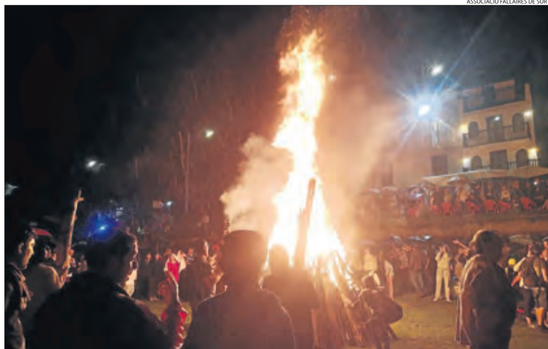
ASSOCIACIÓ FALLAIRES DE SORT

Sort i la Pobla de Segur celebren la baixada de falles amb uns 400 participants entre les dos || Els últims quilòmetres es van veure entelats per l'aigua, que no va impedir que arribessin