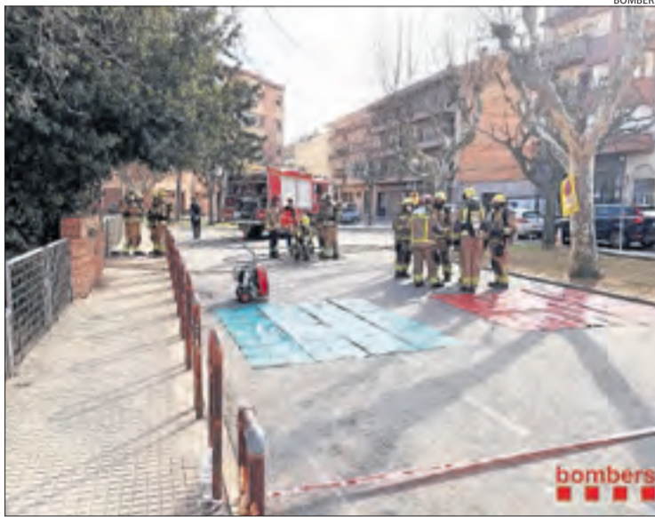
Pràctiques dels bombers voluntaris d'Agramunt.

Una proposta que ja s'ha tirat endavant dels representants del col·lectiu de bombers voluntaris al Consell de Bombers Voluntaris amb la idea que facin aportacions al pla perquè aquest pugui ser aprovat com més aviat millor. Segons Corbella, la prioritat passa per millorar el reconeixement d'aquest col·lectiu tant a nivell intern com en l'àmbit institucional i públic. "La majoria de la societat no sap que hi ha bombers que ho fan de forma voluntària i que estan igual de preparats que la resta", va destacar. Així mateix, el pla busca incentivar més el voluntariat amb la millora del