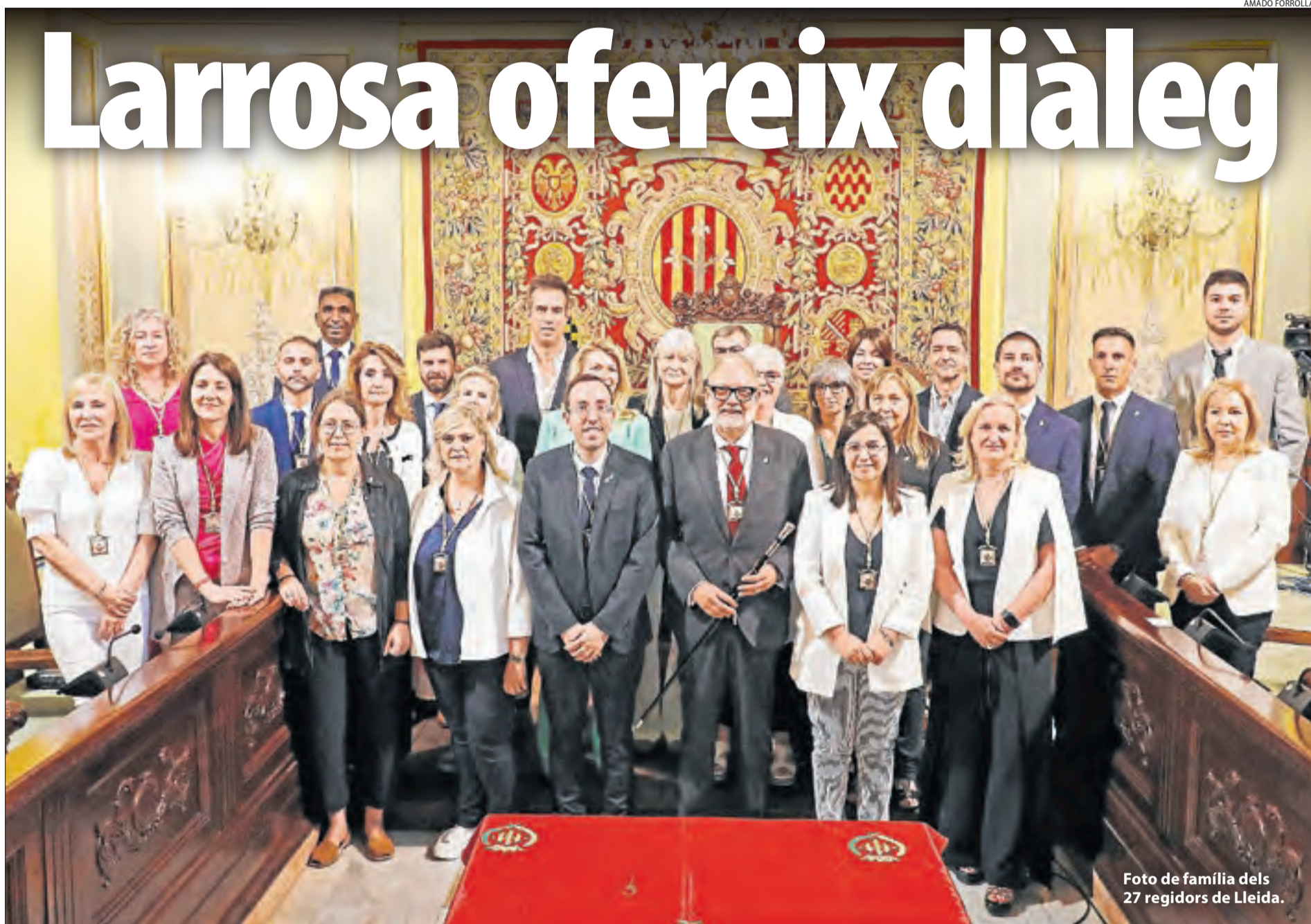
Foto de família dels 27 regidors de Lleida.

Lleida || El PSC governarà en minoria i PP, ERC i Junts diuen estar oberts a intentar assolir acords de ciutat