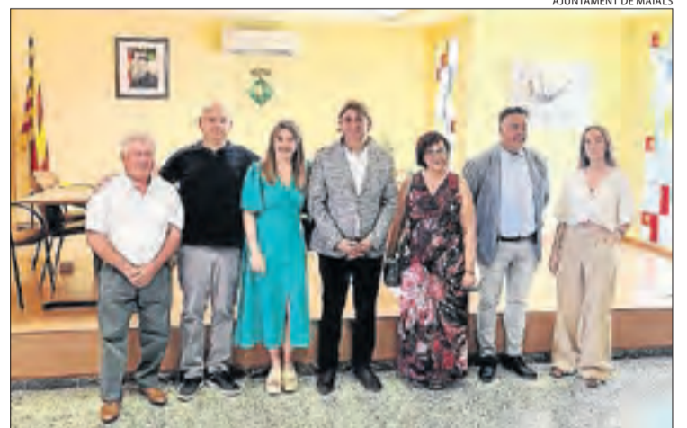
AJUNTAMENT DE MAIALS