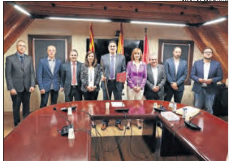
AJUNTAMENT DE NAUT ARAN

Junts no va aconseguir la majoria absoluta a les eleccions del 28 de maig, sinó en un sorteig que la junta electoral de Tremp va celebrar el 7 de juny per desfer un empat en vots entre Junts i ERC pel cinquè regidor. L'atzar va atorgar a Junts aquest edil, el tercer del partit en un consistori de cinc membres.