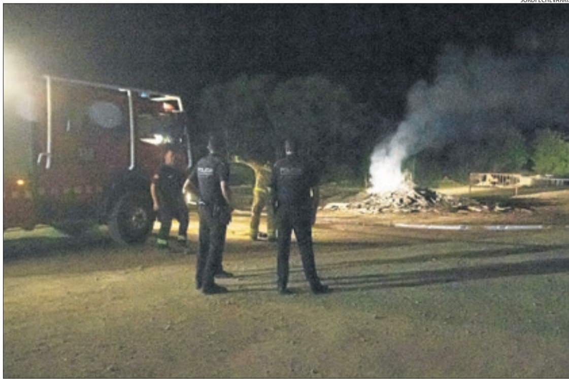
Mossos i Bombers, divendres a la nit després de la tragèdia.

Ahir va ser un dia de dol al poble i es va suspendre un dinar popular i la celebració de l'ascens del CE Gimnells de futbol a Tercera Catalana. La