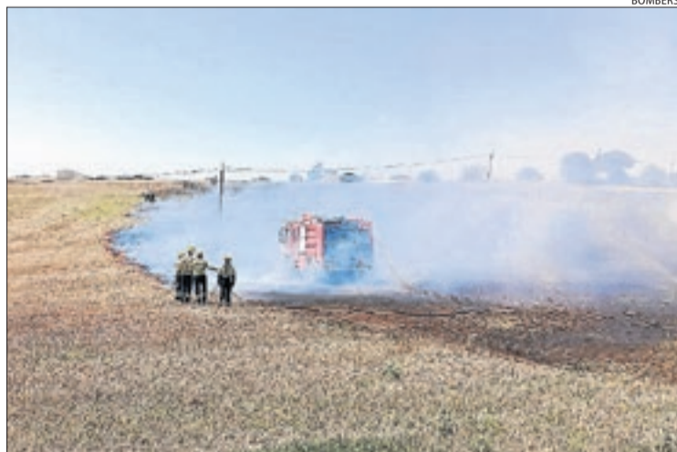
Imatge de l'incendi del matí.