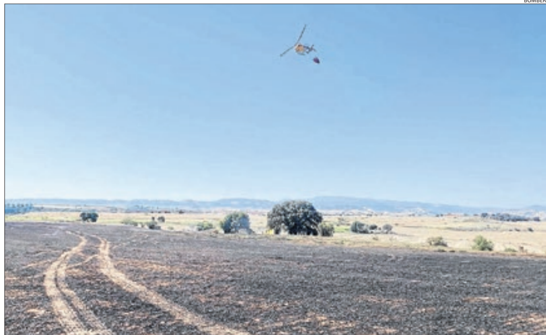
Un helicòpter ahir a la tarda durant les tasques d'extinció.

Posteriorment, a la tarda i a uns quatre quilòmetres del