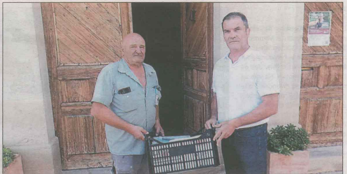
El consistori vol ajudar la gent que ho necessita