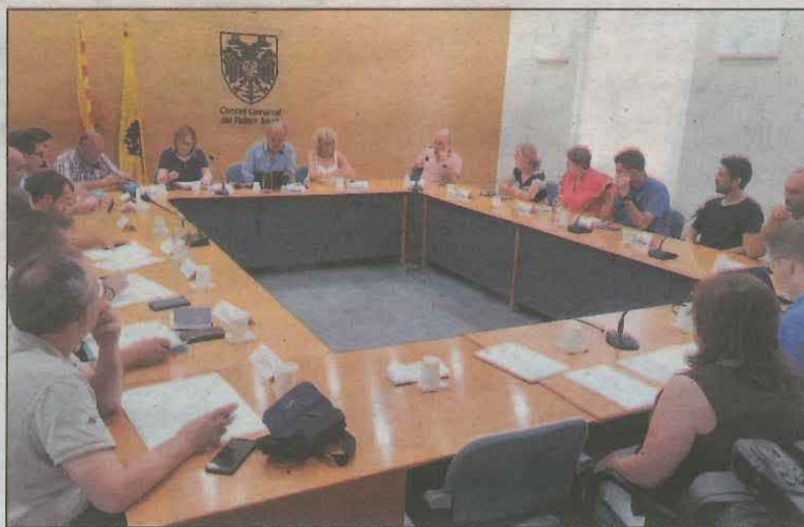
Un moment del Ple del Consell del Pallars Jussà

Jordana també va insistir en la necessitat que el Consell d'Alcaldies passi a tenir un paper decisiu a l'hora de marcar les línies de treball a nivell comarcal, sobretot en aquelles qüestions estratègi-