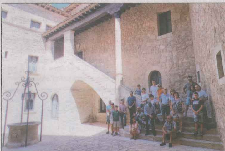
Un dels grups que ha visitat la fortificació

El consistori va explicar que per ara el servei es durà a terme en dies laborables, però si la demanda creix, no es descarta ampliar-lo als caps de setmana, segons va destacar Andreu Balagué.