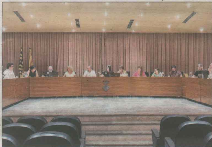
El Ple debatent un dels punts de l'ordre del dia

El Ple també va aprovar formalització de l'adhesió d'ajuntaments i entitats socials per adquirir habitatges provinents del tinteig i retracte i per a la compra