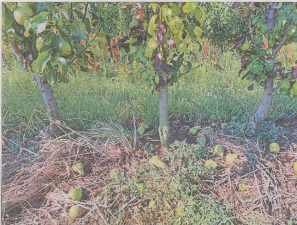
Peres a terra en una finca de Lleida a causa del temporal de dijous al vespre

Els Bombers van dur a terme una vuitantena de sortides a Lleida, la gran majoria per arbres caiguts, però també per inundacions de baixos, sanejament de façanes i afectacions al subministrament de la llum. De fet, a la partida de Marimunt de Lleida, un arbre