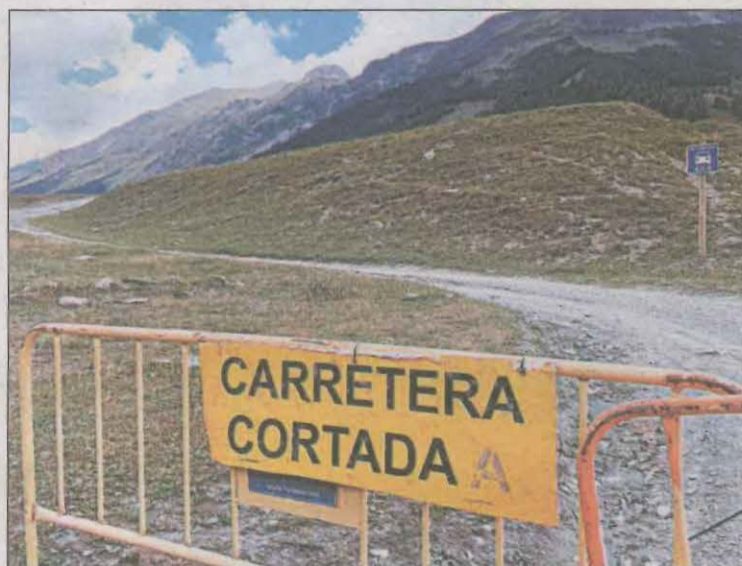
Una tanca informa del tall a la carretera