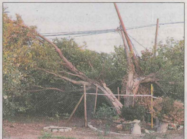
Un arbre caigut a la partida de Montcada