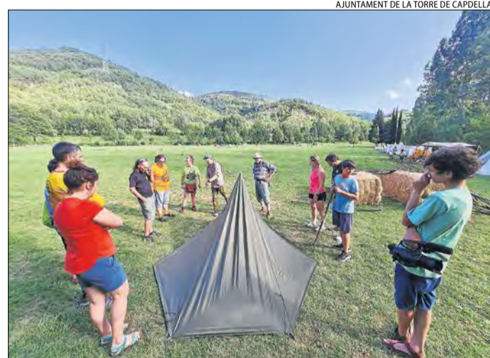
AJUNTAMENT DE LA TORRE DE CAPELLA