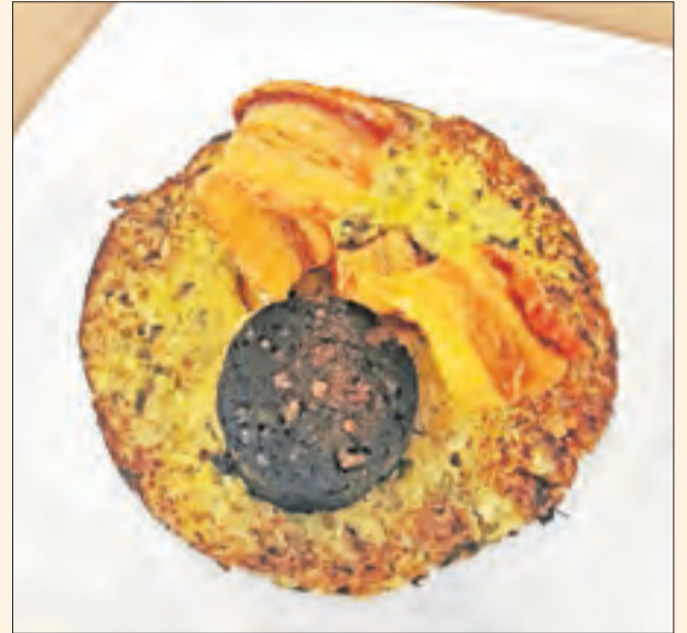
L'exterior de L'Era del Marxant, una idíl·lica imatge de la Pobleta de Bellveí i un dels saborosos i succulents plats de la gastronomia pallaresa que serveixen al local.