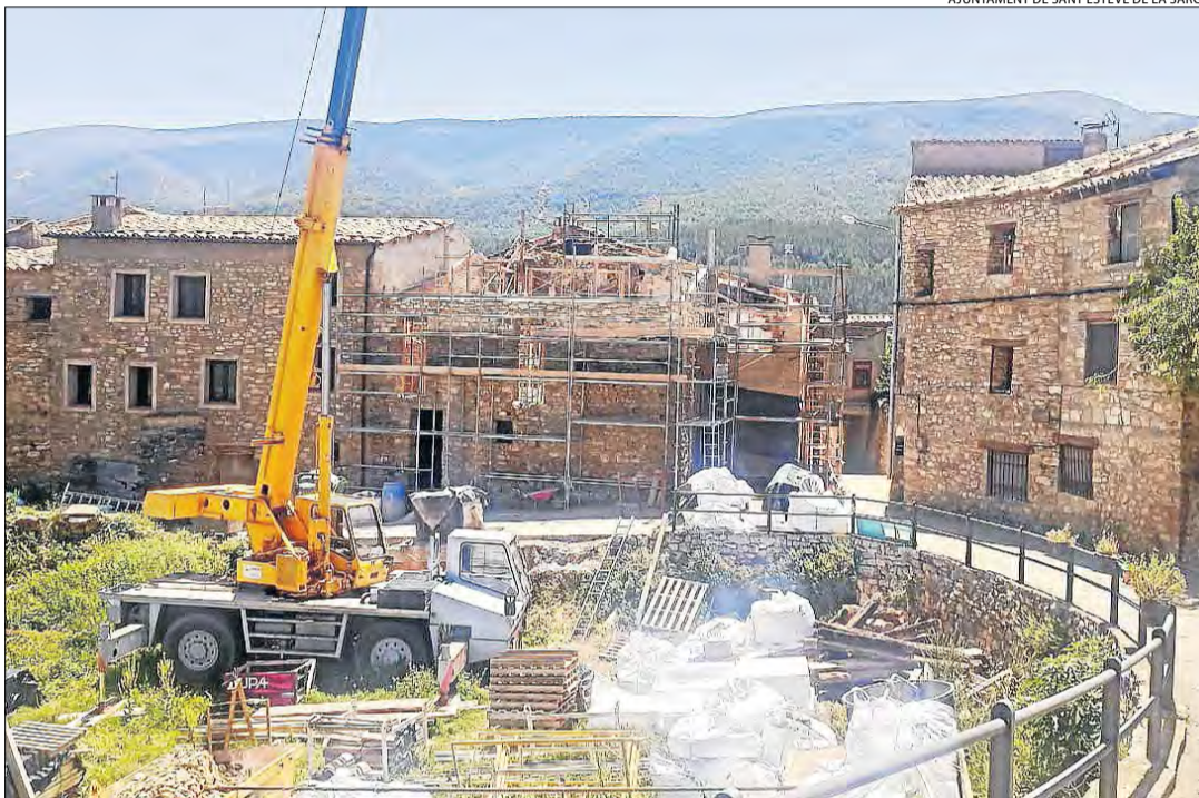
AJUNTAMENT DE SANT ESTEVE DE LA SARGA

El consistori es va veure obligat a incrementar un 30 per cent el pressupost d'aquesta obra per la pujada dels preus dels materials. Aquest canvi va retardar l'inici de les obres