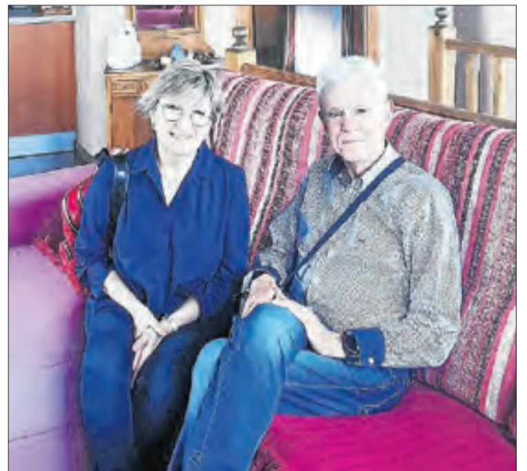
El guanyador i la seua dona gaudint del cap de setmana.