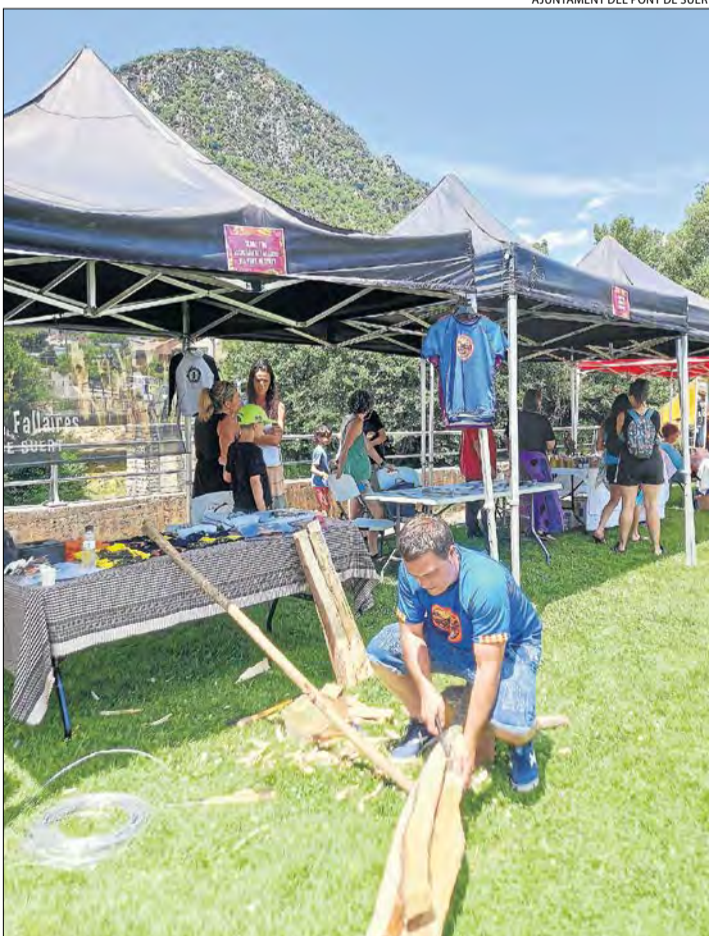
AJUNTAMENT DEL PONT DE SUERT

| EL PONT DE SUERT | El Pont de Suert va acollir ahir el festival Raela't, que va posar punt final al projecte que s'ha dut a terme en els últims dos mesos sobre Cultura i Comunitat a l'Alta Ribagorça, organitzat per l'associació de teatre social La Xixa. El festival va tenir com a objectiu posar en relleu la riquesa cultural de la comarca en totes les seues formes artístiques i donar visibilitat als diferents col·lectius, espais, entitats i projectes de la comarca. Els actes van començar al migdia i es van prolongar fins a la nit. Es van organitzar presentacions de diferents arts escèniques (teatre, clown, dansa, música i poesia), tallers per conèixer la cultura local i altres mostres de disciplines artístiques i culturals.