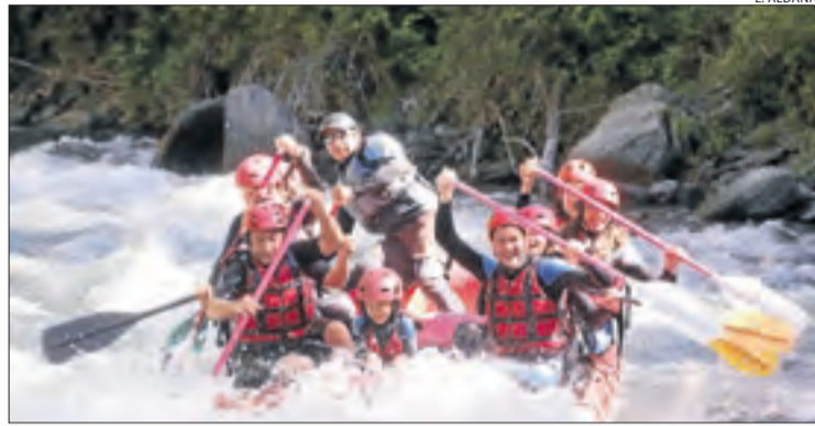
Les comarques pallareses van ser pioneres a introduir el ràfting.

Quan la calor fa estralls, res com descarregar adrenalina fent ràfting. Pel territori lleidatà flueixen quatre rius en òptimes condicions per practicar l'esport d'aventura en aigües ràpides per excel·lència. A més, també pot estirar músculs i refrescar-se alhora tot fent caiac, hidrospeed, bushop, ultra tube o baixant per barrancs, guiats per tècnics. O bé submergir-se en estanys d'alta muntanya i embassaments, com Sallente, Sant Antoni i la Torrasa, entre d'altres. També poden optar