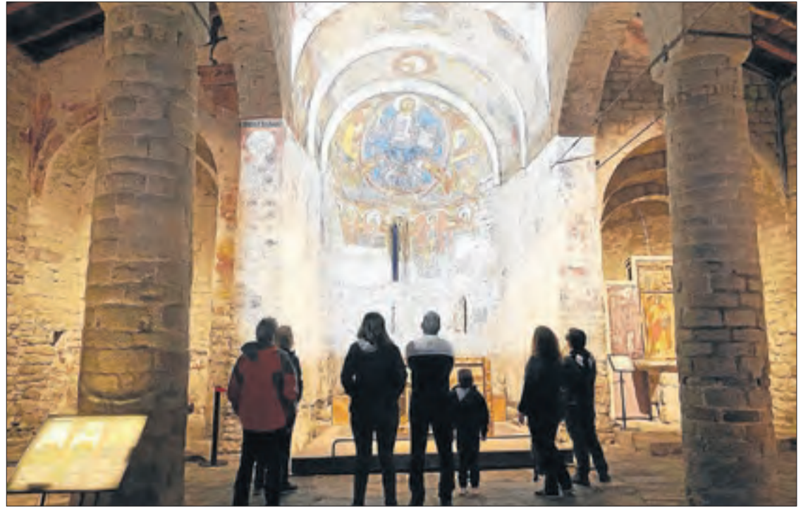
Les esglésies de la Vall de Boí atrauen cada any uns 130.000 visitants, apunta el Patronat de Turisme.

I viatjant enrere en el temps, una mirada al món iber en un indret únic, els Vilars d'Arbeca. O a l'eclosió de l'art del Paleolític, expressat a la Roca dels Moros al Cogul. És només un dels 16 jaciments lleidatans reconeguts per la Unesco, un llistat que empara els Vilasos, a Os de Balaguer, la Roca del Rumbau de