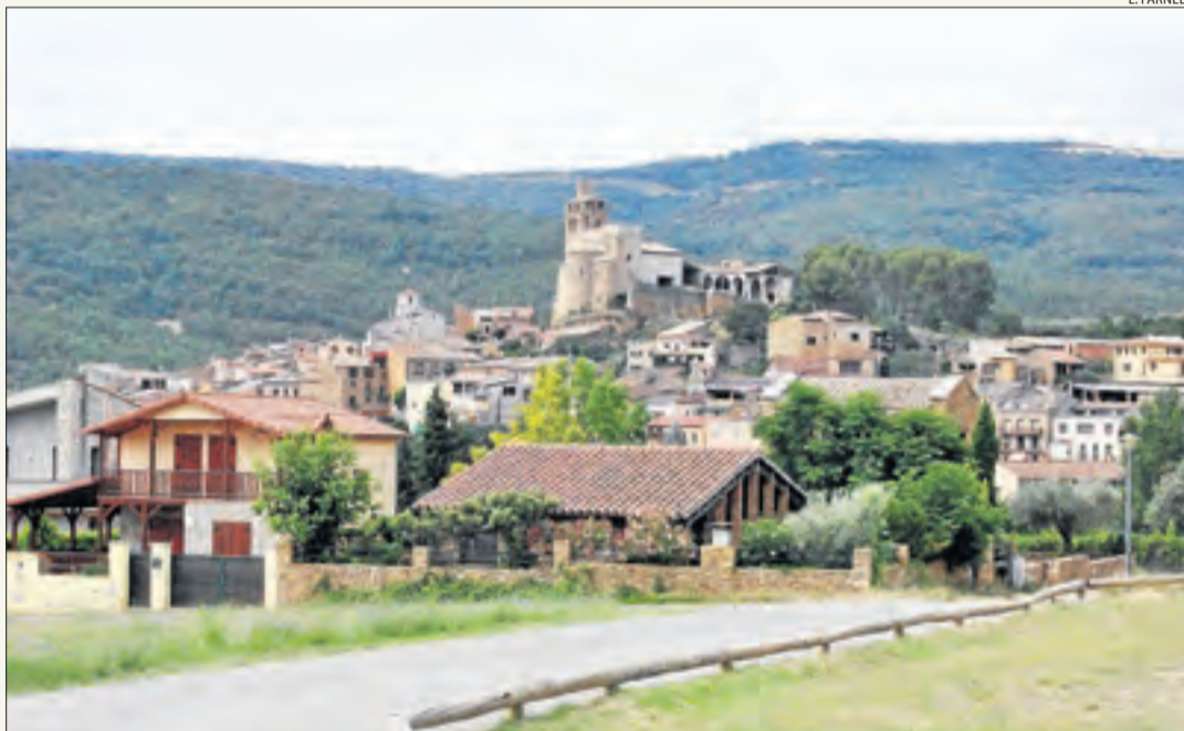
Imatge d'arxiu d'una vista d'Àger.