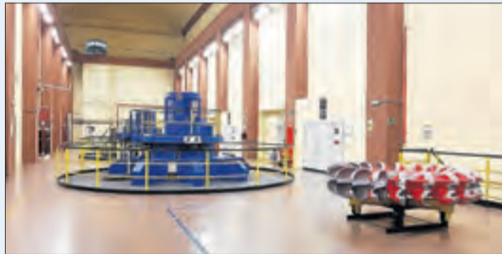
La central, la primera reversible construïda a l'Estat, o el pont romànic de Tavascan són dos dels atractius que caracteritzen la zona.