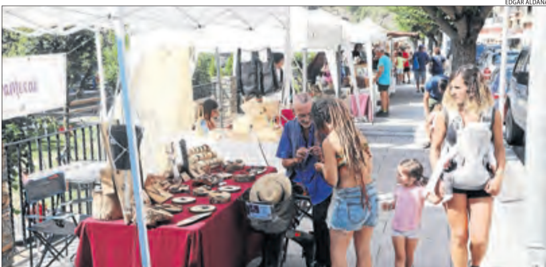
La Fira d'Estiu de Sort es va ubicar en un carrer pròxim a la zona del Parc del Riuet.

D'altra banda, ja han acabat les obres i proves del sistema de calefacció mitjançant biomassa que es posarà en marxa a l'hivern en diversos edificis municipals de la localitat, va remarcar Vidal.