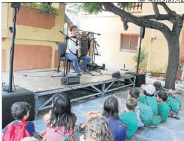
Recital inaugural l'any passat als jardins de l'Hotel Andria.