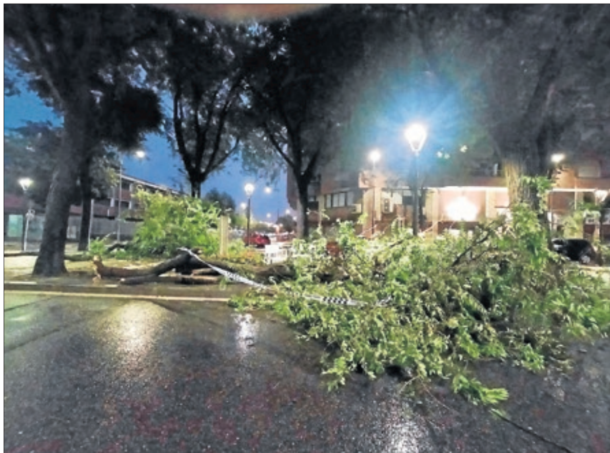
Les fortes ratxes de vent van fer caure alguns arbres a l'avinguda Doctora Castells a Lleida.