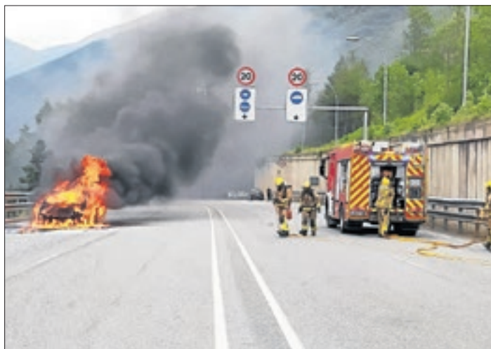
El vehicle es va calcinar del tot i el conductor va sortir il·lès.