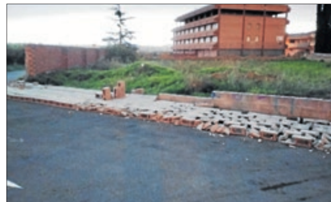
El vent va enderrocar un mur a Aitona.