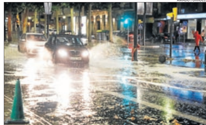
La pluja va deixar carrers semiinundats a la capital del Segrià.