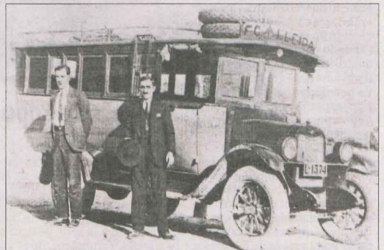
Autobús utilitzat per als desplaçaments fora de Lleida.

Del bar Salvat va nàixer un conjunt més, el Lleida Sport Club, que jugava a Pardinyes. Al Camp d'Esports es van quedar els antics socis conservadors dels Calaveras, que van fundar l'Associació Esportiva Lleida. Després de la Guerra Civil, d'ambdós clubs va nàixer el Club Lérida Balompié, després rebatejat com la Unió Esportiva Lleida. Però això ja és una altra història.