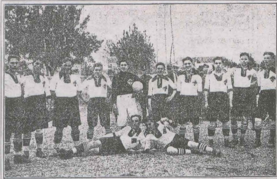
Primer equip del FC Lleyda (temporada 23-24) a la revista 'Lleyda Deportiva'.

Un mes després de la formació de l'equip, amb motiu de la festa major, es van organitzar els primers amistosos contra el Wanderers Team de Barcelona (10 de maig), el Terrassa (12-13) i el Catalunya de les Corts