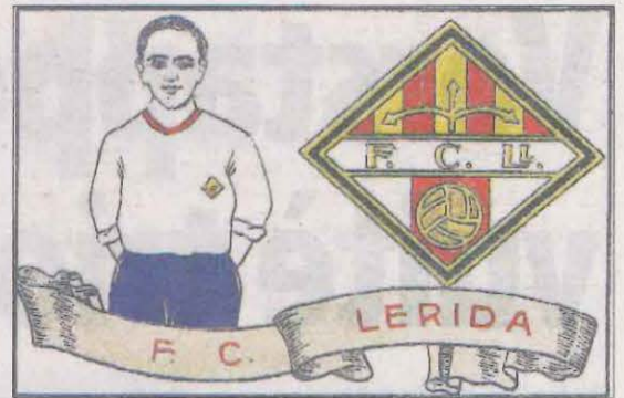
Col·leccionistes. Cromo número 44 de la col·lecció d'equips de futbol de Xocolates Ametller.