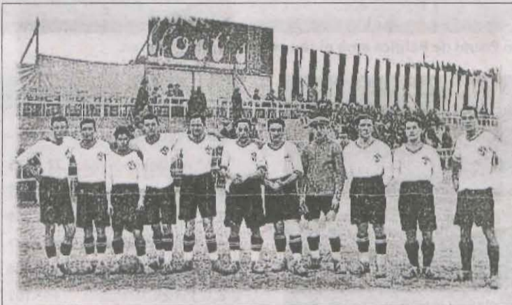
El camp del FC Lleyda. A Cappont, es cobria amb lones per evitar els intrusos.