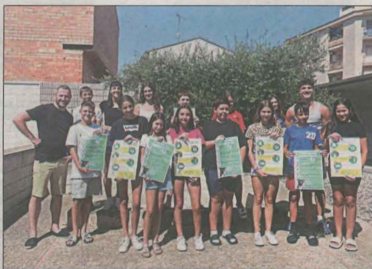
Joves que han participat al Camp de Treball

En el transcurs del programa, s'ha dut a terme una campanya de diagnòsi, disseny i sensibilització sobre la tinença responsable de gossos, amb la participació ac-