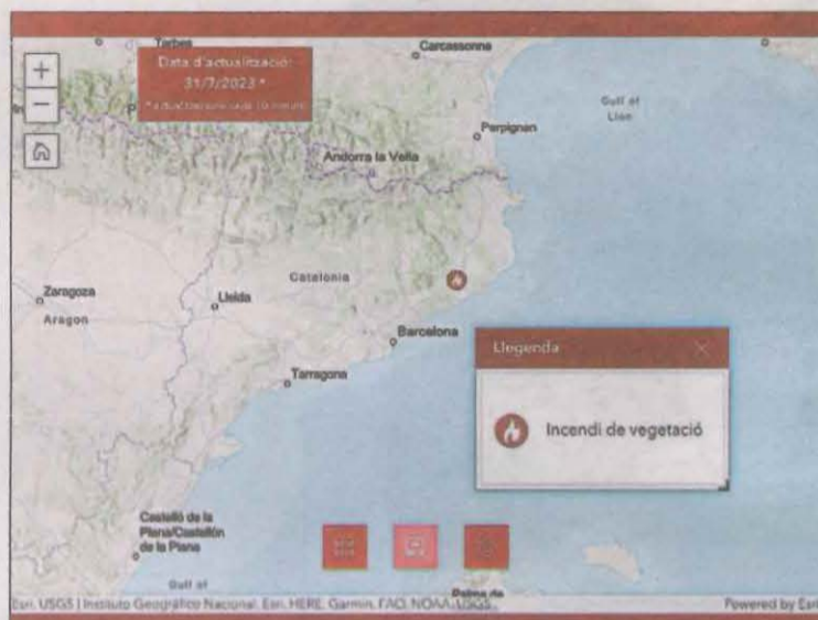
Imatge del nou visor d'actuacions dels Bombers

El projecte, que s'està acabant de desenvolupar, inclourà a partir del setembre la fase de cada incendi, amb un color diferenciat de la icona que l'identificarà i un filtre de cerca que permetrà bus-