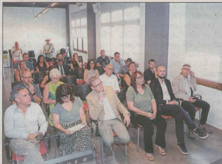
L'oficina Acelera Pyme es va inaugurar ahir a Tàrrega

El projecte planteja solucions en mobilitat que permetran ubicacions físiques i virtuals als diferents Punts d'Atenció Globalleida de les comarques de la demarcació de Lleida (vuit subseus), coordinades des d'una seu central i, en coordinació amb l'oficina OAP rural Pirineus Occidental, que dona cobertura al Pallars Jussà, Pallars Sobirà, Alta Ribagorça i Vall d'Aran. L'OAP Rural organitzarà