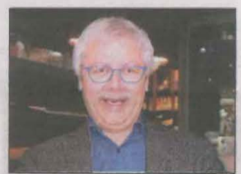
LLEIDA | PAG. 14