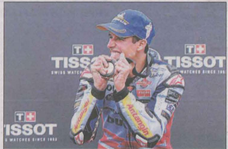
El piloto de Cervera celebra su victoria en Silvestone