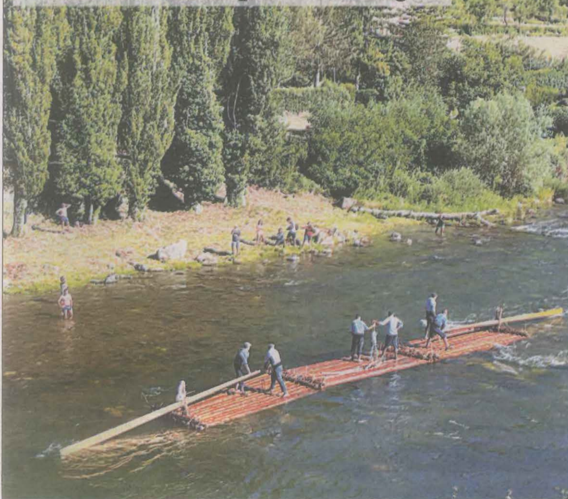
Imagen de los 'raiers' en el río Noguera Pallaresa a su paso por Gerri de la Sal LLEIDA | PÁG.12

Los 'raiers' vuelven a navegar por Gerri de la Sal después de un siglo