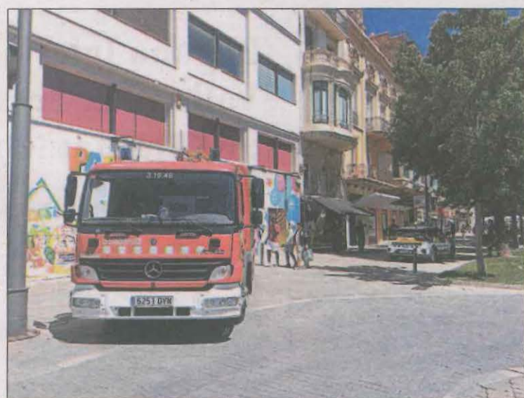
Els Bombers van accedir a l'edifici per l'Avinguda Blondel

l'anècdota que dues persones havien deslligat les cordes d'un rai estacionat al pont de Gerri, i havien tingut l'ocurrència de baixar ells el rai, que poc abans d'arribar al congost de Collegats s'havia estavellat contra les roques. Aquestes històries demostren l'estreta relació amb els raiers.