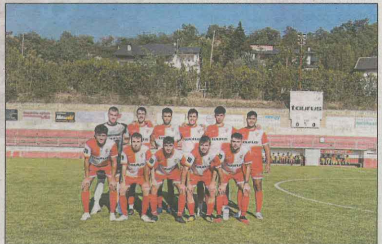
El Oliana mostró su mejor versión ante el Coll de Nargó

que el equipo llegó a remontar el partido en la segunda parte con los goles de Manel y Max Rossell, en propia puerta. Con esta derrota del Artesa, la Copa Catalunya Amateur se queda sin representación de equipos leridanos.