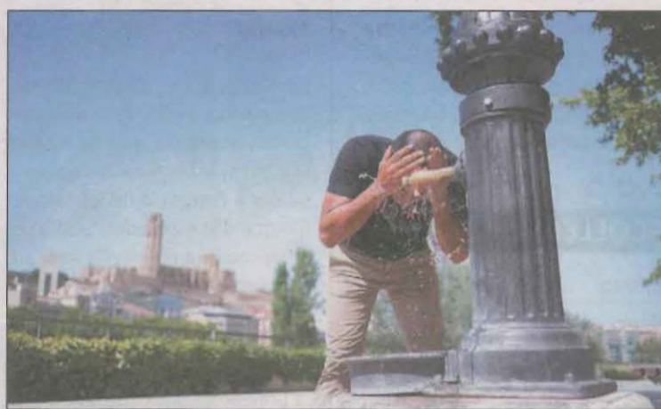
Un home es refresca en una font de Lleida

avui encara més greu. Mentre que ahir dissabte la calor intensa es va notar sobretot en algunes comarques de la demarcació de Lleida, avui diumenge es notarà a tot Catalunya en les hores centrals del dia, entre les 12 i les 18 hores.