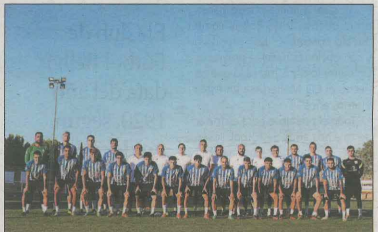
El primer equipo del Artesa Lleida 2023-2024