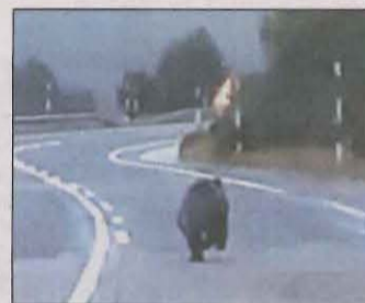
El animal corriendo en la calzada