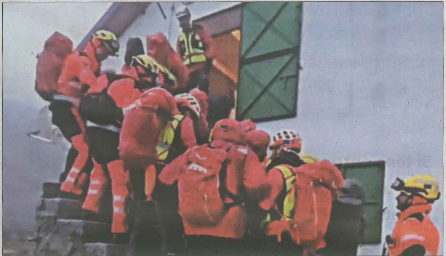
Moment en què els efectius dels Bombers traslladaven al ferit que presentava signes greus d'hipotèrmia fins al refugi

Per donar suport en la recerca i el rescat de les altres dues persones, els Bombers van activar dos helicòpters més per traslladar personal a la zona, un amb