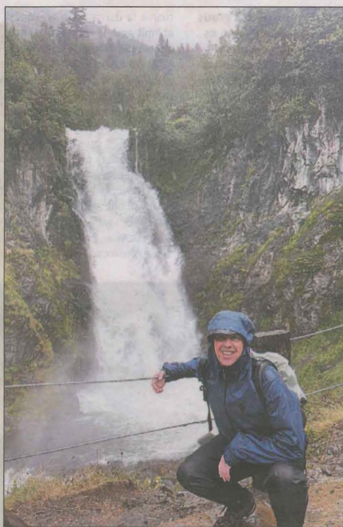
Un turista ahir al Saut deth Pish