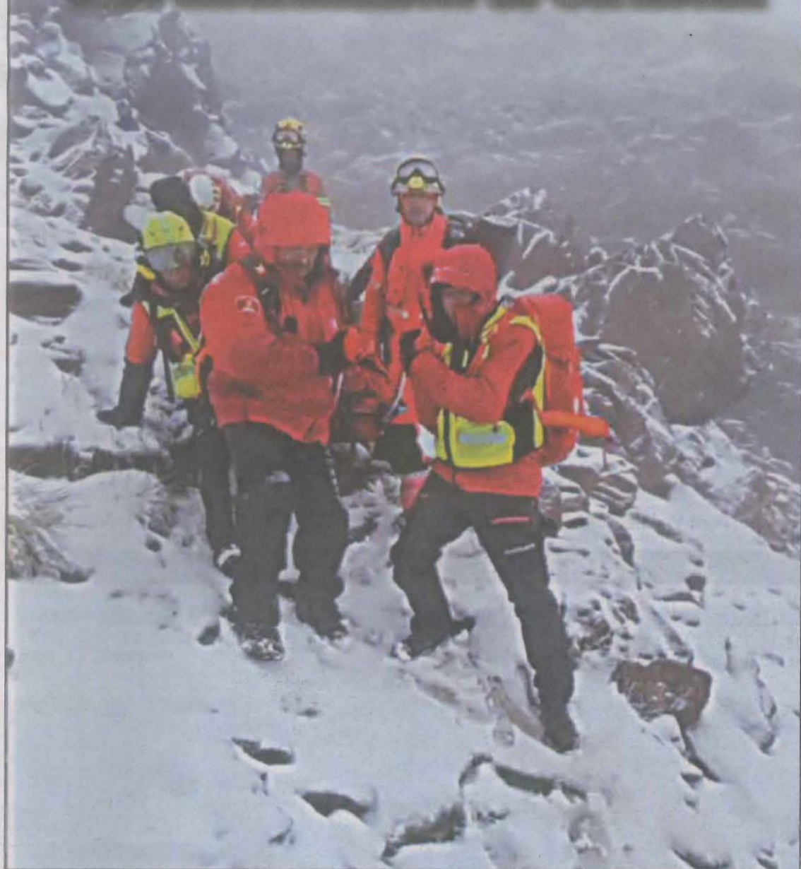
Fueron evacuados hasta el refugio el domingo y ayer a Tremp en helicóptero