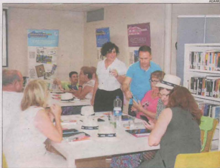
Voluntaris d'Adamo van oferir a finals de juliol un taller de noves tecnologies a la biblioteca Màrius Torres de Vinaixa.

VINAIXA | La gent gran de Vinaixa vol seguir el ritme dels temps. Prova d'això és que una desena de veïns d'aquest municipi de les Garrigues van participar a finals de juliol en un taller de noves tecnologies organitzat per voluntaris de la companyia Adamo. Un total de set voluntaris d'aquest proveïdor de serveis d'internet van iniciar els participants en l'ús de WhatsApp (en alguns casos van ampliar certs coneixements previs sobre l'aplicació), els van ensenyar a buscar una ruta a Google Maps o una recepta de cuina a YouTube.