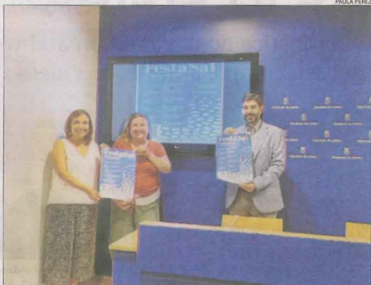
Presentació ahir de la FestaSal que se celebrarà dissabte.

Els petits també tindran el seu espai a la festa, ja que a partir de les 10.00 hores podran participar en un taller de confecció de figures amb pasta de sal (requereix inscripció). Així mateix, durant el dia,