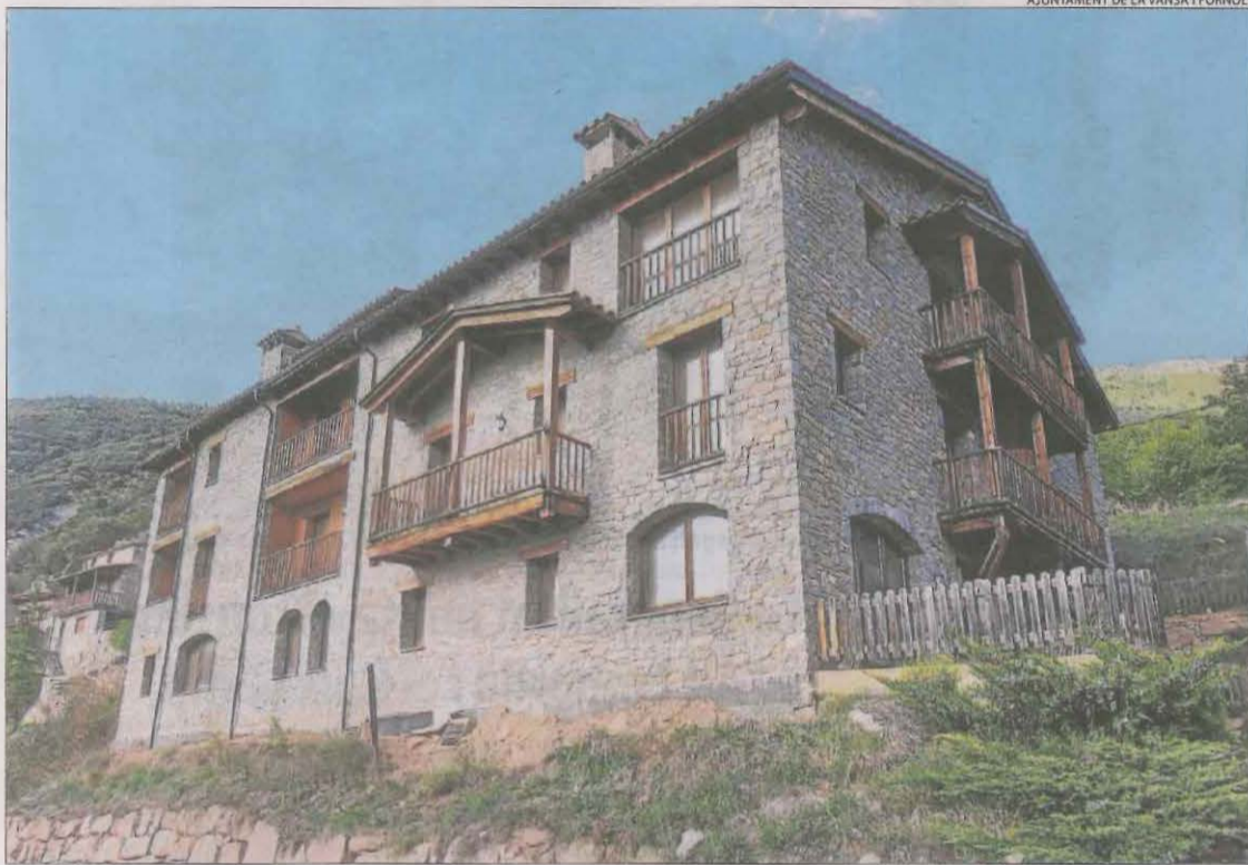
Imatge de l'edifici L'Hortal de Cornellana, al municipi de la Vansa i Fórnols.