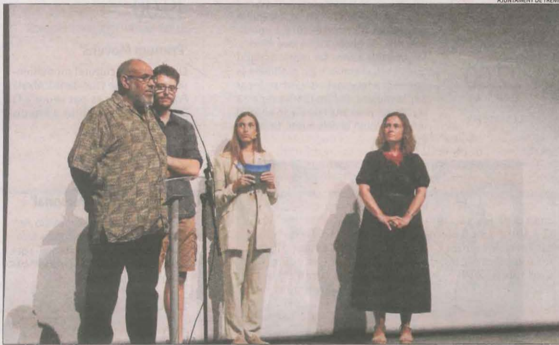
Un moment de la gala inaugural del festival Mostremp celebrada ahir a La Lira.

El festival compta amb una secció oficial en què s'exhibiran 16 curtmetratges de temàtica rural, d'entre els 290 rebuts per l'organització. D'entre la programació complementària, s'ha de destacar la Festa del Cinema aquesta nit amb la música de Na