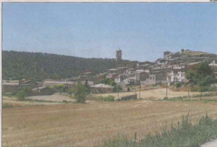
Imatge d'arxiu d'una vista dels Omells de na Gaia.

A més a més de Lleida ciutat, els altres cinc municipis de la província que acumulen més deute també són capitals de comarca. En concret, es tracta de Mollerussa (amb aproximadament 8,9 milions d'euros), Tàrraga (5,1), Balaguer (uns 4,5), la Seu d'Urgell (gairebé 4,3) i les Borges Blanques (3,4). En aquest sentit, només tres capitals deuen menys d'un milió d'euros als bancs. Una d'aquestes és Vielha i les altres dos són Tremp (822.000 euros) i Sort (201.000).