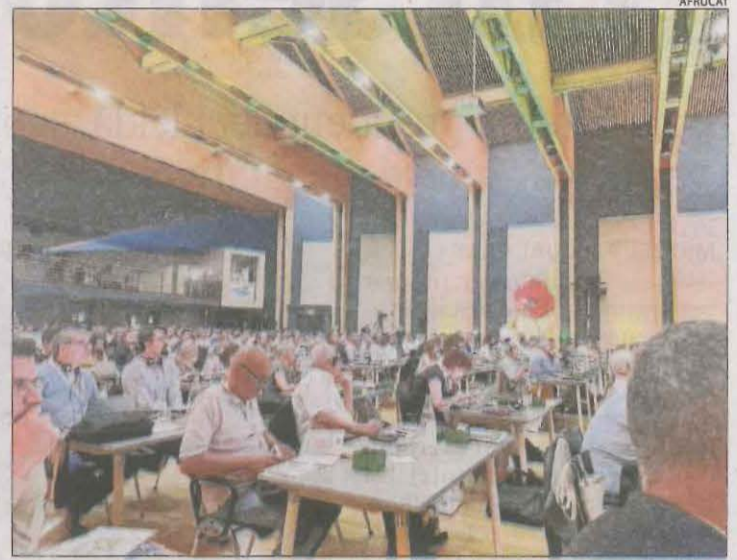
Afrucat participa en Prognosfruit a Trento (Itàlia).

Destaca la recuperació productiva respecte de França (+8 per cent; 1.500.000 tones), Hongria (+96 per cent; 550.000 t), Portugal (+7 per cent; 313.000 t) i Espanya (+30%; 536.000 t). En canvi, es preveu una disminució respecte al 2022 d'Itàlia (-0,4%; 2.100.000 t), Alemanya (-11%; 952.000 t), i Polònia (-11%; 3.995.000 t). L'evolució dels preus de venda