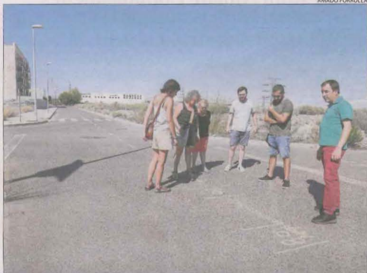
Les marques que han despertat sospites a Lleida.

REE va iniciar la tramitació d'aquesta línia a finals de la dècada passada, per substituir l'actual línia d'alta tensió entre Lleida i Barcelona per una altra de més capacitat. A les comarques lleidatanes, passarà pels mu-