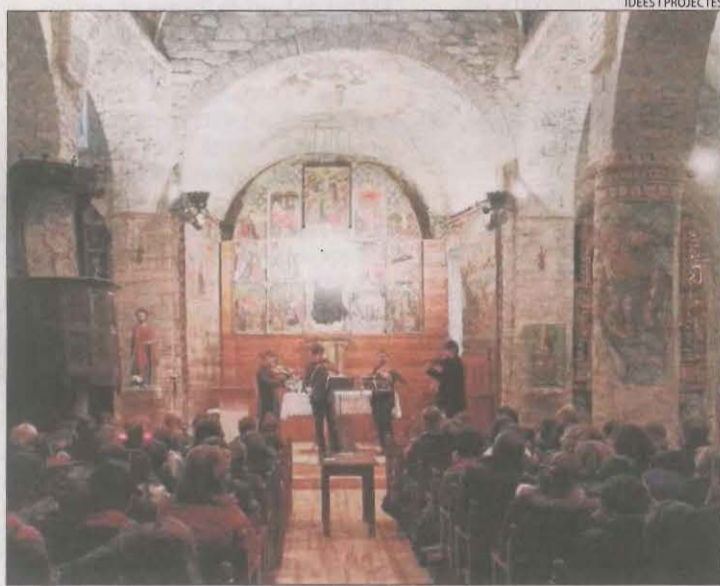
El quartet En Clau de Do, a Santa Maria d'Arties el 2018.