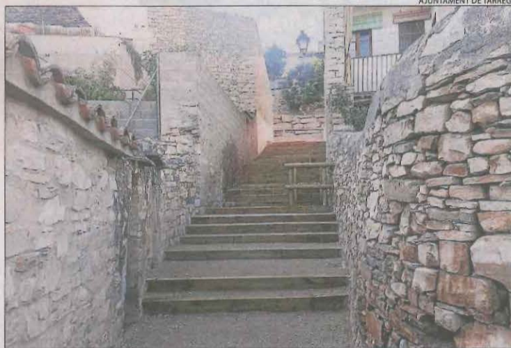
El carrer del Cantonet, al Talladell, després de l'actuació.