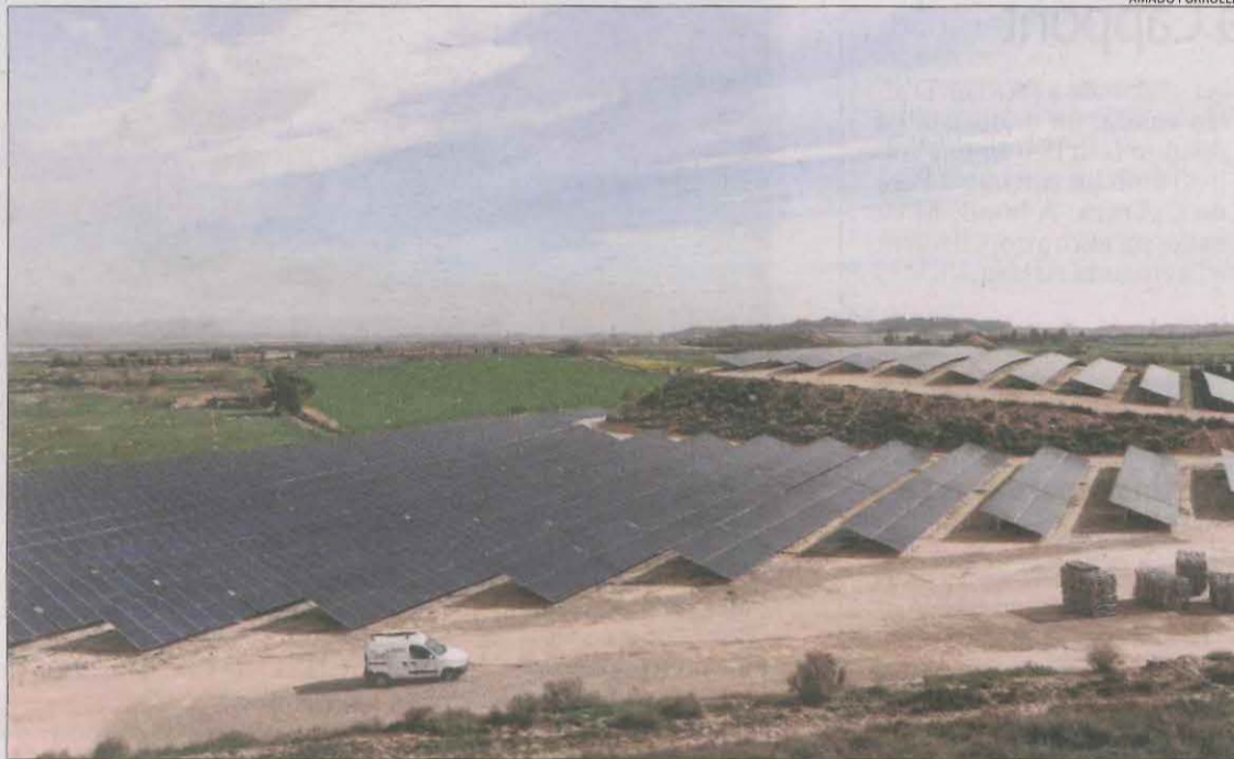
Imatge d'arxiu de panells solars al terme municipal d'Almacelles.

Davant les centrals ja autoritzades, desenes de projectes que sumen un altre miler d'hectàrees de panells solars a Lleida estan en tramitació davant de la Generalitat. Les comarques