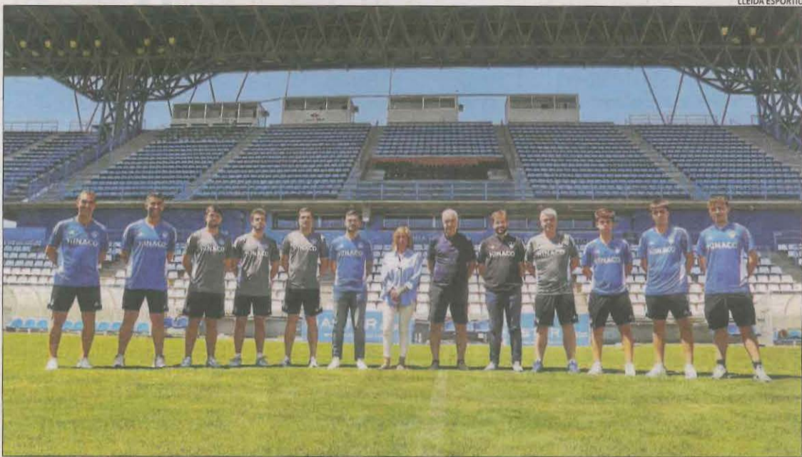
El president del Lleida Esportiu, al centre, amb els responsables del futbol base aquesta temporada.

Conveni entre el club i la Fundació per impulsar els equips formatius