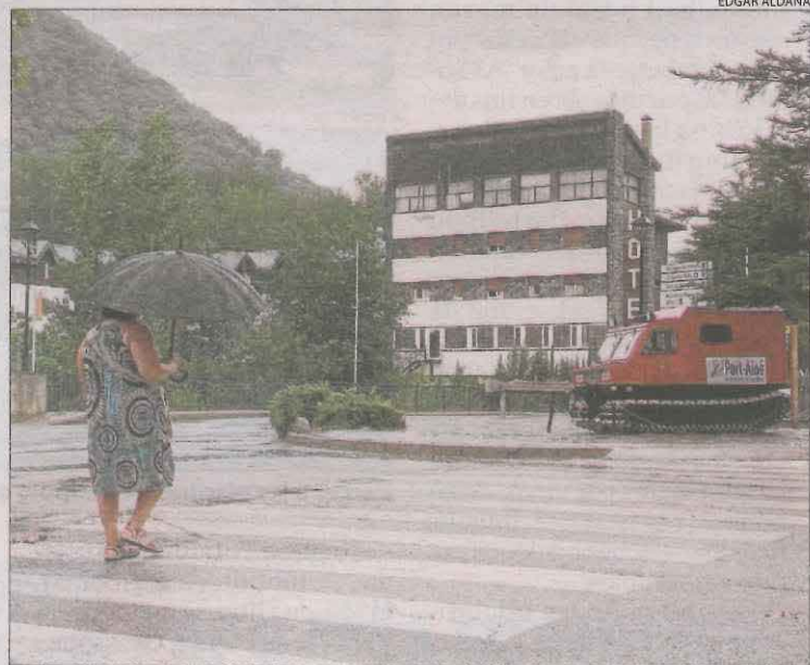
Pluja a Rialb, on es van registrar fins a 3 litres.