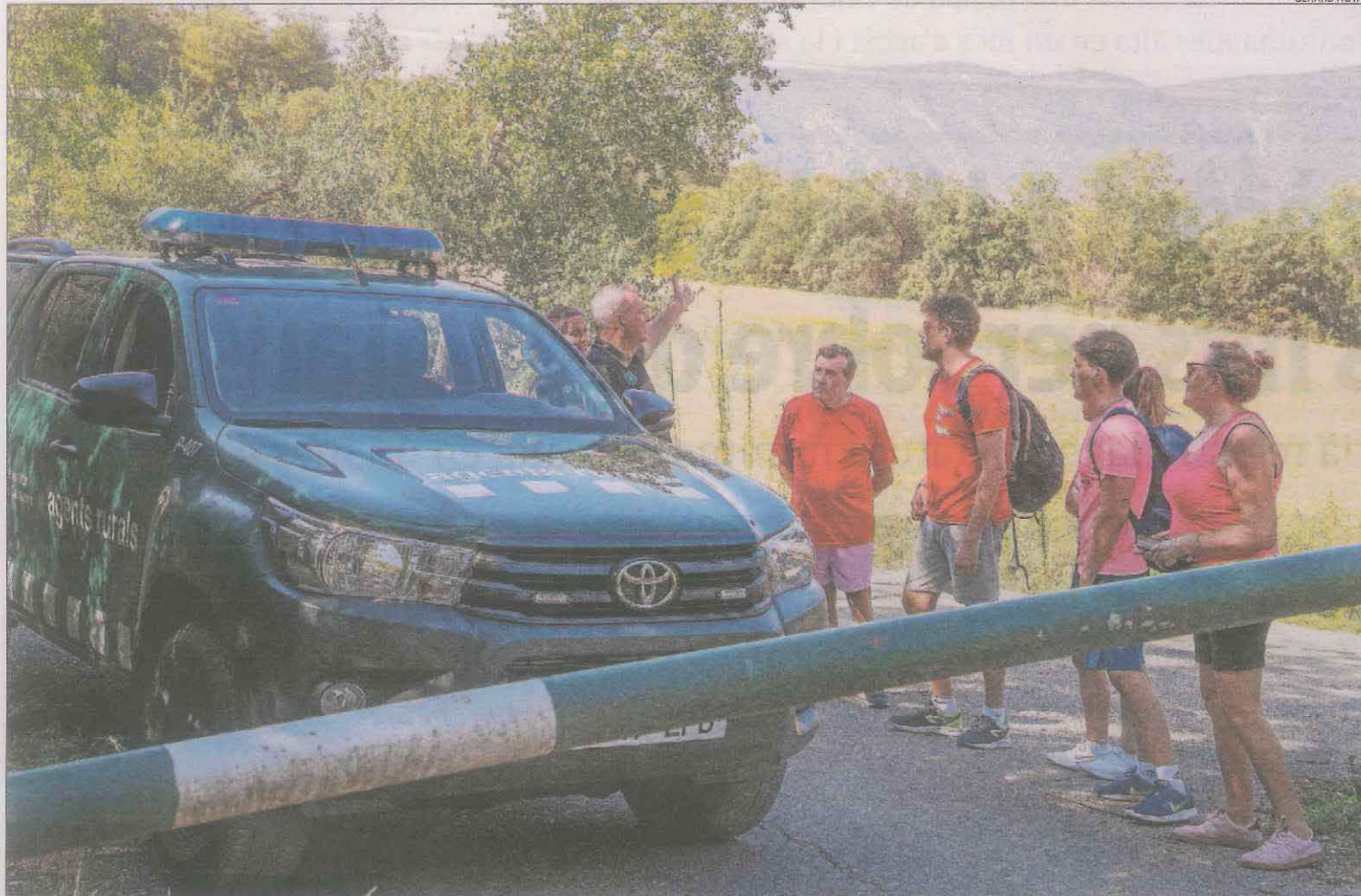
Els rurals informant ahir excursionistes del tancament de l'accés al congost de Mont-rebei a la zona del Montsec al nucli de Corçà.