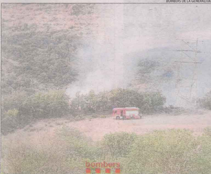
L'incendi registrat a Camarasa, a la zona de la Maçana.