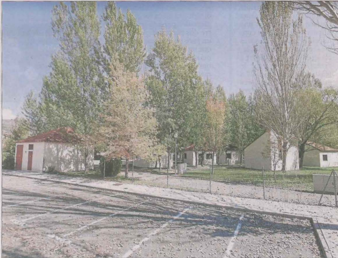
Els bungalows de l'àrea vacacional de la Pobla de Segur construïts a primers dels noranta.