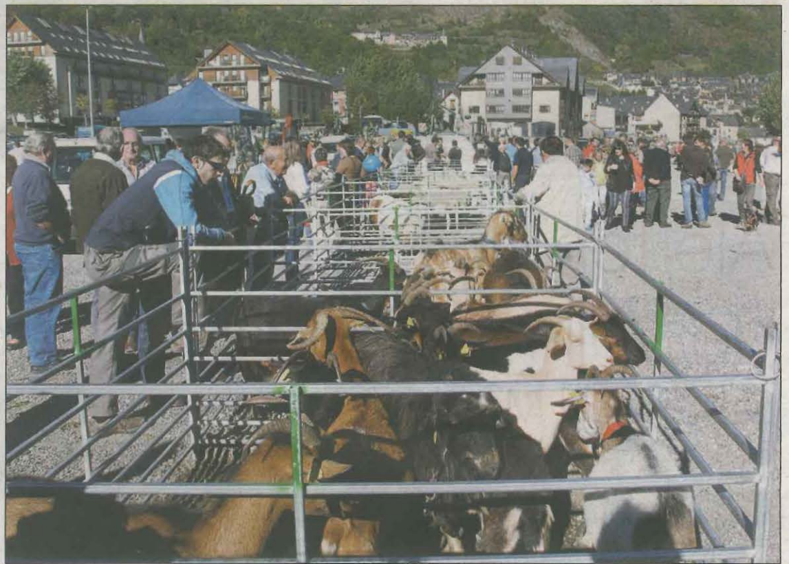
Imatge d'arxiu d'una edició de la fira ramadera que es celebra a Vielha, capital de l'Aran