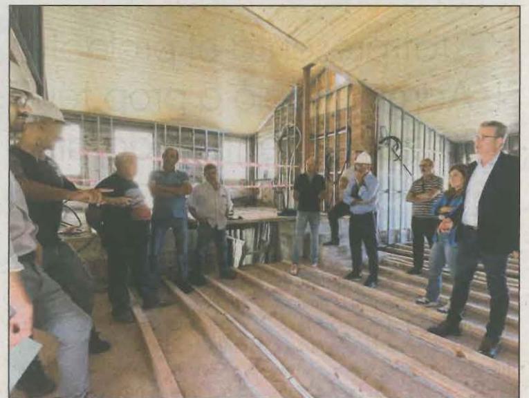
Talarn va visitar ahir les obres

El que no podria ser és que Sant Esteve, estigués sense seu per al consistori.