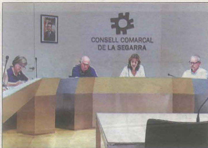
Ahir es va celebrar consells d'alcaldes i alcaldesses