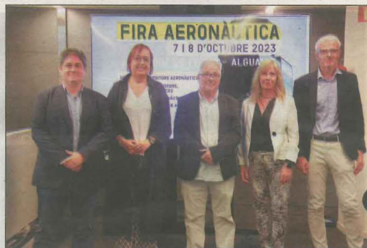
L'edició d'enguany es va presentar ahir a Lleida