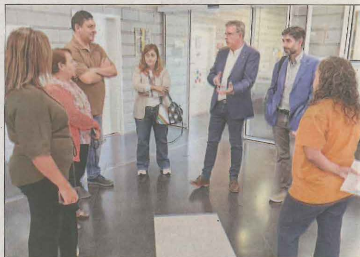
Talarn va visitar ahir les instal·lacions de l'associació

El president de la Diputació, Joan Talarn, va visitar ahir les instal·lacions d'AREMI i va destacar la gran tasca que l'associació està duent a terme amb les persones amb paràlisi cerebral. Talarn va refermar el suport de l'ens provincial amb l'associació amb la voluntat de continuar millorant la qualitat de vida de tot el col·lectiu d'usuaris i famílies.