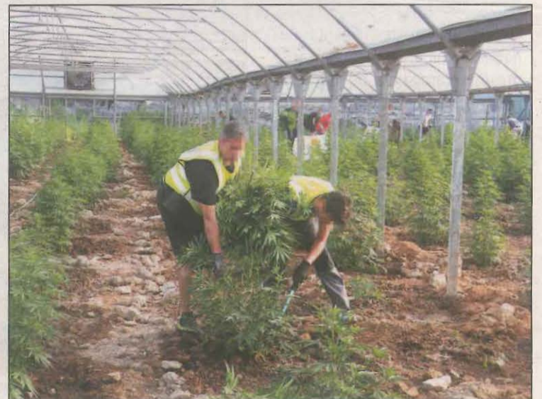
Mossos desmantellen una plantació de marihuana a Almatret

En qualsevol cas, els Mossos consideren que si no s'ha comissat un volum més elevat de plantes en aquests cultius ha estat a causa de la forta sequera que hi ha. I és que en moltes plantacions s'han trobat plantes mortes que no han arribat a arrelar per falta d'aigua. Una altra de les circumstàncies amb la que s'estan trobant els Mossos és que ja no hi ha plantacions de marihuana amagades entre el blat de moro. Aquesta havia estat una pràctica habitual en els darrers anys, ja que el cicle de la marihuana va en