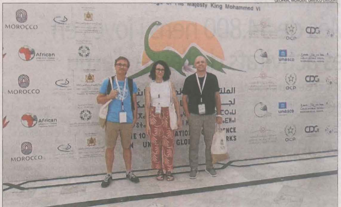
Els tres representants del Geoparc Orígens de Trep que van assistir al congrés a Marràqueix.

■ Tres representants del Geoparc Orígens de Trep es trobaven a Marràqueix quan el terratrèmol més devastador de l'últim segle al Marroc va sacsejar el país. Van assistir a la desena conferència biennal sobre els geoparcs mundials de la Unesco, que va comptar amb la participació de més de 1.000 persones de 200 geoparcs de tot el món. Els representants del centre de Trep van arribar dimecres a Marràqueix i van assistir a diversos actes, a més van poder compartir-hi el projecte de realitat virtual que estan duent a terme. Van explicar que "malgrat el fort impacte que va tenir el terratrèmol a nivell d'afectació en estructures i edificis com a nivell per-